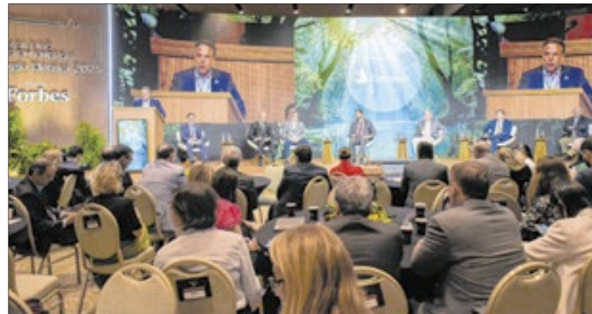
Ao longo dos dois dias, o fórum reuniu autoridades, políticos e empresários no Rio

O evento também foi palco da reunião extraordinária da Comissão de Minas e Energia. Com a presença de 15 deputados federais de diferentes estados e partidos, a mesa promoveu um debate sobre os rumos do setor.