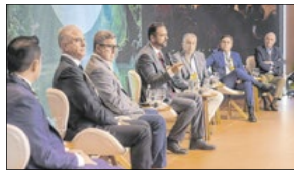
A reunião da comissão foi comandada pelo deputado federal Diego Andrade

Comandada pelo presidente do colegiado, deputado Diego Andrade (PSD/MG), a conversa girou em torno de gargalos estruturais, entraves regulatórios e caminhos para garantir eficiência, sustentabilidade e segurança energética para o país.