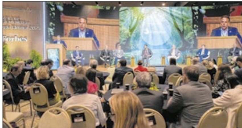
Ao longo dos dois dias, o fórum reuniu autoridades, políticos e empresários no Rio

O evento também foi palco da reunião extraordinária da Comissão de Minas e Energia. Com a presença de 15 deputados federais de diferentes estados e partidos, a mesa promoveu um debate sobre os rumos do setor.