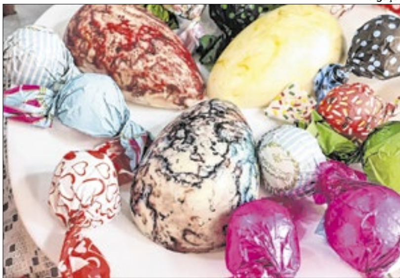
Pesquisa aponta que o gasto médio dos consumidores será de R$ 247

De acordo com a pesquisa, os ovos de chocolate industrializados (55%) serão os prin-