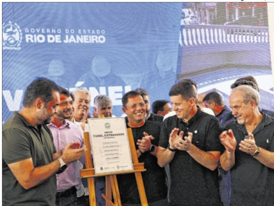
Extravasador é entregue pelo Governador Cláudio Castro, após três anos de intervenções

O túnel extravasador foi construído na década de 1960 e, desde então, não passava por manutenção. Ele tem uma extensão de quase três quilômetros, composto por um quilômetro de túnel escavado e aproximadamente 2,5 quilômetros de estrutura até seu deságue no rio Piabanha. O Governo do Estado assumiu a reforma depois da tragédia de 2022, quando a estrutura colapsou com a tragédia climática que atingiu a cidade. “As vezes chega uma chuva e leva tudo aquilo que a gente construiu com tanto