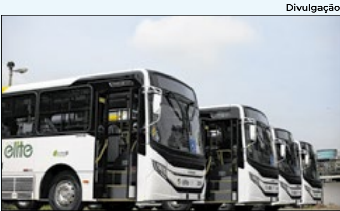
Currículos devem ser enviados para e-mail da empresa

gem ou Biomedicina. As inscrições estão abertas até o dia 30 de abril e os interessados poderão enviar seus currículos para o WhatsApp de número (24) 99973-7694.