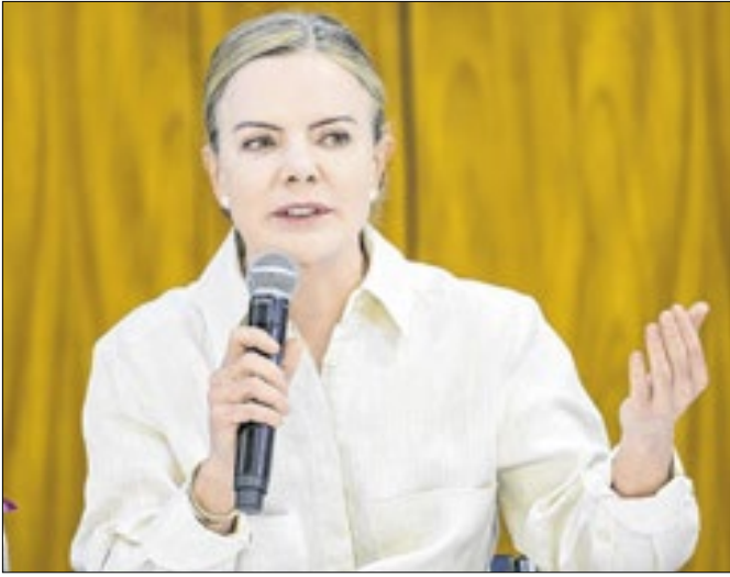
Gleisi deu o mapa de uma negociação em curso