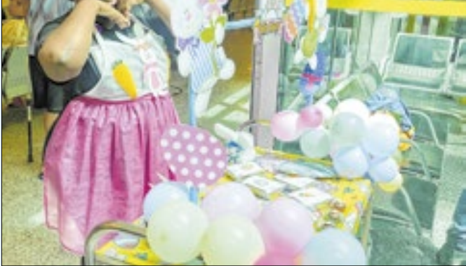
Dia especial de crianças do Into ajuda a recuperação