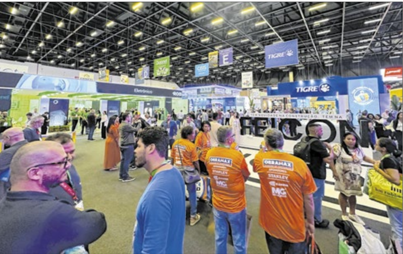
Os dois encontros - ENIC 100 e FEICOM - aconteceram ao mesmo tempo no São Paulo Expo

Caravana leva empresários do Estado do Rio para FEICON em São Paulo