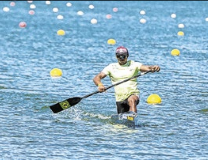
Isaquias Queiroz faturou mais uma medalha de ouro no C1

O campeão olímpico Isaquias Queiroz conquistou, no sábado (12) em Lagoa Santa (Minas Gerais), a medalha de ouro da prova do C1 1000 metros da Copa Brasil de Canoagem Velocidade. Após a vitória, o baiano afirmou que aproveitou a competição para realizar alguns testes.