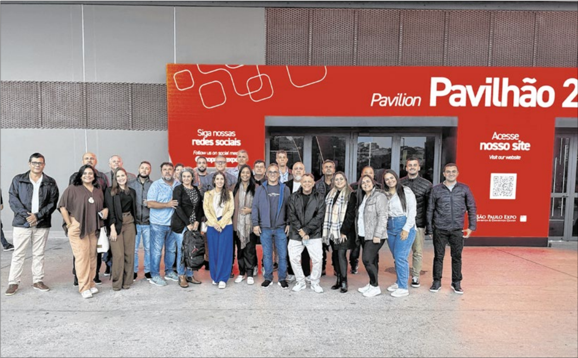
Ação do Sinduscon levou dezenas de empresários e associados do Médio Paraíba, no sul do Rio, até a capital paulista para conferir as principais tendências do mercado