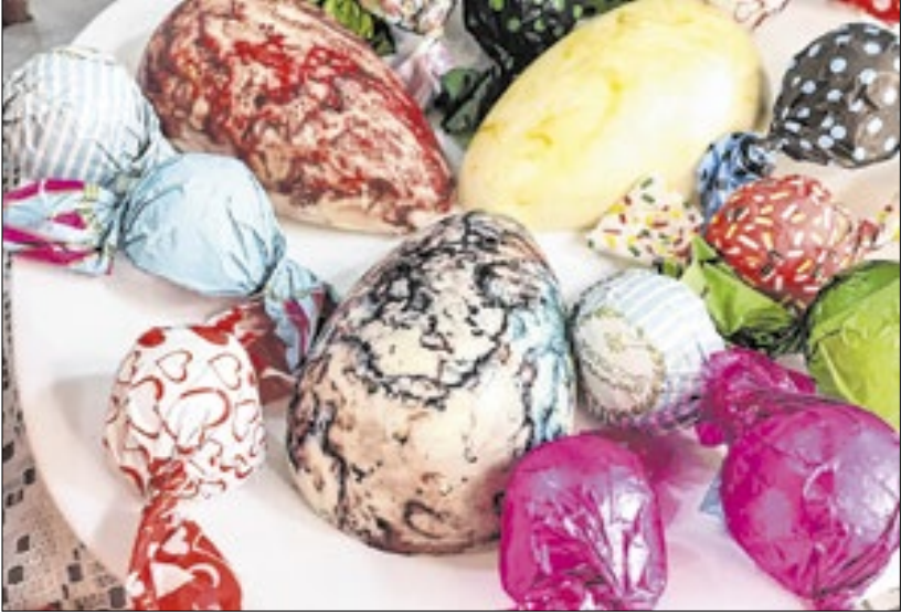
Pesquisa aponta que o gasto médio dos consumidores será de R$ 247

A Páscoa, que neste ano será celebrada em 20 de abril, promete aquecer o comércio varejista de Petrópolis com uma oferta diversificada de produtos e serviços. Em meio a um feriado prolongado – que vai da Sexta-feira Santa (18) até o Dia de São Jorge (23) – a expectativa dos lojistas é positiva, tanto pela circulação de turistas quanto, principalmente, pela busca crescente por presentes criativos, personalizados e experiências gastronômicas. A Câmara de Dirigentes Lojistas de Petrópolis divulgou nesta sexta-feira, pesquisa da Confederação Nacional de Dirigentes Lojistas (CNDL) e do Serviço de Proteção ao Crédito (SPC Brasil), em parceria com a Offerwise. Pesquisas que apontam que a data deve levar 102,6 milhões de consumidores às compras. Os consumidores pretendem gastar, em média, R$247 com as compras de Páscoa, adquirindo em média 5 produtos.