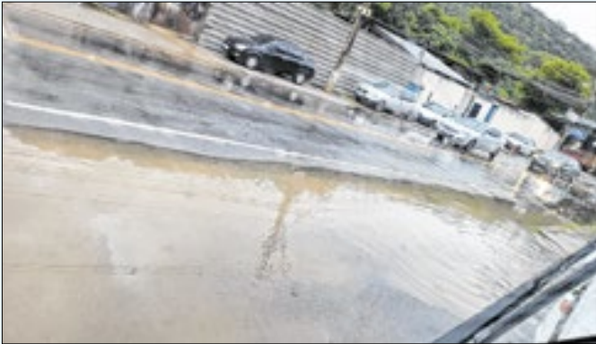
Vias ficaram alagadas depois da chuva