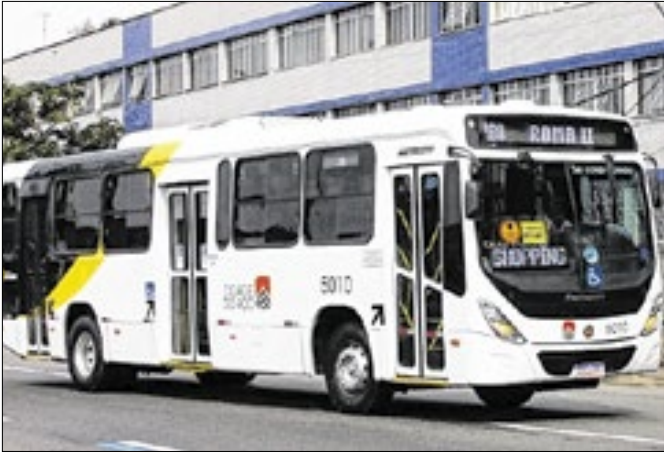
Viação oferece possibilidade de contratação imediata

A Viação Cidade do Aço está com vagas abertas para motorista urbano com possibilidade de contratação imediata. Para se candidatar para a vaga, os interessados poderão enviar os currículos para o WhatsApp (24) 97402-1224. Os candidatos deverão ter CNH de catego-