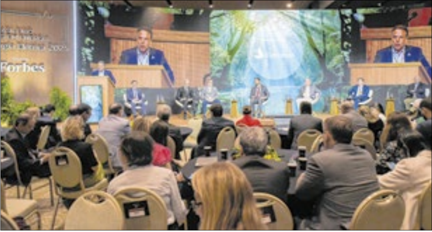
Ao longo dos dois dias, o fórum reuniu autoridades, políticos e empresários no Rio

O evento também foi palco da reunião extraordinária da Comissão de Minas e Energia. Com a presença de 15 deputados federais de diferentes estados e partidos, a mesa promoveu um debate sobre os rumos do setor.