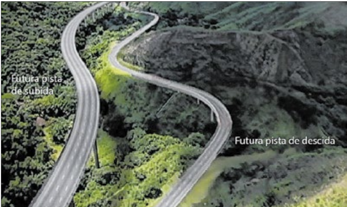
Obras na Via Dutra completam um ano com 25% de execução feitas pela CCR RioSP

As obras de duplicação da Serra das Araras, na Rodovia Presidente Dutra, na altura de Paracambi, serão visitadas pelo presidente Luiz Inácio Lula da Silva nesta terça-feira (15). O evento será a partir das 10h, numa região próxima a Paracambi, no Rio de Janeiro, na altura do km 225, sentido São Paulo/Paracambi. A previsão da concessionária é de entregar a nova pista de subida somente em 2028. Já a pista de descida deverá ser concluída em 2029.