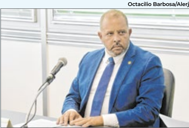
Proposta de Guilherme é isolar os membros de facções

Duque de Caxias e no distrito de Xerém. Além disso, discute estratégias para o desenvolvimento, realização e distribuição da produção audiovisual, por meio de palestras, oficinas, debates e ações de formação de plateia. O regulamento está no site: festivaldexerem.com.br .