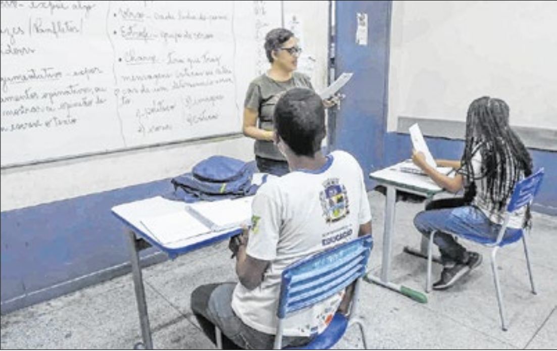
Projeto Mesquita Aprova dá cursos pré-técnico e pré-vestibular gratuitos

Na Assistência Social, o projeto “Não Desvie o Olhar” foi lançado para reforçar a segurança infantil durante festividades em locais públicos, como o Carnaval. Para isso, ele adota a distribuição de pulseiras de identificação para crianças usarem em eventos públicos, contendo informações de seus responsáveis, facilitando o encontro com eles caso os menores se percam. Nos primeiros dias de abril, o Projeto Convive com um Autista promoveu o primeiro Espaço Literário do ano, em celebração ao Dia Mundial de Conscienti-