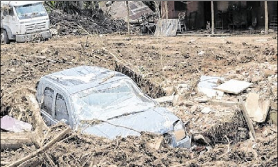
Nova Friburgo foi um dos municípios mais atingidos pela catástrofe de 2011

Na tramitação dos recursos o MPF apontou que durante o ocorrido, a prefeitura praticou diversas irregularidades como, superfaturamento de serviços