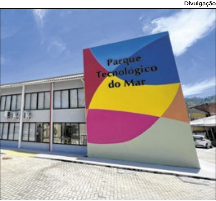
Iniciativa oferecerá suporte na elaboração de propostas

Com inscrições abertas até o dia 29 de abril, o edital da Fundação Carlos Chagas Filho de Amparo à Pesquisa do Estado do Rio de Janeiro (FAPERJ)