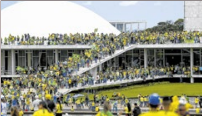
Quem participou do 8/01 serviu de massa de manobra