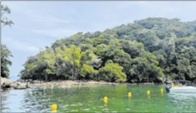
Lagoa Verde, na Ilha Grande-RJ, ganha projeto

Os banhistas que frequentam a Lagoa Verde, na Ilha Grande, e a Praia das Flechas, na Ilha da Gipoia, já podem nadar com mais segurança. Nesta semana, a Prefeitura de Angra dos Reis, por meio da TurisAngra, instalou boias do projeto Nado Livre nos dois locais. Na Lagoa Verde, a barreira de boias que impede a