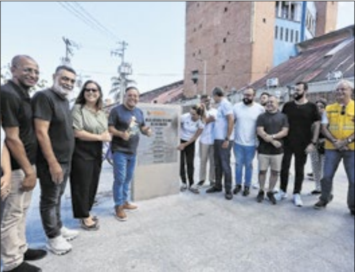
Avenida Visconde de Rio Branco passou por revitalização

de embarque e desembarque e de carga e descarga. Um nova ciclovia foi implementada, integrando a orla do centro.