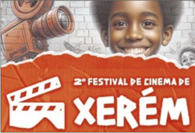
Os vencedores receberão o Troféu Zeca Pagodinho

Prefeitura promoveu melhorias em áreas como educação e saúde