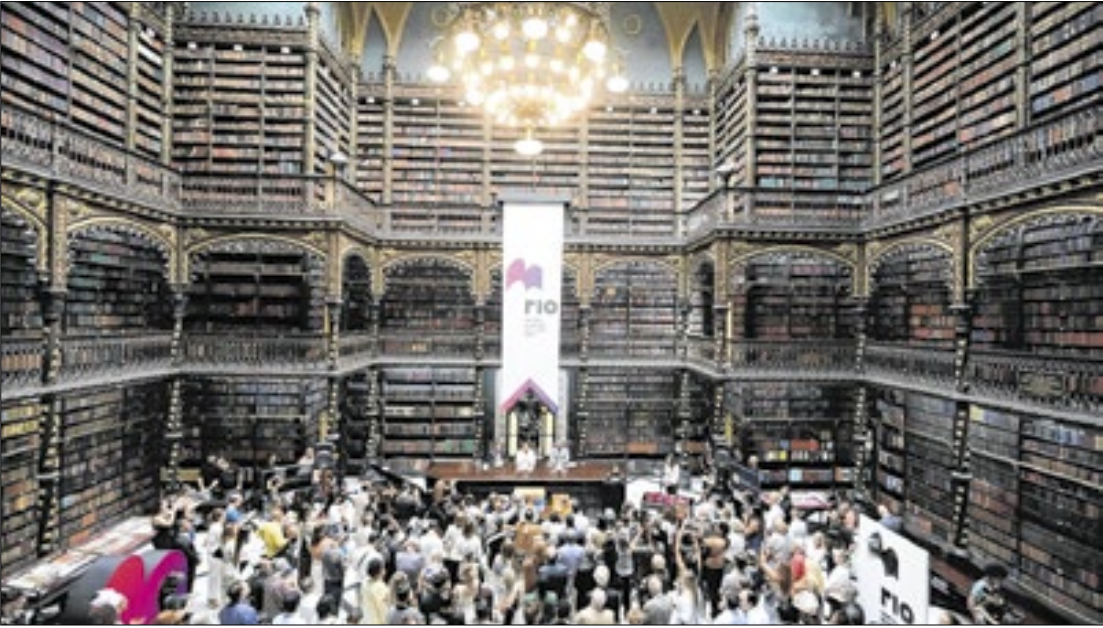
Beth Santos - Prefeitura do Rio

Durante o evento, foi assinado um protocolo de intenções com o Governo Federal, formalizando o apoio do Ministério da Cultura à iniciativa. O documento estabelece o intercâmbio de informações, dados e mapeamentos para o desenvolvimento conjunto de programas nas áreas de formação, livro e leitura. A assinatura foi realizada pelo prefeito Eduardo Paes e pela ministra da Cultura, Margareth Me-