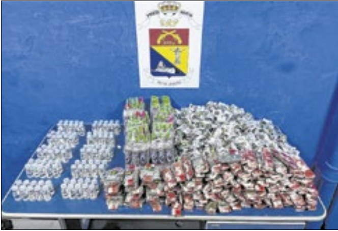
'Mula do tráfico' é reincidente no transporte de drogas