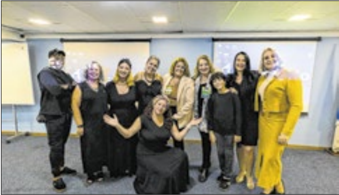
Ação em razão do mês Internacional das Mulheres

Em comemoração ao Mês Internacional da Mulher, a Secretaria Municipal dos Direitos da Mulher promoveu, na última sexta-feira (11), um treinamento sobre ‘empoderamento’ e ‘liderança’ no auditório da Universidade Estácio de Sá, direcionado especialmente para secretárias