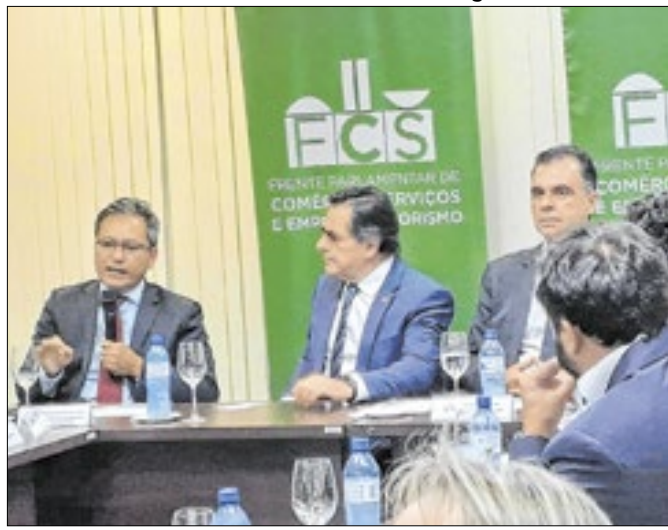
Barreirinhas: mudança no IR é questão de "justiça"