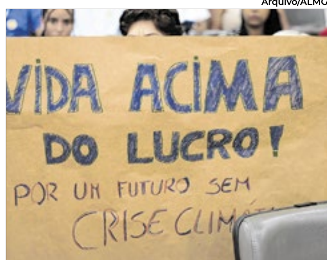
Sessão tratará de riscos e disputa sobre zoneamento