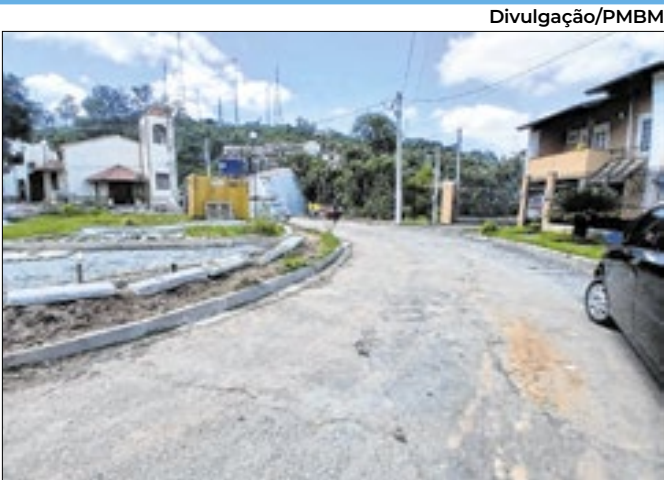
Via está localizada no bairro Santa Rosa.

Vagas são para nutricionista, auxiliar de Educação Infantil e motorista