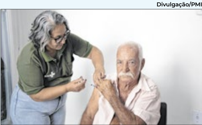
Vacinação é destinada para diversos grupos

ma, Audiometria e Espirometria sem se deslocar para outras cidades. A expectativa é que a fila de espera seja completamente eliminada em prazo estimado de 3 a 4 meses.