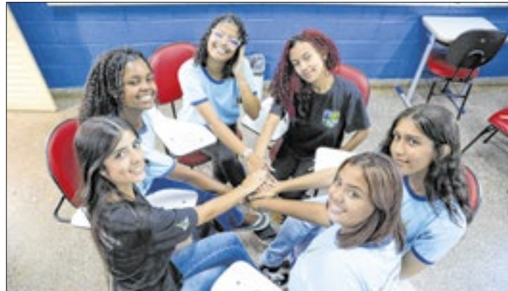
Ação do Riacho Fundo II será apresentada em Brasília