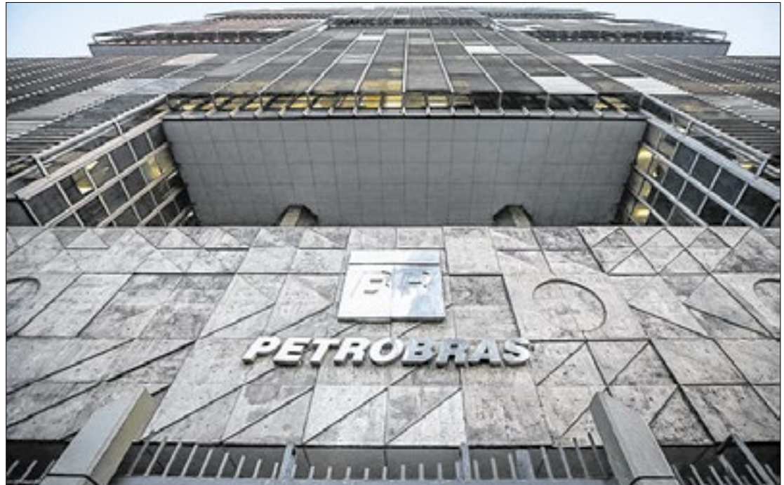
Princípio de transparência é inegociável, ainda mais quando envolve a vida do CEO