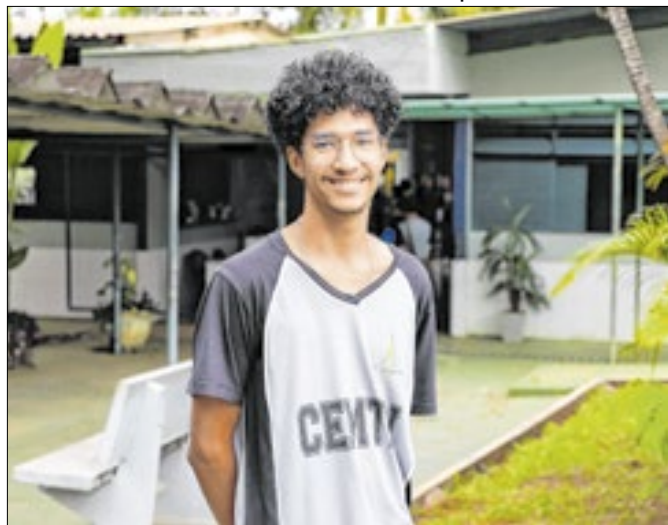
Estudante de Taguatinga ficou em 3º lugar