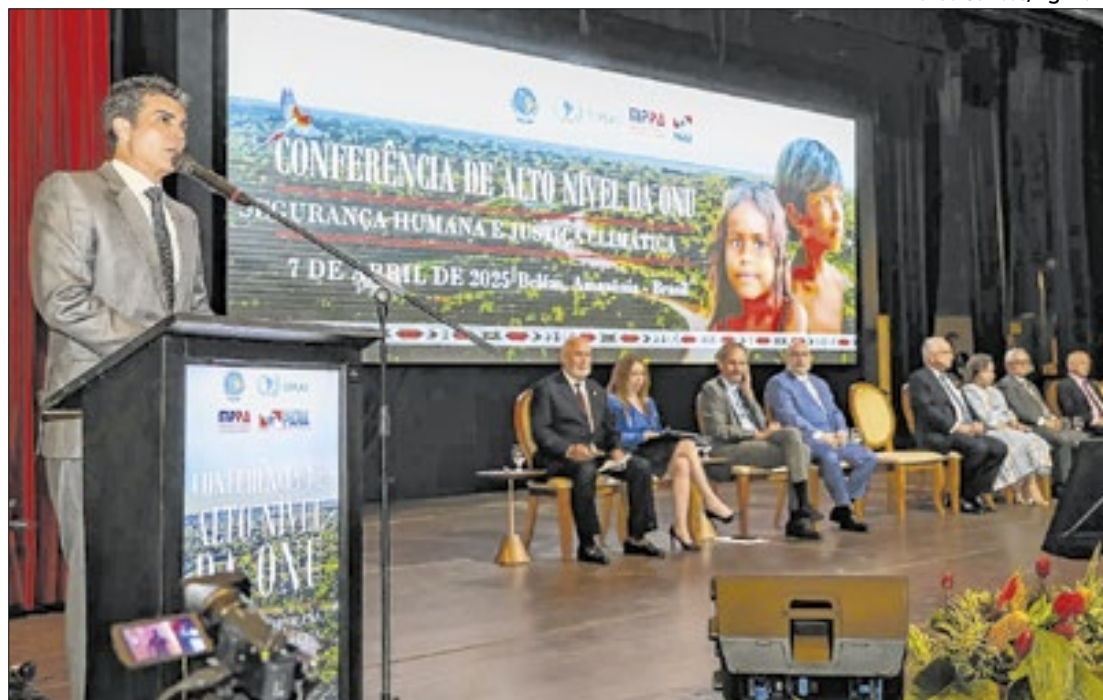
As discussões devem continuar nos próximos meses, como preparação para a COP 30

Entre os pontos abordados, estiveram políticas públicas relacionadas à bioeconomia e à compensação de emissões por meio dos créditos de carbono.