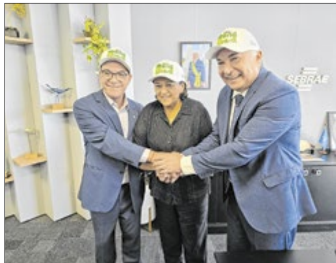
A governadora Fátima Bezerra destacou a Feira