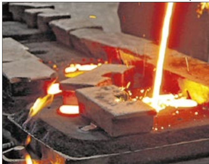
EUA: maiores importadores do aço e alumínio nacionais