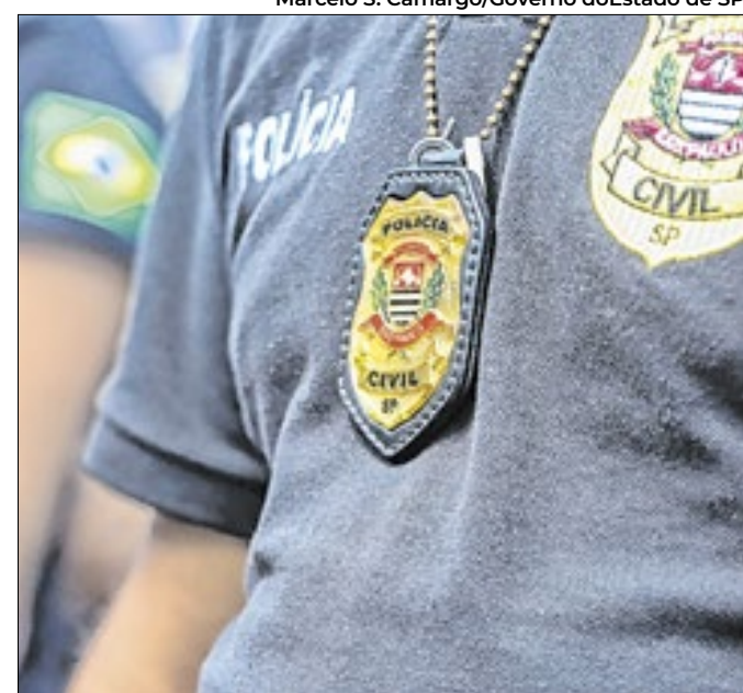
Os policiais civis arriscaram suas vidas