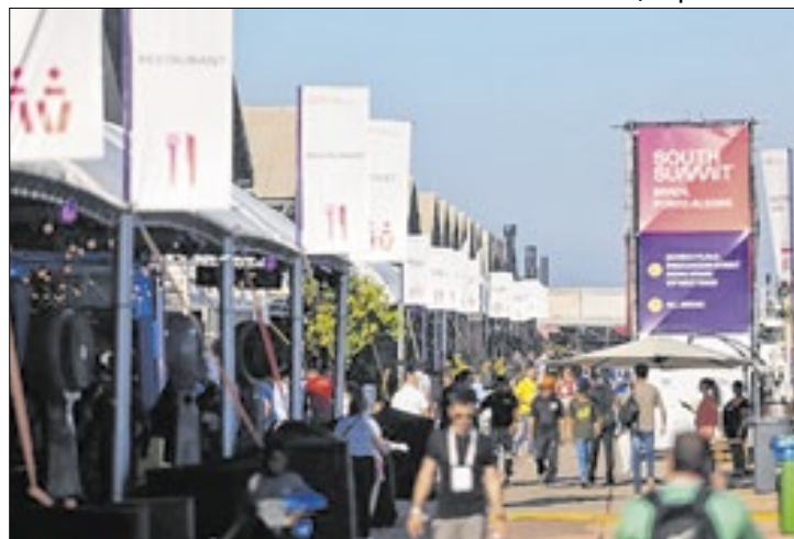
De um total de 28, 11 são do Estado

A final da Competição de Startups do South Summit Brazil (SSB) 2025 contará com a presença de 11 empresas do Rio Grande do Sul – o maior número entre os Estados brasileiros com representação na disputa. Logo após, estão São Paulo (8), Santa Catarina (3) e Pernambuco (3). O Brasil lidera entre os países, com 28 startups finalistas, seguido por Chile (6), Argentina (3) e México (3).