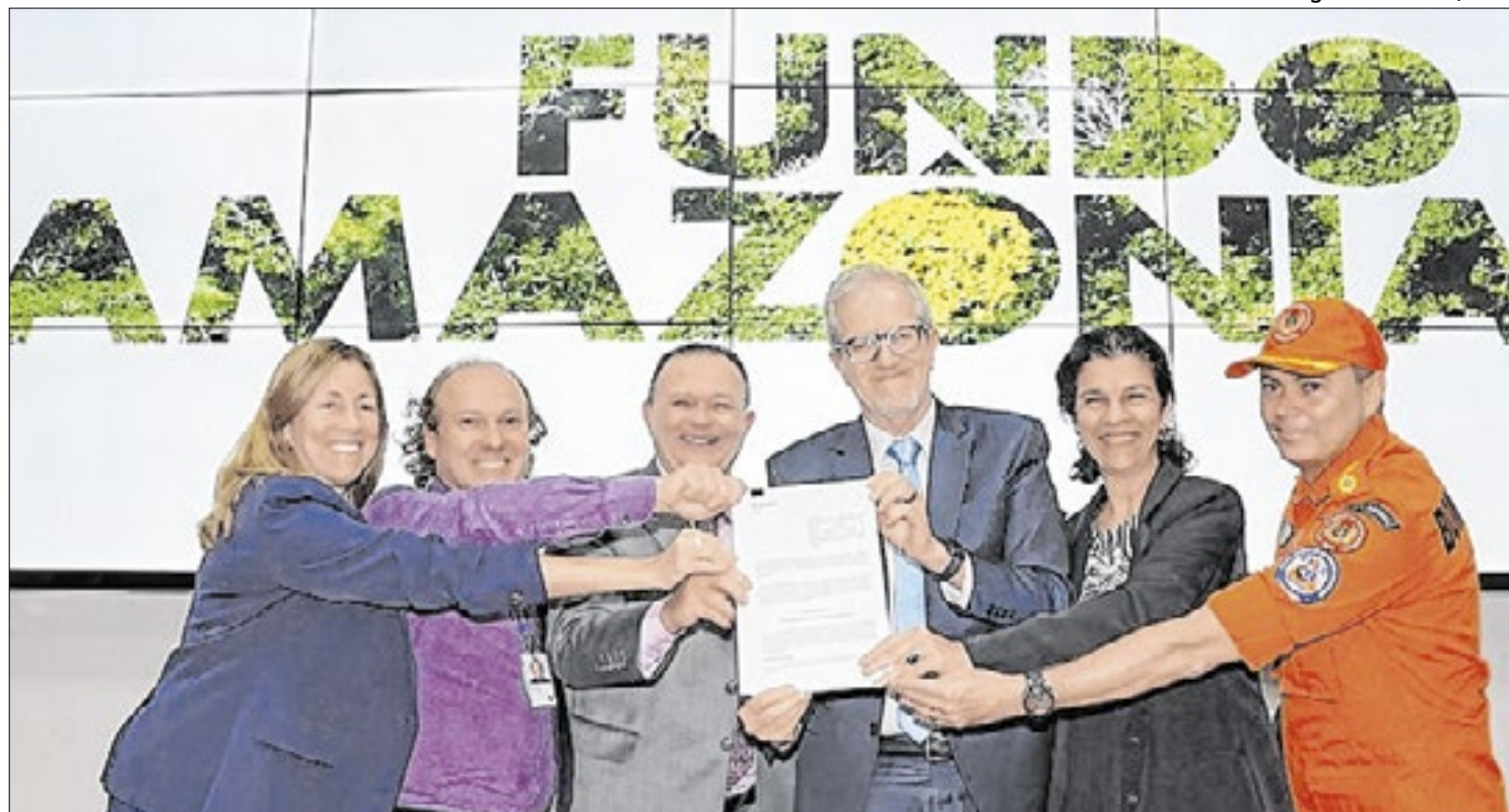
Maranhão é o oitavo estado a receber apoio para ações de prevenção