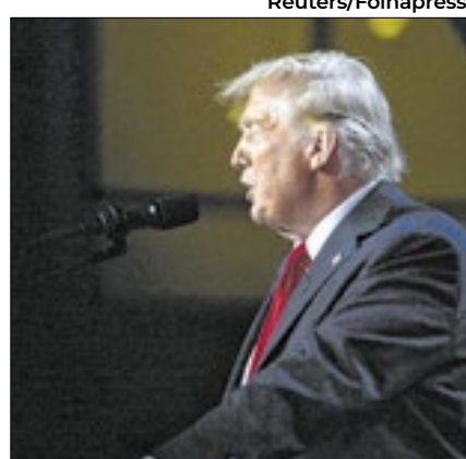
Donald Trump vai cumprir sua promessa de campanha

Três pessoas foram encontradas vivas, em colétes salva vidas - uma enfermeira, o piloto e um mecânico. Eles estavam com hipotermia, mas conscientes, e estão internados. O caso está sendo investigado.