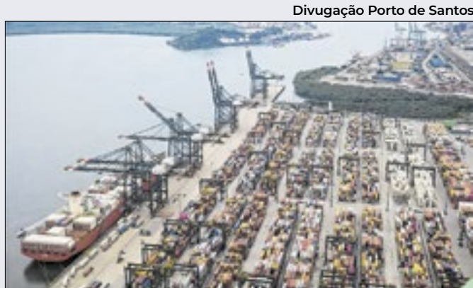
Balança comercial do país retoma o rumo do superávit