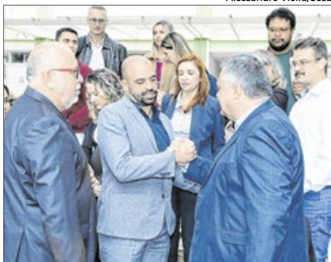
Santa Catarina e Paraná firmam acordo