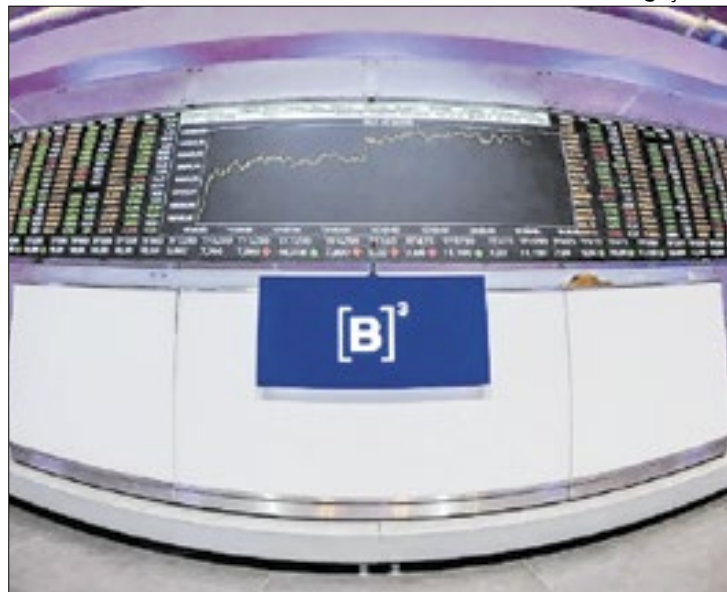
Aversão ao risco predominou no mercado, 'azedando' negócios

O desconforto com a política tarifária dos Estados Unidos continuou no período da tarde dessa segunda-feira (7), respaldado tanto pela tese de que traria consequências nocivas para a economia global quanto pelo alto grau de incerteza que ainda permeia o assunto. Investidores comentam que o mercado parece estar "à deriva" e negociando em torno de ruídos, sendo que por ora a aversão a risco predominou e o Ibovespa caiu pelo terceiro pregão consecutivo. Segunda ação com mais peso na carteira teórica, Petrobras fechou em queda de 5,57% (ON) e 3,97% (PN).