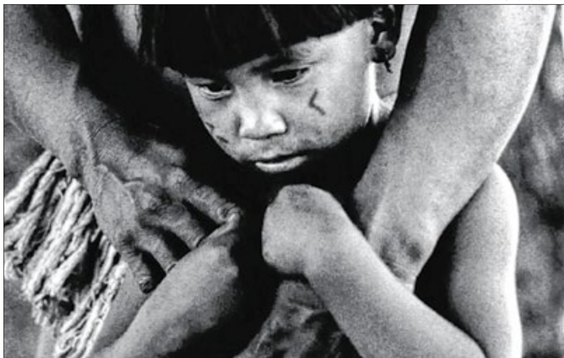
Exposição é a primeira depois da morte do fotógrafo, em 2022