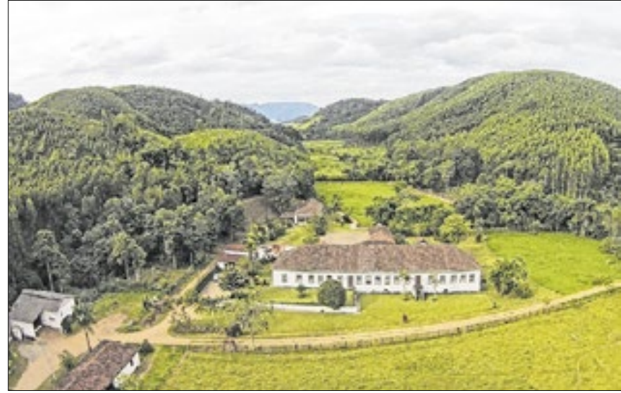
Fazendas do Vale do Café remontam turistas a século XIX

Esse tipo de turismo incentiva a preservação do patrimônio cultural e gera renda para a comunidade. "É uma forma de desenvolvimento sustentável que movimenta pequenos produtores, cozinheiros locais, guias, artesãos e produtores culturais", disse.