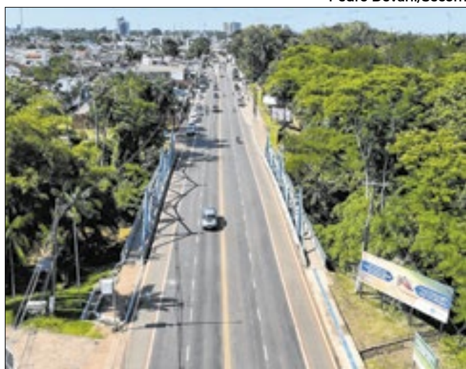
Intervenções em Rio Branco somam R$ 4 milhões