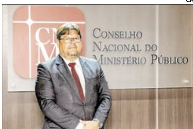
Ex-PGJ-RJ, Mattos é agora Assessor Especial na CNMP

Por unanimidade, os ministros do STF autorizaram o fim da exigência de excepcionalidade para a realização de operações policiais no estado, além de liberar novamente o uso de helicópteros em ações de segurança. Antes da decisão, a polícia tinha que avisar aos professores, funcionários da saúde e outros profissionais sobre a realização das operações, facilitando o vazamento