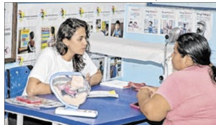
Evento com ações de saúde e cidadania para comunidades