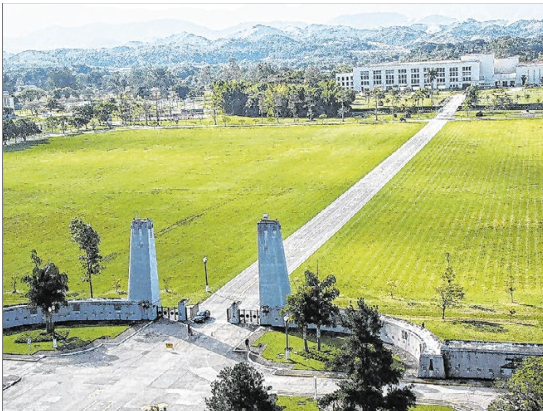
Sede da Aman, em Resende, no Estado do Rio de Janeiro, forma militares do país inteiro

"Será uma oportunidade ímpar para a AMAN ampliar seu ganho técnico e estar em consonância com as inovações tecnológicas empregadas nas diversas IESEP da região Sul Fluminense. Além, é claro, dos universitários compreenderem a sis-