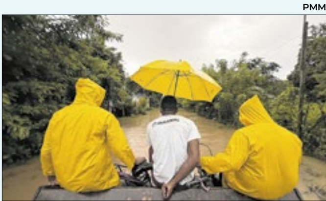
Equipes seguem em atendimento à população de Magé

mada para o próximo dia 09 e o outro ainda está em negociação. Vale ressaltar que há apartamentos reservados para estas famílias aguardando apenas a conclusão da negociação. A Prefeitura esclarece ainda que está trabalhando para tirar todas as famílias das áreas de risco.