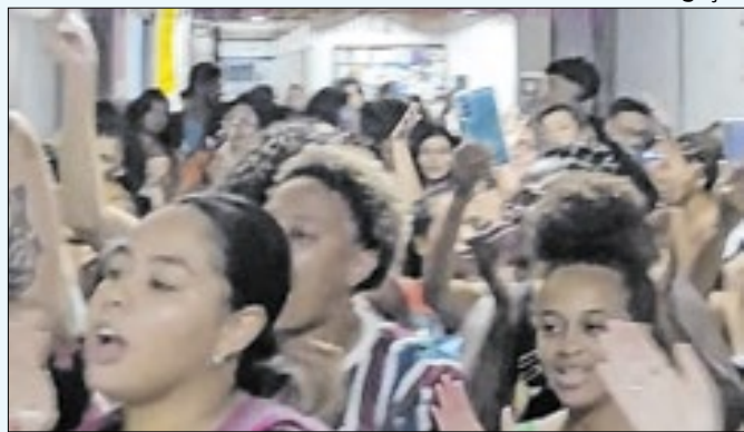
Colegas da aluna-mãe expulsa 'emparedaram' mestra