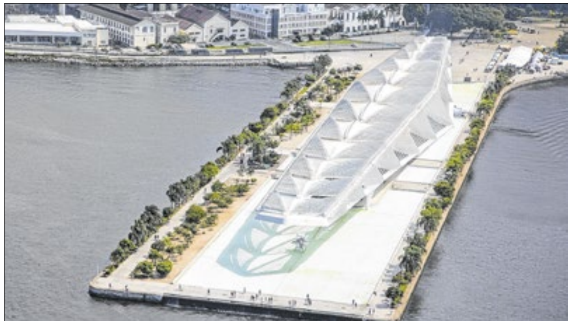
Captação de energia verde por instituições culturais se baseia em fontes limpas e renováveis

Dois importantes equipamentos culturais da cidade do Rio, o Museu do Amanhã e a Cidade das Artes, começaram a ser abastecidos com energia verde. O novo formato de captação de energia privilegia a adoção de fontes limpas e renováveis no Mercado Livre de Energia e já é utilizado pela sede da Prefeitura no Centro Administrativo São Sebastião (Cass) e outros órgãos públicos municipais, como o Centro de Operações (COR) e unidades de saúde. Chamado Rio de Energia Verde – Aquisição de Energia Limpa e Renovável no Mercado Livre de Energia, o projeto foi desenvolvido pela Subsecretaria de Gente e Gestão Compartilhada, da Secretaria Municipal de Fazenda e Planejamento. A aquisição de energia no Ambiente de Contratação Livre (ACL) faz parte do Programa de Eficiência Energética (PEE) da Prefeitura do Rio.