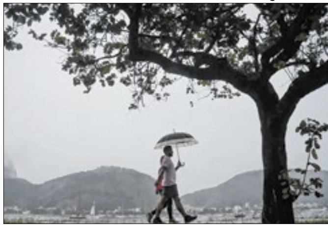
Apelo do prefeito retrata vulnerabilidade da cidade