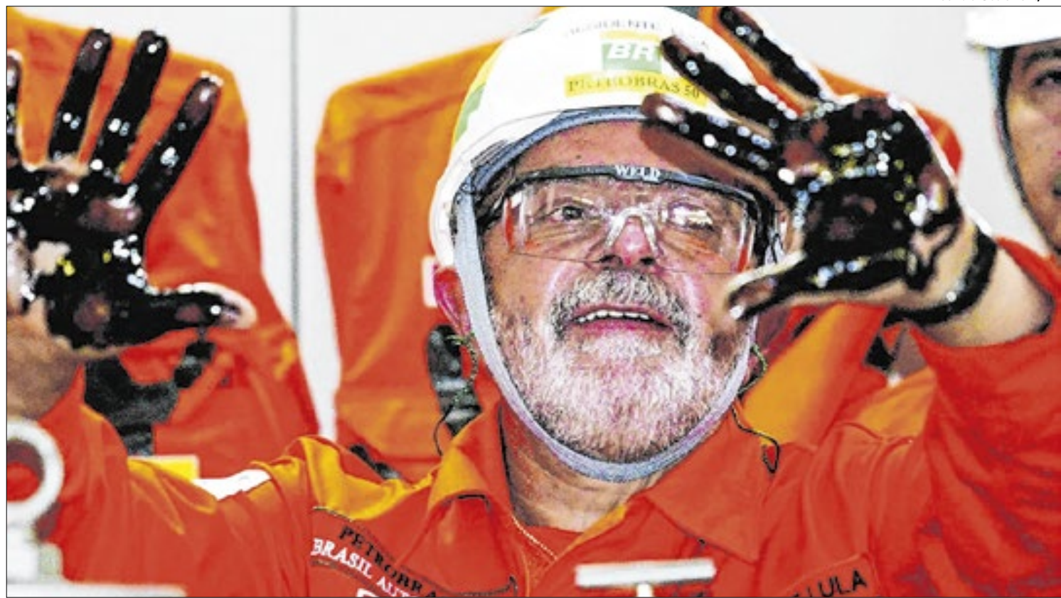
Lula e o pré-sal: exploração tem impactos nas comunidades mais carentes

O objetivo da pesquisa, que durou cinco anos, foi identificar os impactos segundo a perspectiva do território, com-