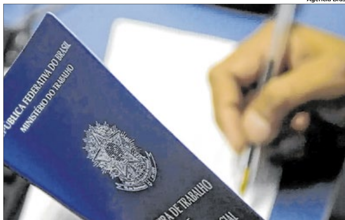
O desempenho representa um incremento de 110,9% em relação ao saldo de empregos

No ranking nacional, a Bahia ocupou a oitava colocação