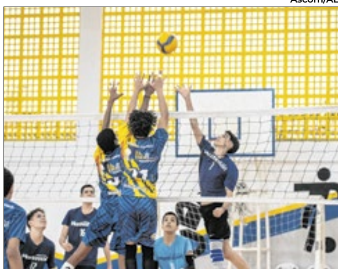
Competição contará com 22 modalidades