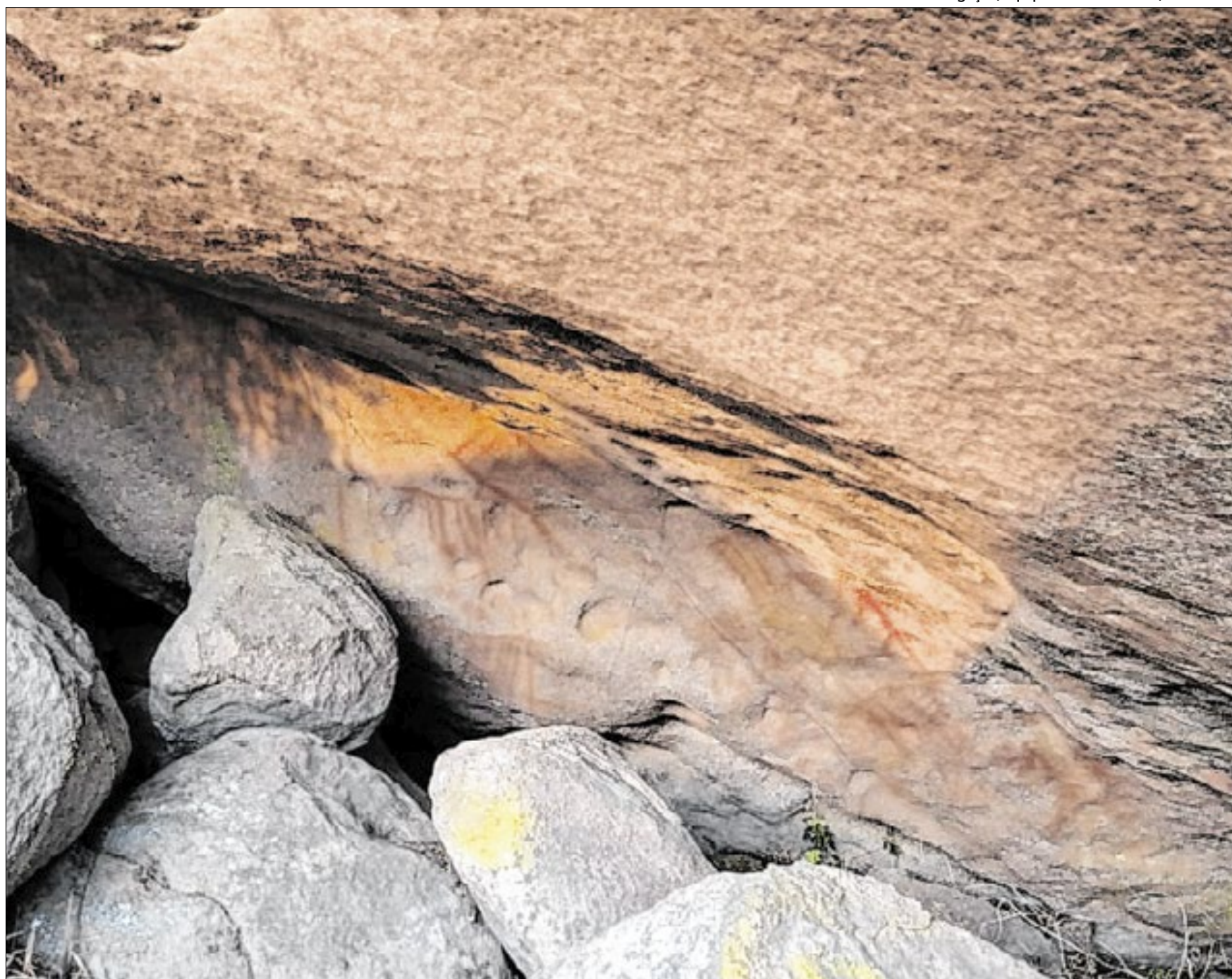
Pinturas foram encontradas por um colaborador da concessionária Parquetur, Andres Conquista, a mais de 2 mil metros de altitude