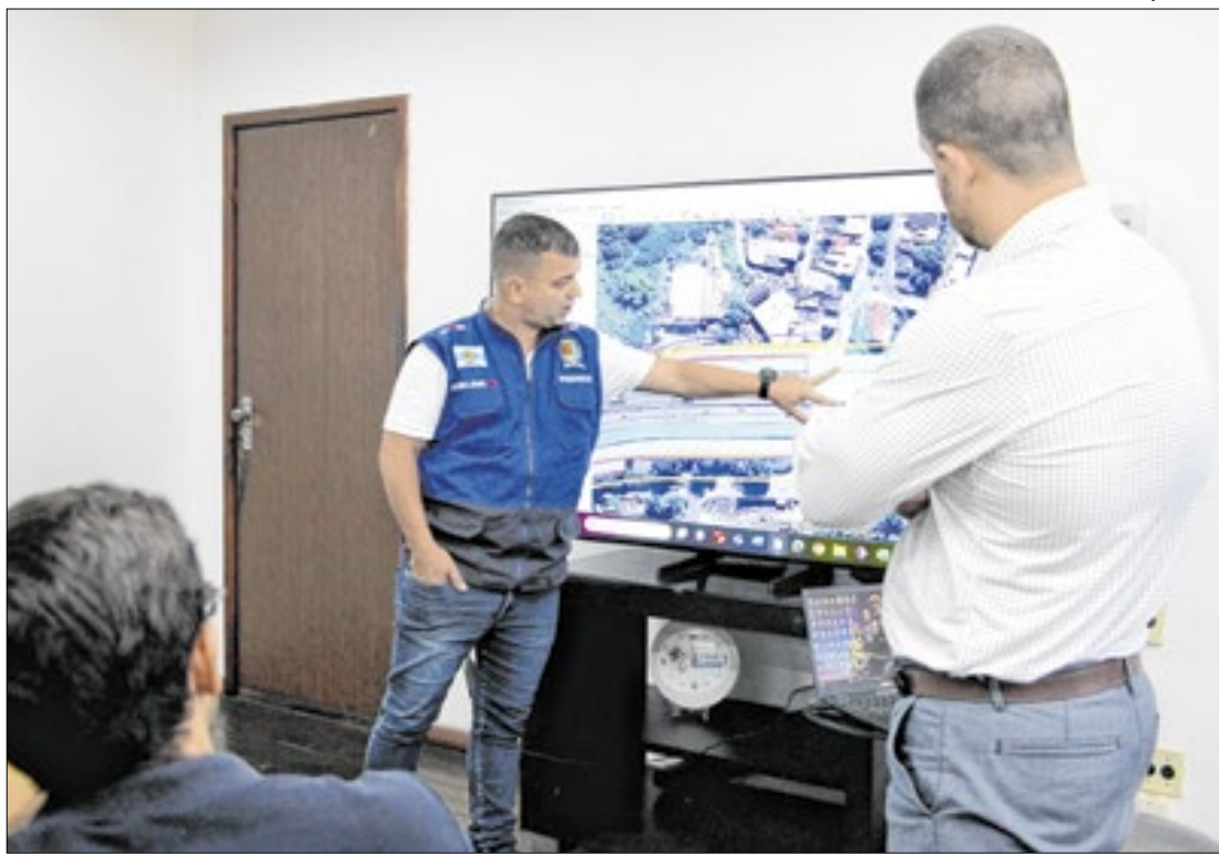
Concessionária debateu projeto de intervenções no trecho que corta a cidade, no interior

busca de uma reflexão a respeito das subjetividades dessas personagens e de suas narrativas. Os filmes em exibição obtêm diferentes linguagens artísticas - o cinema, as artes visuais, as artes cênicas - e esboçam imagens únicas que misturam a trajetória de vida e o curso profissional dos sujeitos retratados em tela.