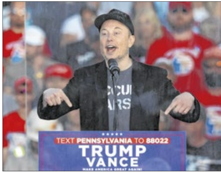
Bilionário voltará a dar atenção a suas empresas em breve

Um funcionário da Casa Branca disse à agência de notícias Reuters que os investidores de Musk