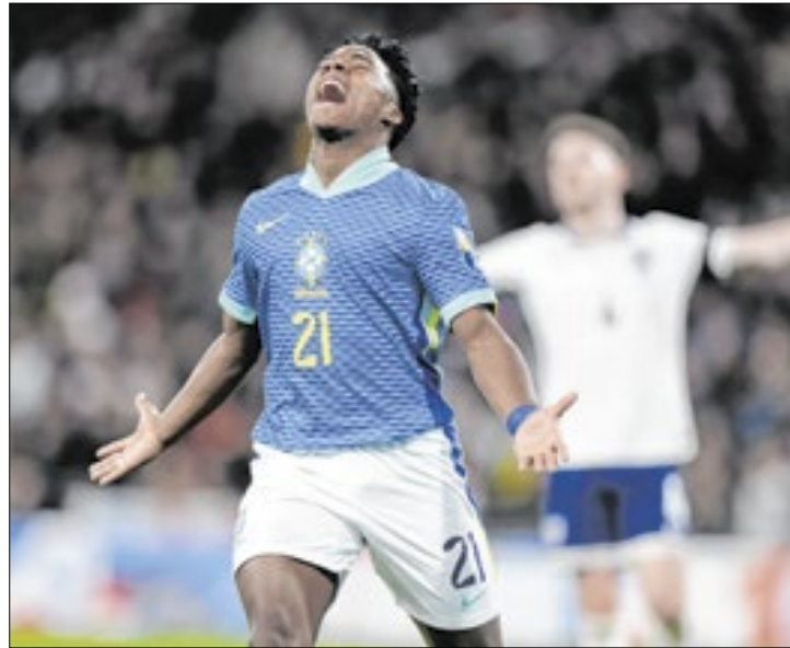
Endrick tem pouca minutagem no Real Madrid e na Seleção

Endrick tem recebido pouco tempo em campo: foram sete em 560 minutos, no total, em 29 jogos. Apesar da baixa minutagem,