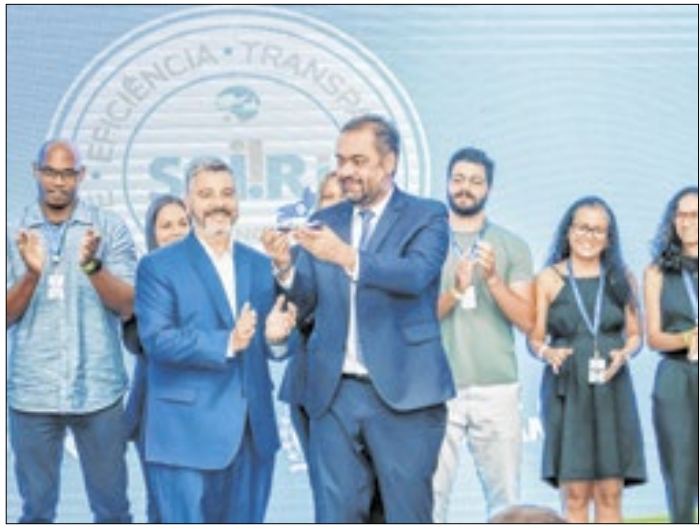
Castro celebra aniversário de 5 anos do sistema