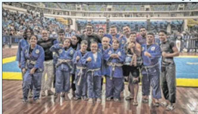
Iniciativa leva inclusão ao tatame com esporte adaptado