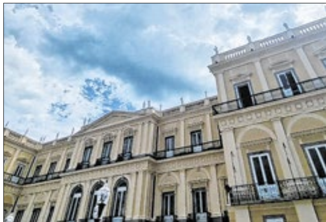
Reconstrução integral do museu consumirá R$ 516 mi