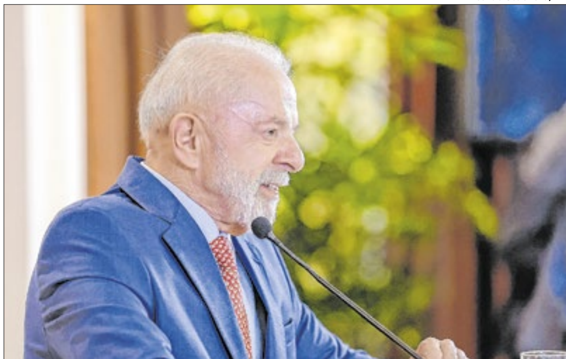
Desaprovação é a maior de todo o terceiro mandato de Lula

Quando se trata da avaliação da pessoa do presidente Lula, a situação encontra-se dividida. Isso porque 47% dos entrevistados consideram que o presidente não é bem-intencionado, enquanto 44% acreditam que ele seja bem-inten-