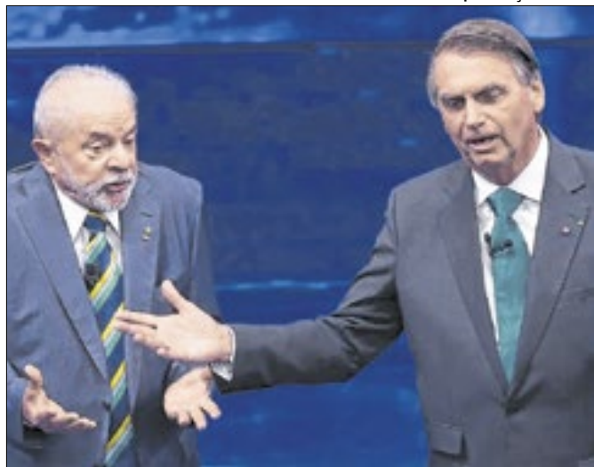
Lula e Bolsonaro travam o jogo para 2026