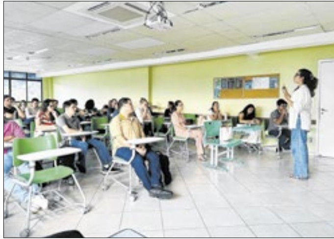
Objetivo principal preparar os profissionais para identificar e colher pacientes que estejam em sofrimento emocional