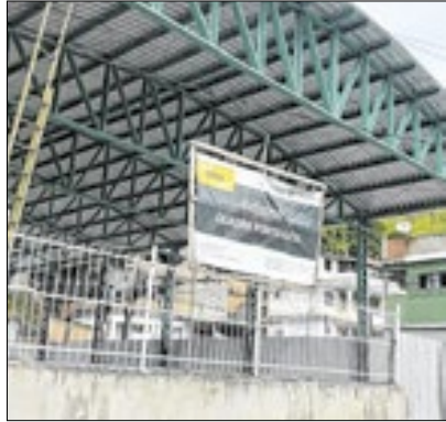
O projeto segue em expansão

A Prefeitura de Três Rios, por meio da Secretaria de Educação, Ciência e Tecnologia, está ampliando a infraestrutura escolar com a cobertura das quadras esportivas das unidades municipais de ensino. Uma das beneficiadas é a Escola Municipal Nossa Senhora Aparecida, localizada no bairro Ponto Azul, onde as obras estão em fase de finalização. O novo espaço permitirá a realização de aulas de educação física, atividades recreativas.