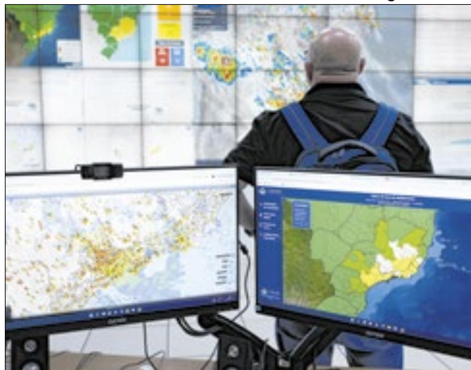
Alerta foi divulgado devido a possibilidade de chuva