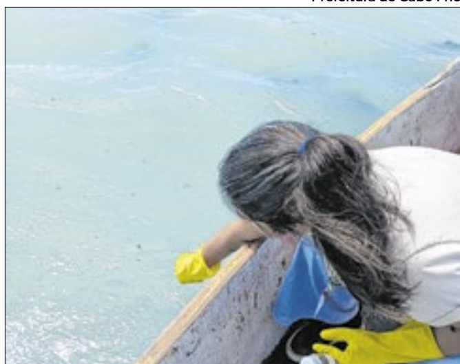
Coleta de análise para saber as impurezas