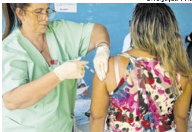
A campanha será voltada para os grupos prioritários