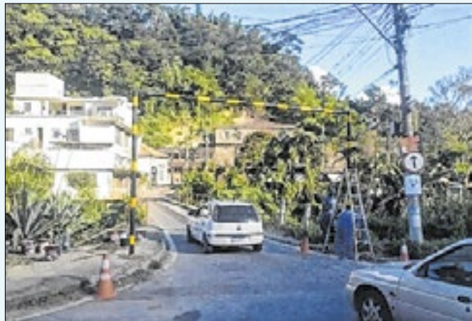
Limitadores foram instalados no local