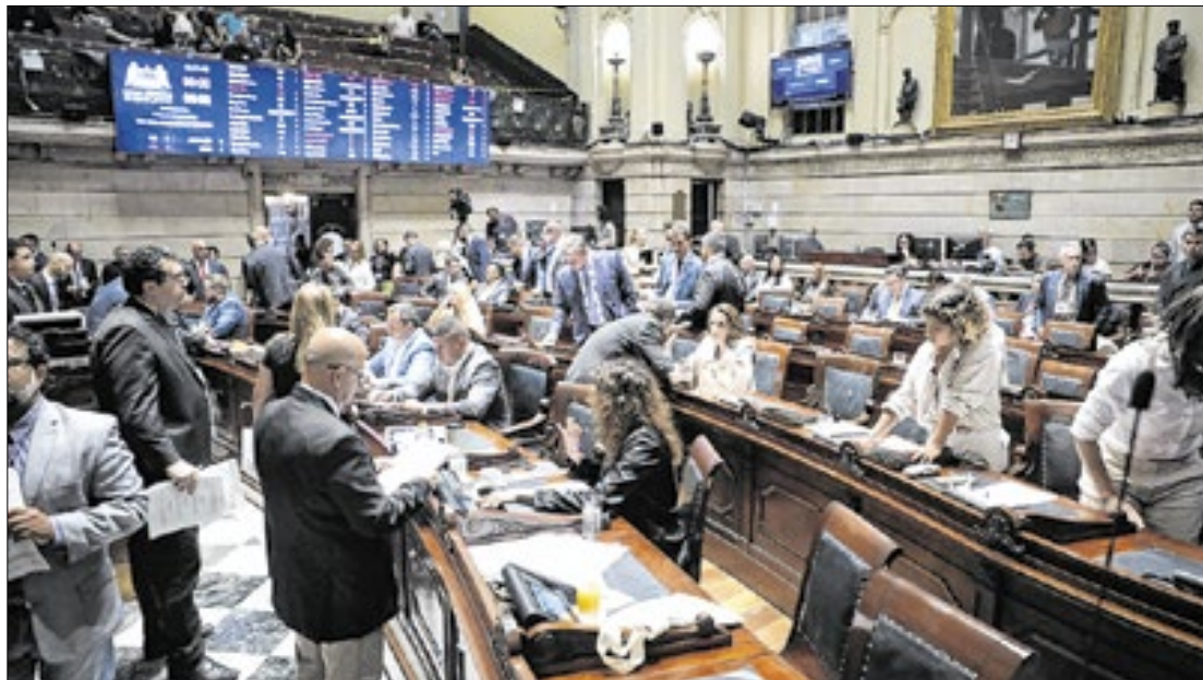
Em primeira discussão, Câmara aprova o uso de armas pela guarda municipal

"Diante da realidade da nossa cidade, pela primeira vez as ideologias foram deixadas de lado para se pensar na qualidade de vida do cidadão. Uma guarda armada é fundamental para garantirmos a segurança dos cariocas. Desde 2018 estamos tentando aprovar essa proposta. Por isso, esta Casa está de parabéns, dan-