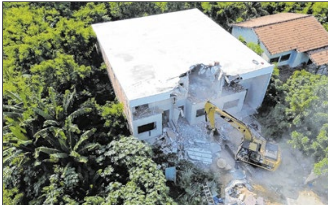
Demolições são um duro golpe à estrutura física do tráfico na Capital fluminense

Sem perder nada para uma edificação de classe média alta, todas as construções já se encontravam em fase de alvenaria, portanto, sem condições de habitabilidade, ainda. Todas as