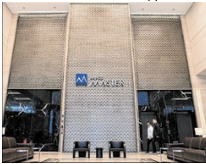
Instituição financeira começa a reduzir taxas de CDBs