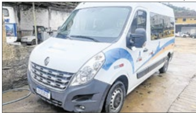
Ação se deu após a implementação de controle de gastos