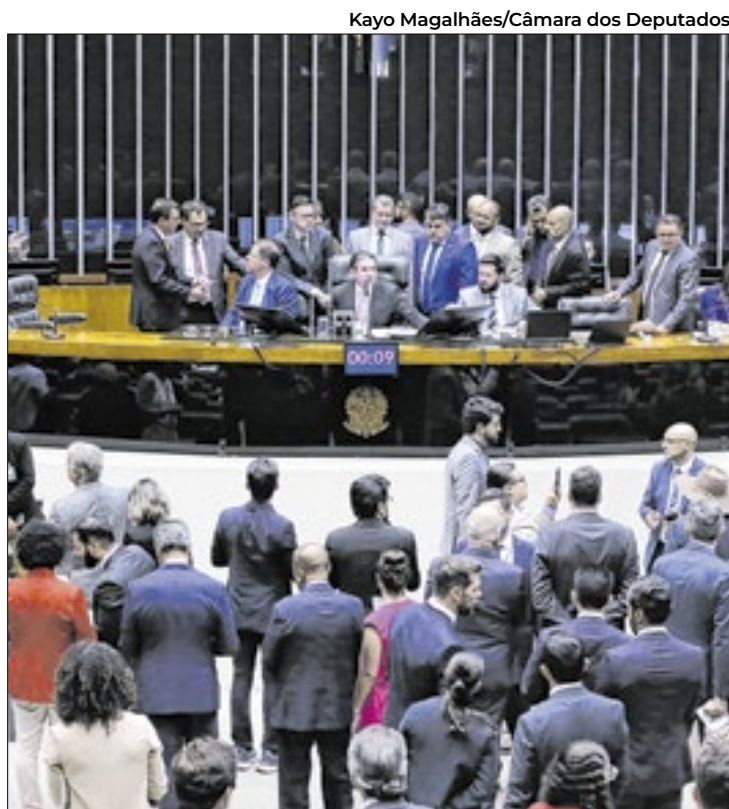
Unanimidade também na Câmara leva projeto à sanção

Mais cedo, a Casa havia aprovado o requerimento de urgência com 361 votos favoráveis, dez contrários e duas abstenções. A iniciativa surge como uma resposta à recente elevação de tarifas anunciada pelo presidente dos Estados