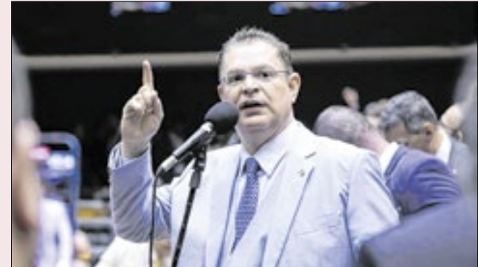
Sóstenes: caso de Ramagem beneficia ex-presidente