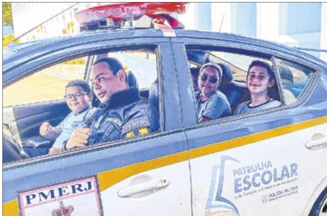
Os alunos puderam conhecer de perto as viaturas da corporação da Polícia Militar

Os alunos do quinto ano da Escola Municipal Jansen de Mello, em São João de Meriti, tiveram uma experiência única ao participarem do projeto Minha Escola Azul, realizado no 21º Batalhão da Polícia Militar. A iniciativa proporcionou um passeio produtivo, repleto de palestras, oficinas e interações com os agentes de segurança.