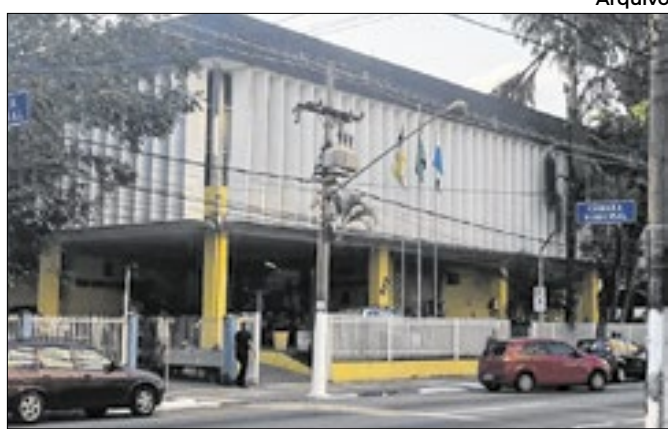
Vereador falou sobre suposta ameaça de agressão