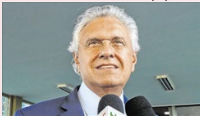
Uma federação União/PP apoiaria Ronaldo Caiado?