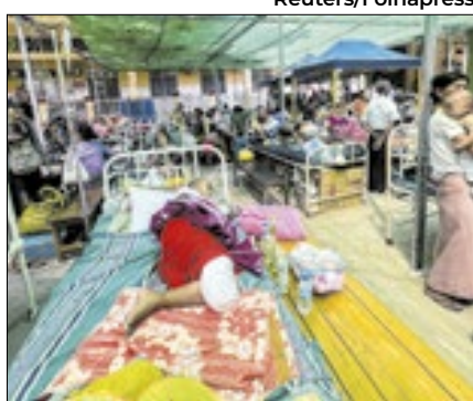
Situação em Mianmar é de calamidade

A junta militar que governa Mianmar anunciou, nesta quarta-feira (2), um cessar-fogo temporário na luta contra os grupos armados que ocupam regiões do país, para ajudar na recuperação após o terremoto de magnitude 7,7 que atingiu a nação do Sudeste Asiático na semana passada. Em comunicado, a junta disse que a trégua começa imediatamente e prosseguirá até 22 de abril, "com o objetivo de acelerar os esforços de ajuda e reconstrução e manter a paz e a estabilidade". Os militares tomaram o poder em Mianmar em fevereiro de 2021. Eles ale-