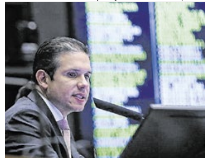
Presidente da Câmara tenta alternativa à anistia