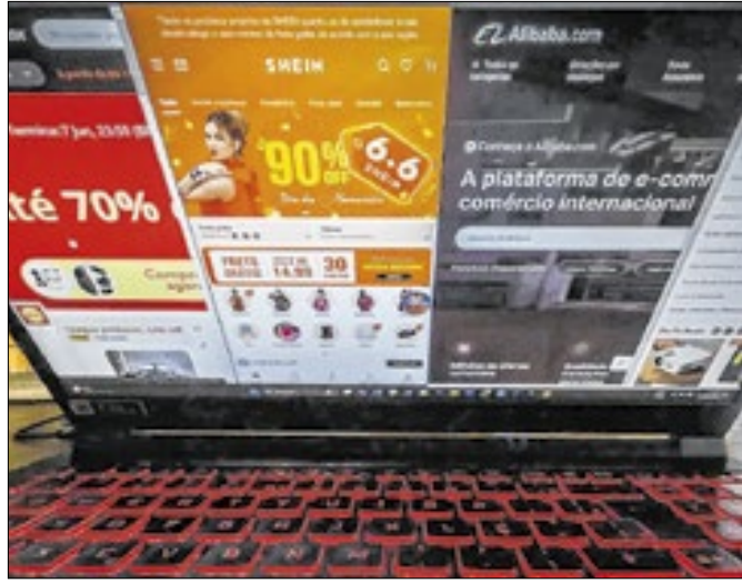
Comsefaz busca equidade com o produto interno