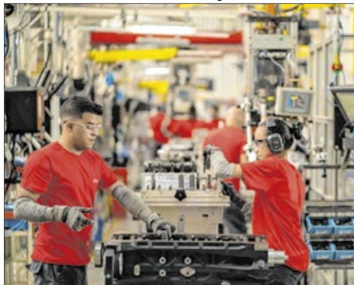
Cinco setores migraram para estado de falta de confiança

São eles: Equipamentos de informática, eletrônicos e ópticos; Máquinas e materiais elétricos; e Obras de infraestrutura. Dessa forma, o número de setores industriais confiantes caiu de dez em fevereiro, para