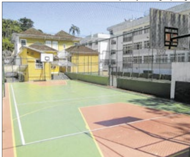
Sede do Colégio Ipiranga, na cidade de Petrópolis