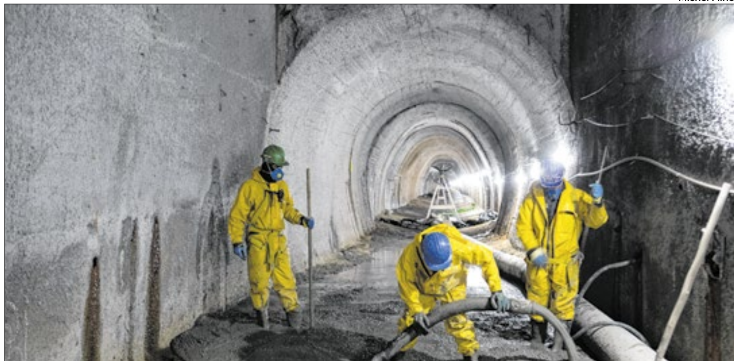
As obras no túnel, em Petrópolis, iniciadas após a tragédia do ano de 2022, tem finalização programada para 2025

anos, muitas delas usuárias do Sistema Único de Saúde (SUS). Já no início de cada turma, a profissional realiza uma anamnese para entender as condições socioeconômicas e de saúde dos participantes, ajustando as temáticas de acordo com as necessidades do grupo.