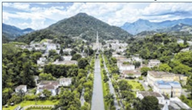
Título fio concedido pelo Governador Cláudio Castro