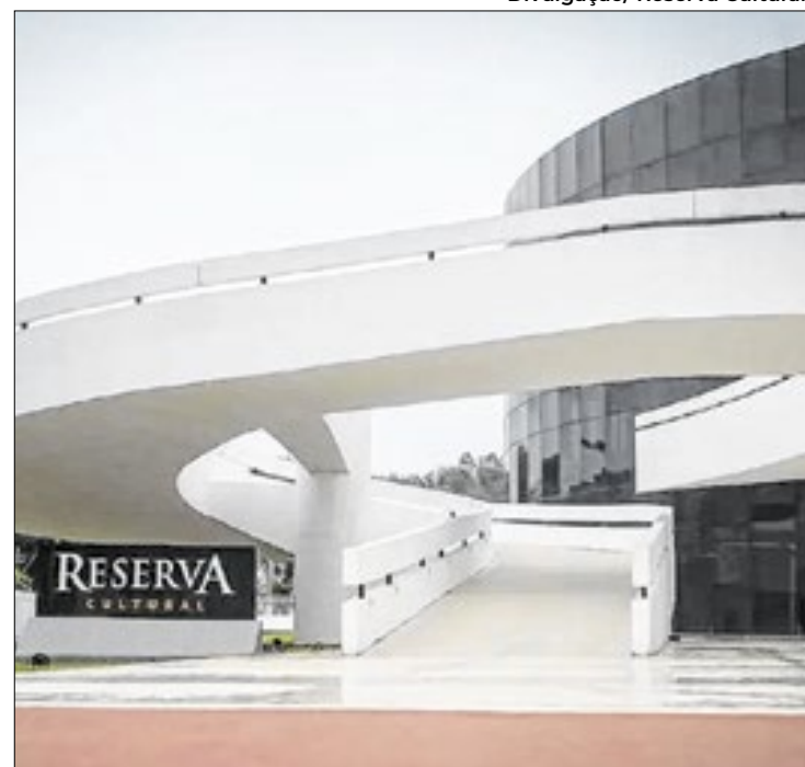
Niterói terá noite de gala com grandes astros internacionais