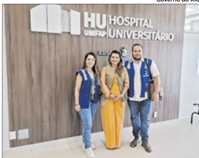
Equipe no hospital universitário do Amapá