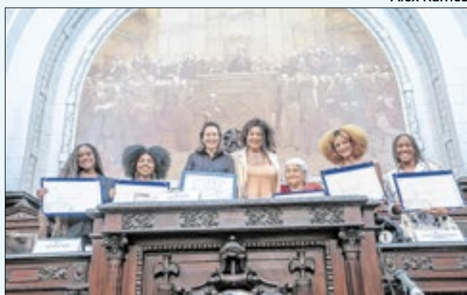
Algumas homenageadas no plenário do Tiradentes