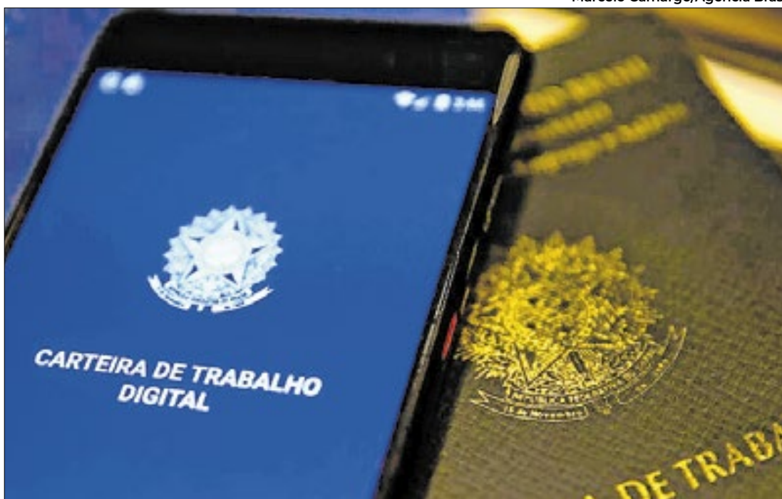
Maioria das oportunidades estão na região Metropolitana e na região Serrana

o texto, as clínicas serão instaladas em unidades de saúde estaduais para garantir um atendimento multidisciplinar nos tratamentos de reabilitação. O Governo do Estado poderá firmar parcerias com a União, prefeituras e empresas privadas para viabilizar a implementação da medida.