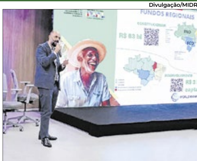
Evento é promovido pelo Banco Mundial