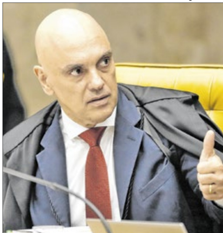
Moraes arquivou a ação sobre o certificado de vacina

Há um ano a Polícia Federal (PF) indiciou Jair Bolsonaro, Mauro Cid e outras 15 pessoas por participarem de um esque-