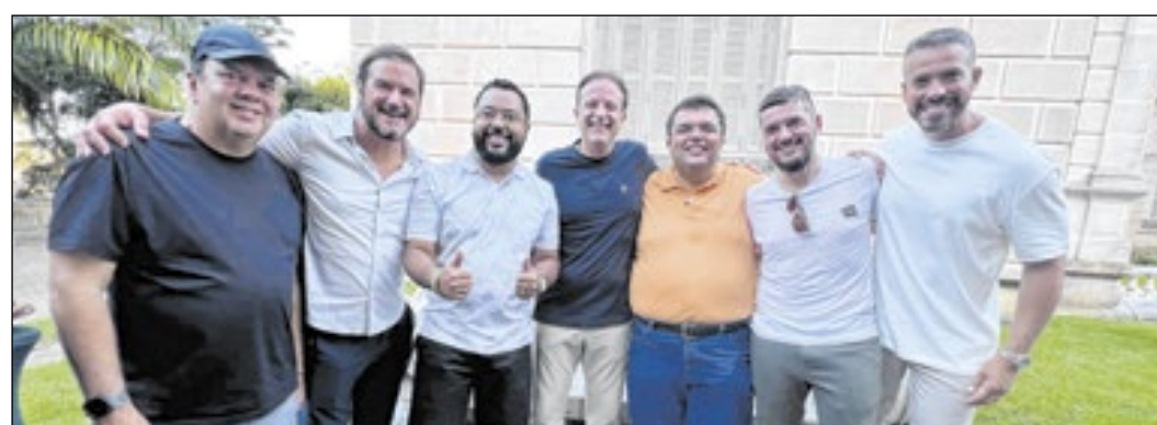
Na seq.: o deputado federal Elmar Nascimento; Antonio Rueda, presidente do União Brasil; o cantor Dudu Nobre; o secretário André Moura; o deputado Chico Machado; o presidente da Alerj, Rodrigo Bacellar; e o deputado estadual Rodrigo Amorim