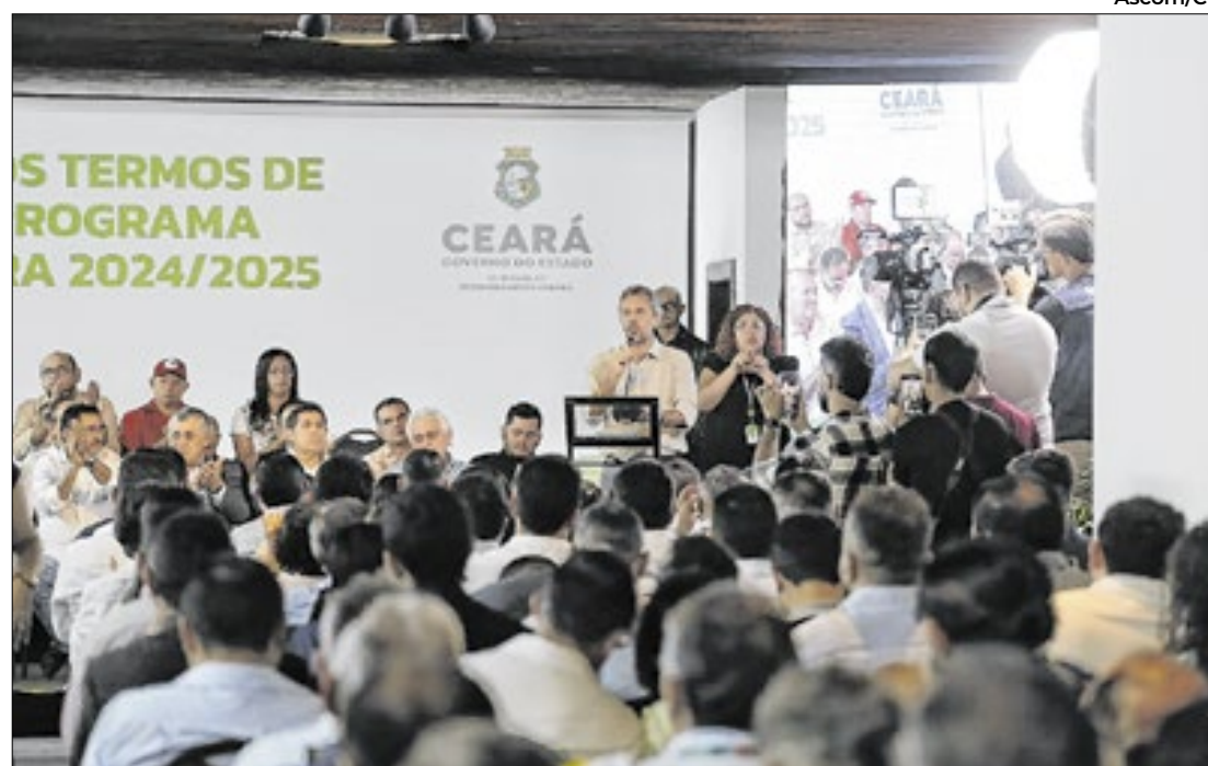
A iniciativa acontece em parceria com o governo federal

Investimento total para o programa é de R$ 144 milhões