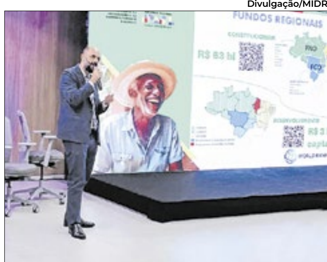
Evento é promovido pelo Banco Mundial