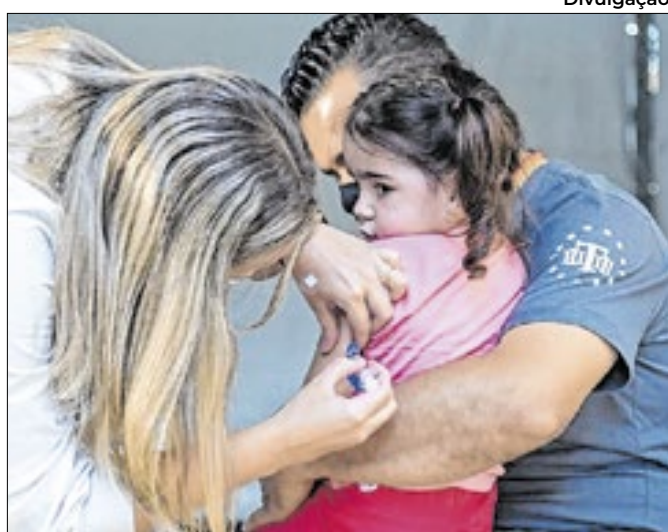
Campanhas e criação do IGM ajudaram no aumento