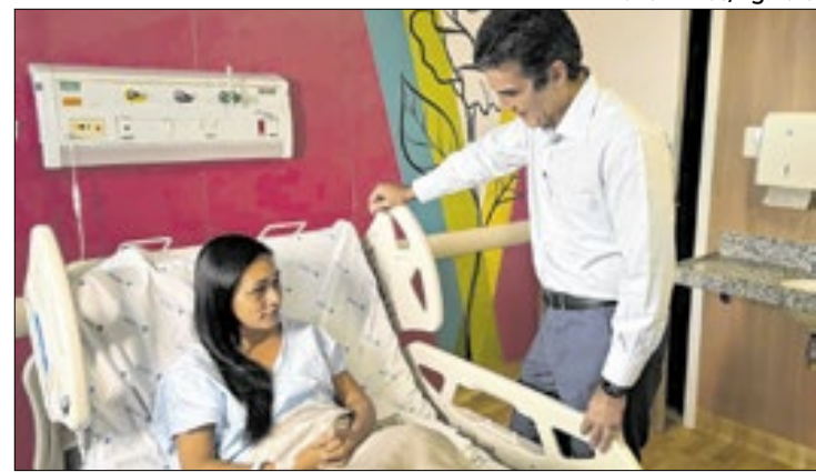
Unidade fez mais de 500 exames de imagem em 17 dias