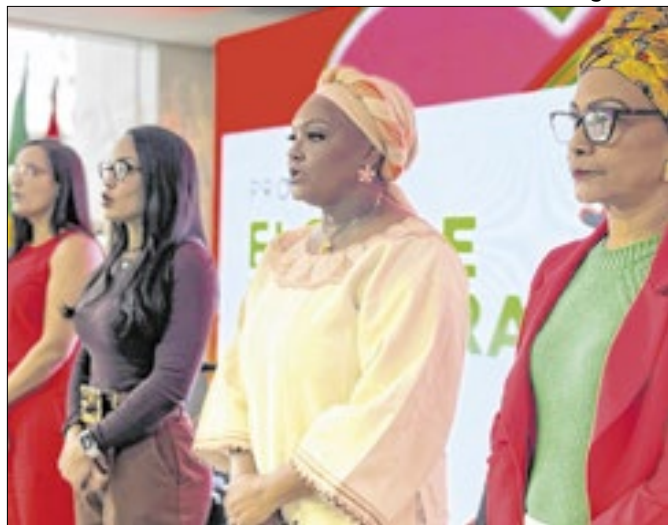
Ação busca diminuir mortalidade materna entre negras