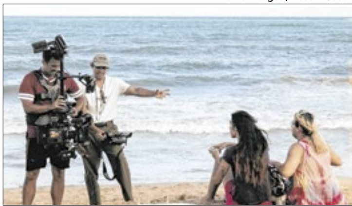
Documentário Alice conta a trajetória de multiartista trans