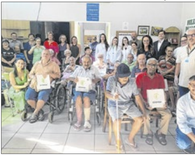
Fundo Estadual do Idoso garantiu aparelhos