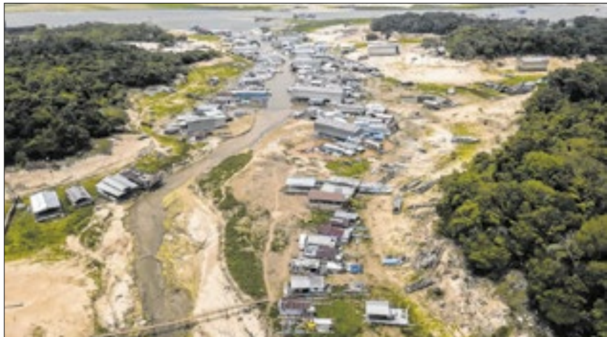
O déficit de precipitações chegou a 200 ml em algumas regiões