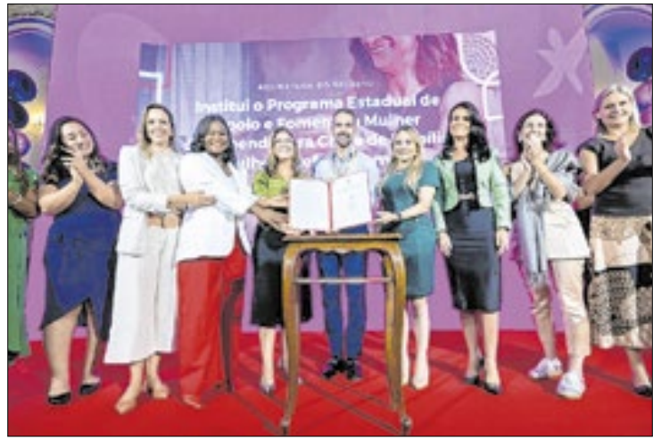
Decretos beneficiam mulheres chefes de família

O governador Eduardo Leite assinou, nesta quinta-feira (27/3), no Palácio Piratini, dois decretos de incentivo ao empreendedorismo feminino. Um deles lançou o Programa Mulher Empreendedora Chefe de Família, ao passo que o outro regulamentou o programa Avança Mulher Empreendedora. O evento faz parte das atividades promovidas pelo Estado ao longo de março, mês em que se comemora o Dia Internacional da Mulher.