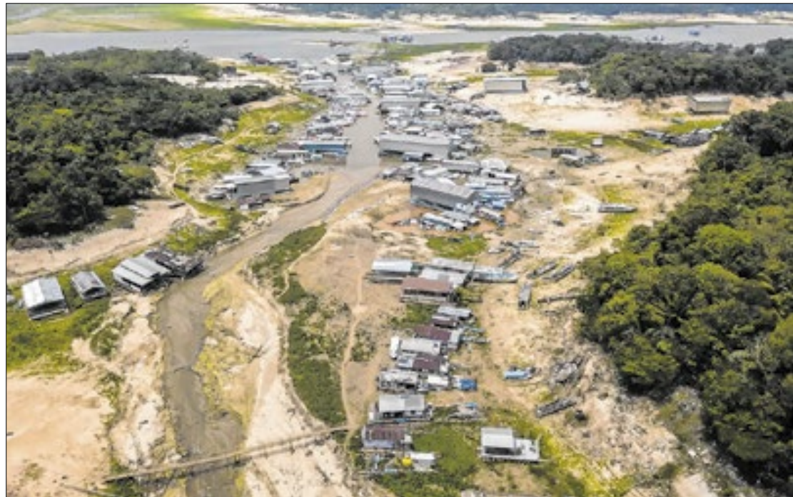
Entre dezembro e fevereiro, o déficit de precipitações chegou a 200 ml em algumas regiões

O verão no Brasil terminou em 20 de março com chuvas irregulares em diversas regiões do país. Apesar dos altos volumes registrados em partes da Região Norte, como o Amazonas e o sudoeste do Pará, a quantidade de precipitação não foi suficiente para recompor os estoques de água no solo.