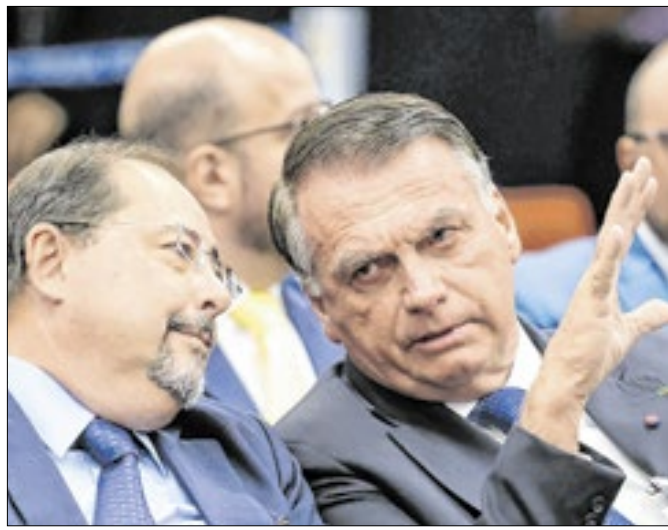
Vilardi e Bolsonaro: estratégias diferentes