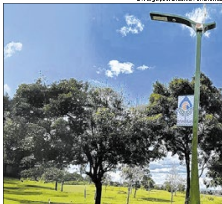
Postes oferecem várias informações e serviços

Ibram, Roney Nemer, comemora. “Teremos dados mais precisos para poder melhorar o planejamento da unidade com o diagnóstico que será dado no plano de manejo, o que nos levará a fazer um melhor zoneamento da área, com mais garantia dos dados que fundamentarão essas decisões”, afirma.