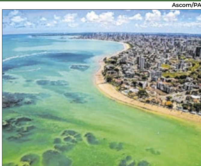
A programação inclui uma capacitação exclusiva