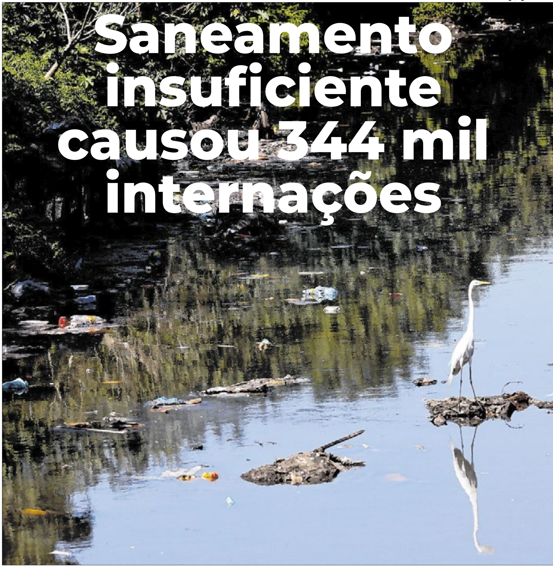
Dejetos são jogados em rios, que acabam poluídos e impróprios para o consumo da água