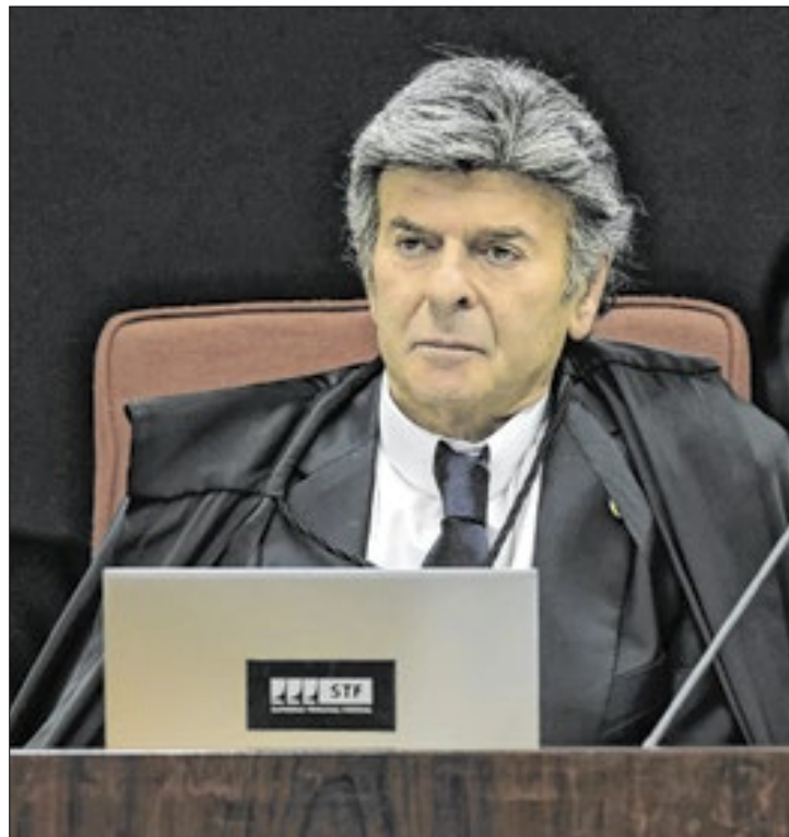
Fux apresentou divergências a pontos da denúncia

que pichar com batom a estátua "A Justiça", em frente ao STF. Ela pode pegar 14 anos de prisão, mas o ministro pediu vista do caso, suspendendo temporariamente o julgamento.