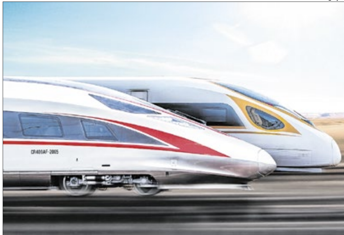
Trem-bala ligará as capitais Rio e São Paulo e terá parada em Volta Redonda (RJ)