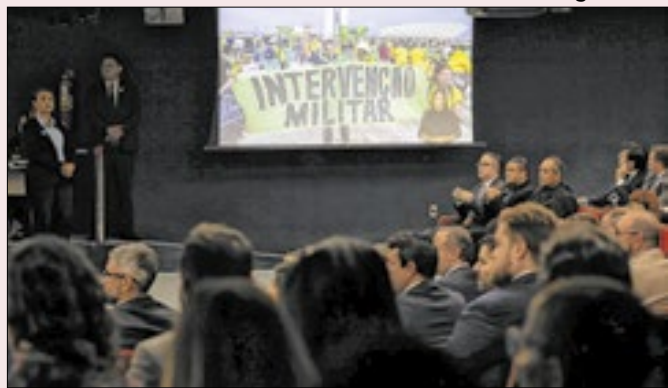
Vídeo apresentado por Moraes no julgamento