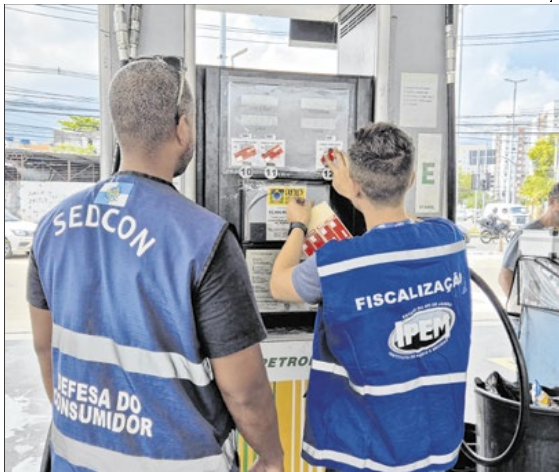
Diantes das irregularidades, dois postos foram interditados pelos agentes