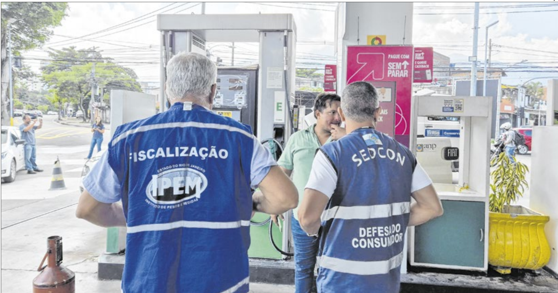
Irregularidades e crimes afetam tanto os consumidores quanto a segurança ambiental no estado do Rio de Janeiro