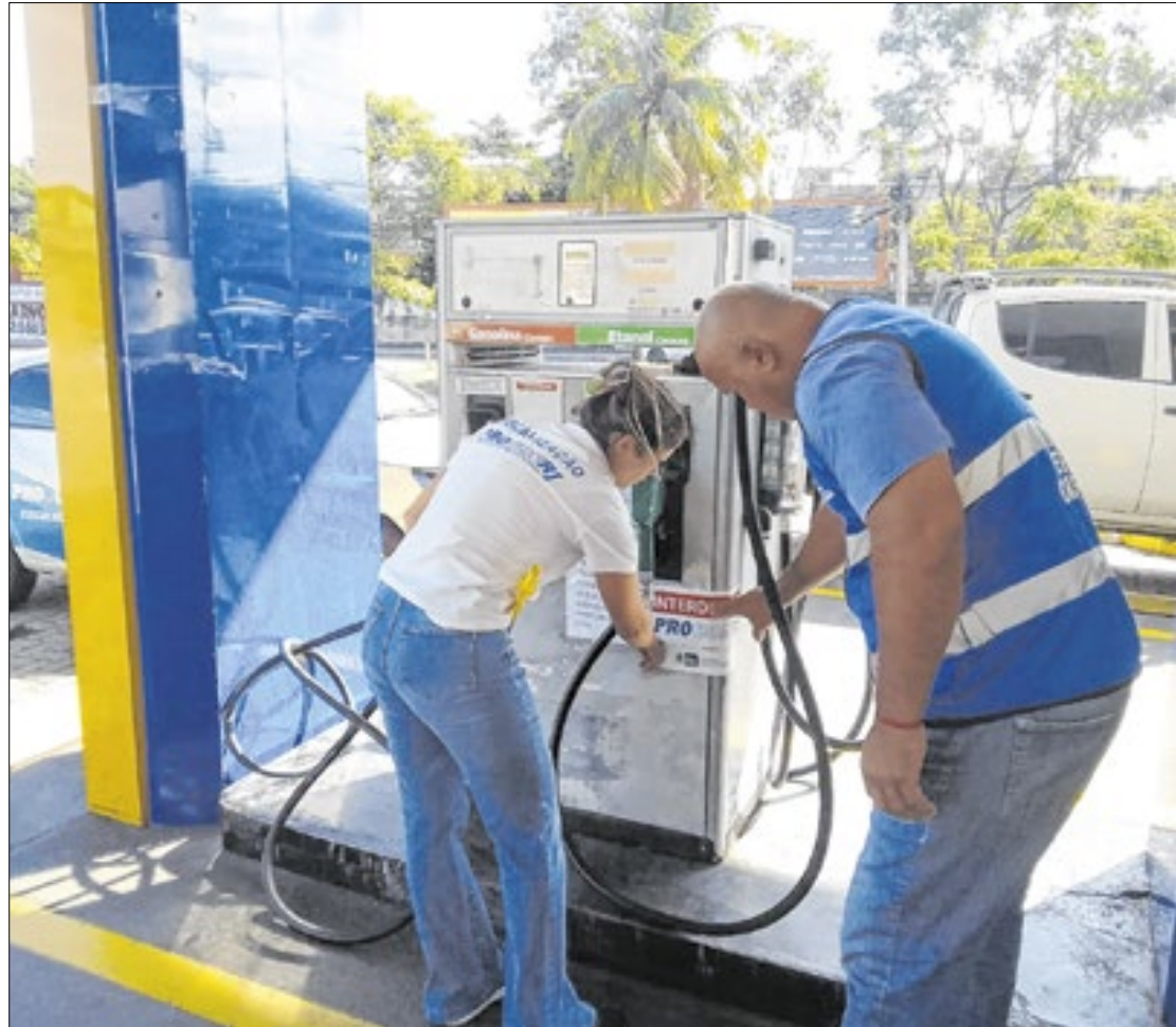
Qualidade do combustível foi motivo de interdição de tanques e bicos de abastecimento