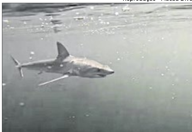
Motivo da aparição de predador ainda não foi esclarecido