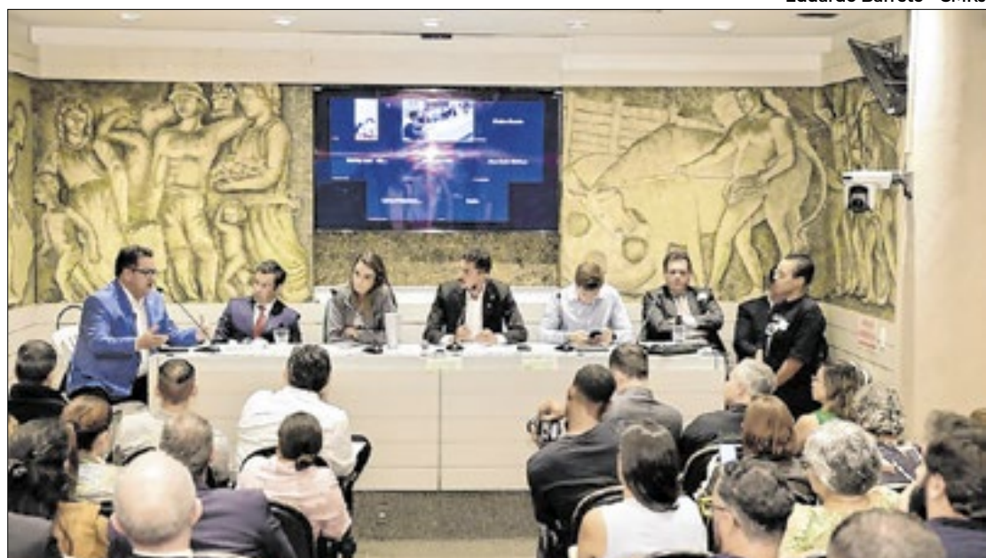
Regulamentação de plataformas de aluguéis de temporada está na pauta de discussões

"É preciso trazer a questão da justiça tributária. Os impostos pagos pelas plataformas precisam ficar na cidade do Rio para que o fomento ao setor de turismo seja ainda maior", disse o parlamentar, que destacou ainda que as sedes destas plataformas se concentram na ci-