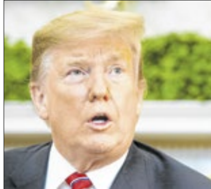
Mais ataques ao Judiciário

O presidente dos Estados Unidos, Donald Trump, ampliou os ataques ao Judiciário do país, transformando o embate com juízes em uma das marcas do começo do seu segundo mandato.