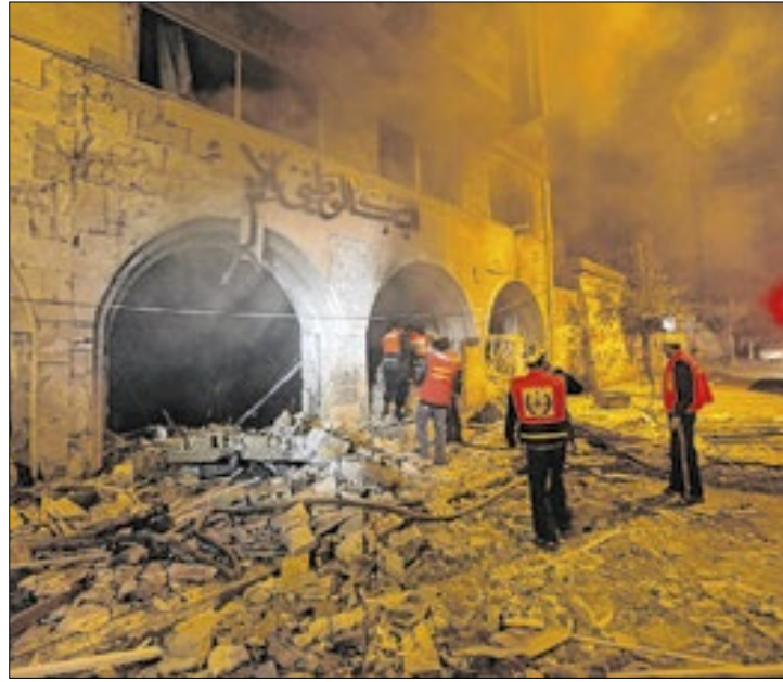
Ao menos 30 palestinos morreram em ataques israelenses

Menos de uma semana após Israel romper o acordo de cessar-fogo e retomar os bombardeios na Faixa de Gaza, o Ha-