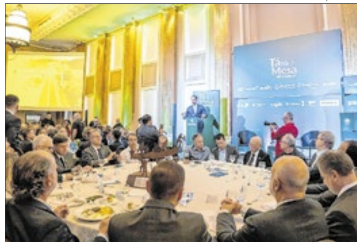
Leite abordou estratégias para impulsionar crescimento

O Rio Grande do Sul alcançou em 2024 o maior índice de investimentos públicos dos últimos 25 anos, aplicando 10,7% da receita corrente líquida em obras e projetos