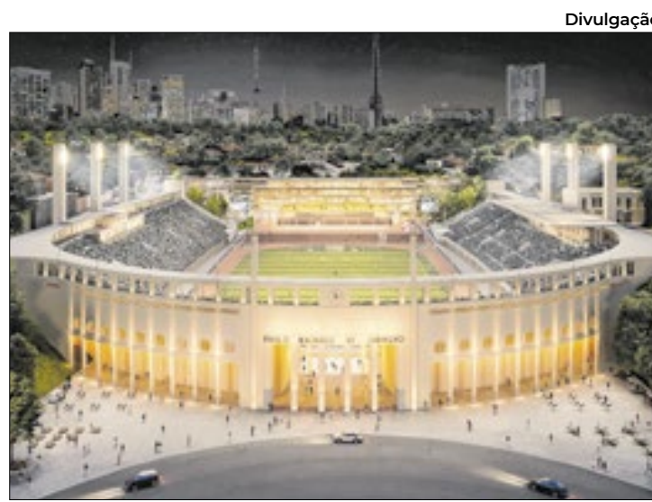
Pacaembu recebeu autorização temporária da prefeitura

Por ora, basta levar roupas de banho, toalha, óculos e touca para acessar a piscina. Também é permitido utilizar pranchas, flutuadores, pés de pato e nadadeiras. Documentos de identi-