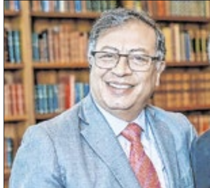
Gustavo Petro sofreu nova derrota

Em nova derrota para um presidente politicamente enfraquecido, senadores da Colômbia rejeitaram a proposta de uma reforma trabalhista defendida com unhas e dentes por Gustavo Petro. O projeto, que segundo o governo visa melhorar as condições dos trabalhadores e expandir proteções, foi barrado depois que 8 dos 14 senadores de um comitê estabelecido para analisar o tema votaram para arquivá-lo.