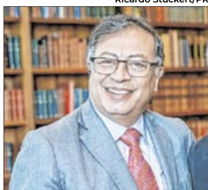
Gustavo Petro sofreu nova derrota

Em nova derrota para um presidente politicamente enfraquecido, senadores da Colômbia rejeitaram a proposta de uma reforma trabalhista defendida com unhas e dentes por Gustavo Petro. O projeto, que segundo o governo visa melhorar as condições dos trabalhadores e expandir proteções, foi barrado depois que 8 dos 14 senadores de um comitê estabelecido para analisar o tema votaram para arquivá-lo.