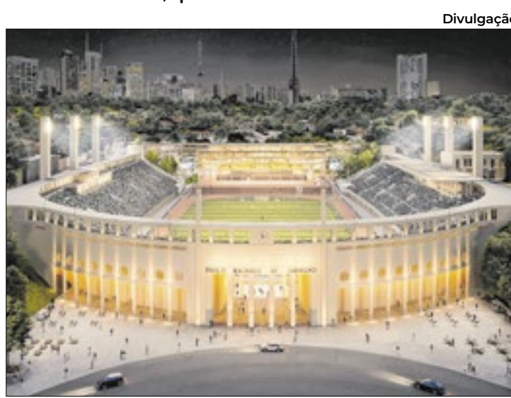
Pacaembu recebeu autorização temporária da prefeitura

Por ora, basta levar roupas de banho, toalha, óculos e touca para acessar a piscina. Também é permitido utilizar pranchas, flutuadores, pés de pato e nadadeiras. Documentos de identi-