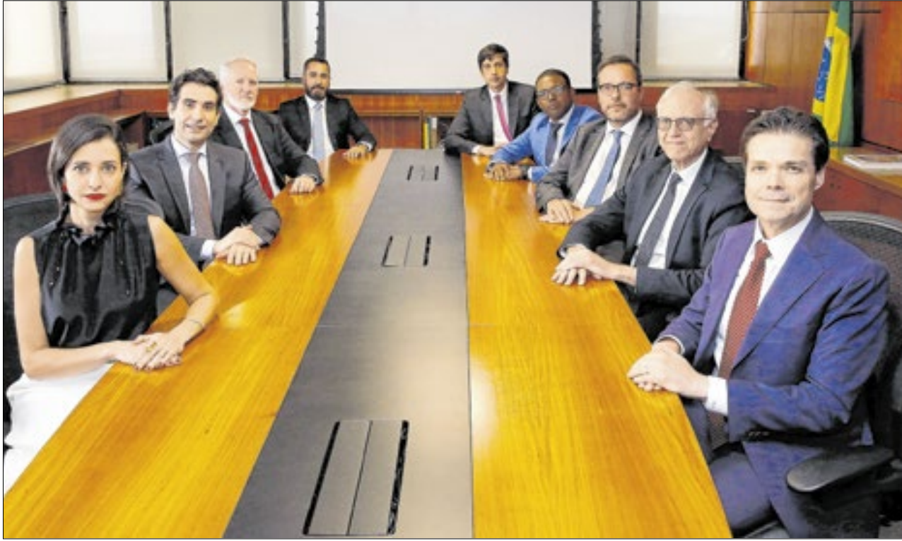
Diretores do Banco Central com o presidente Gabriel Galípolo na reunião do Comitê de Política Monetária

Para justificar a nova alta da Selic, o comitê - que busca a convergência da inflação à meta - atribuiu fatores, como a "desancoragem das expectativas de inflação, projeções de inflação elevadas, resiliência na atividade econômica e pressões do mercado de trabalho.