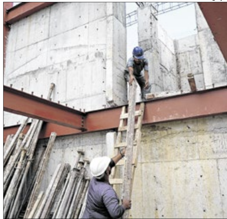
Espaço terá capacidade para atender até 140 idosos

A estrutura metálica do prédio do futuro Centro Integrado de Atendimento à Pessoa Idosa (Ciapi) Dona Munira Arbex Francisco, que está em construção no bairro Roma, começou a ser erguida. Segundo a Secretaria Municipal de Obras (SMO), responsável pela fiscalização da construção, 10% dessa etapa já foram concluídos, e o material está sendo fornecido pela mesma empresa envolvida na ampliação do Hospital São João Batista (HSJB).