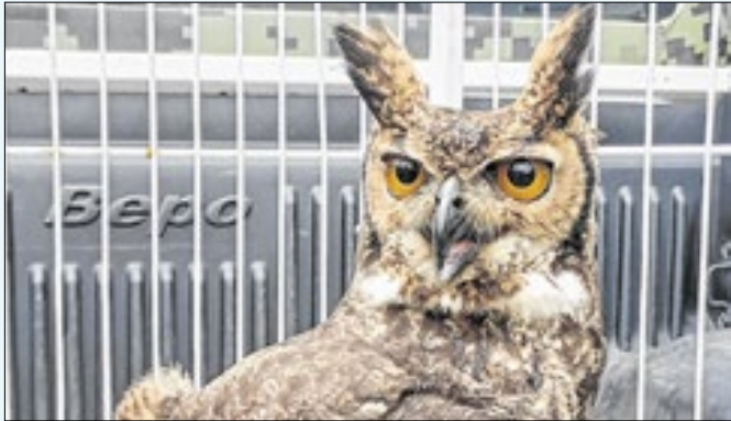
Ave foi conduzida ao Zoológico de Volta Redonda