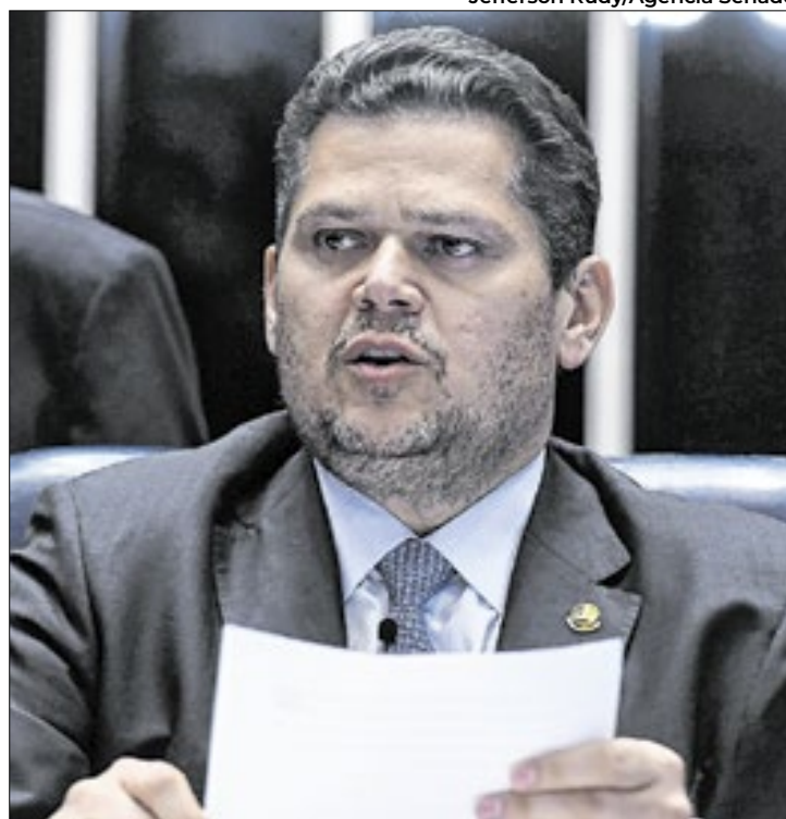
Alcolumbre é favorável à mudança na Lei da Ficha Limpa

O texto propõe, ainda, um limite máximo de 12 anos de inelegibilidade para casos de condenações posteriores que impliquem inelegibilidade adicional. Para o relator, senador Wéverton Rocha (PDT-MA), a matéria busca corrigir uma desigualdade, considerando que, para senadores, os anos de inelegibilidade são ainda maiores, já que seus mandatos são de oito anos. "Principalmente, a alteração pertinente ao prazo de duração da inelegibilidade,