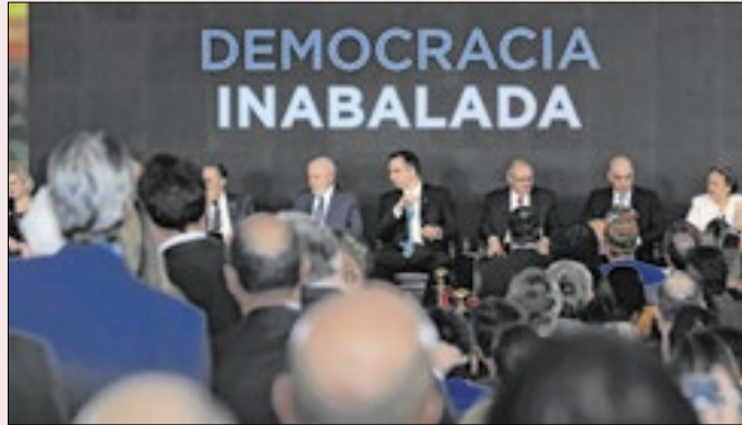
Democracia resistiu a uma tentativa de golpe