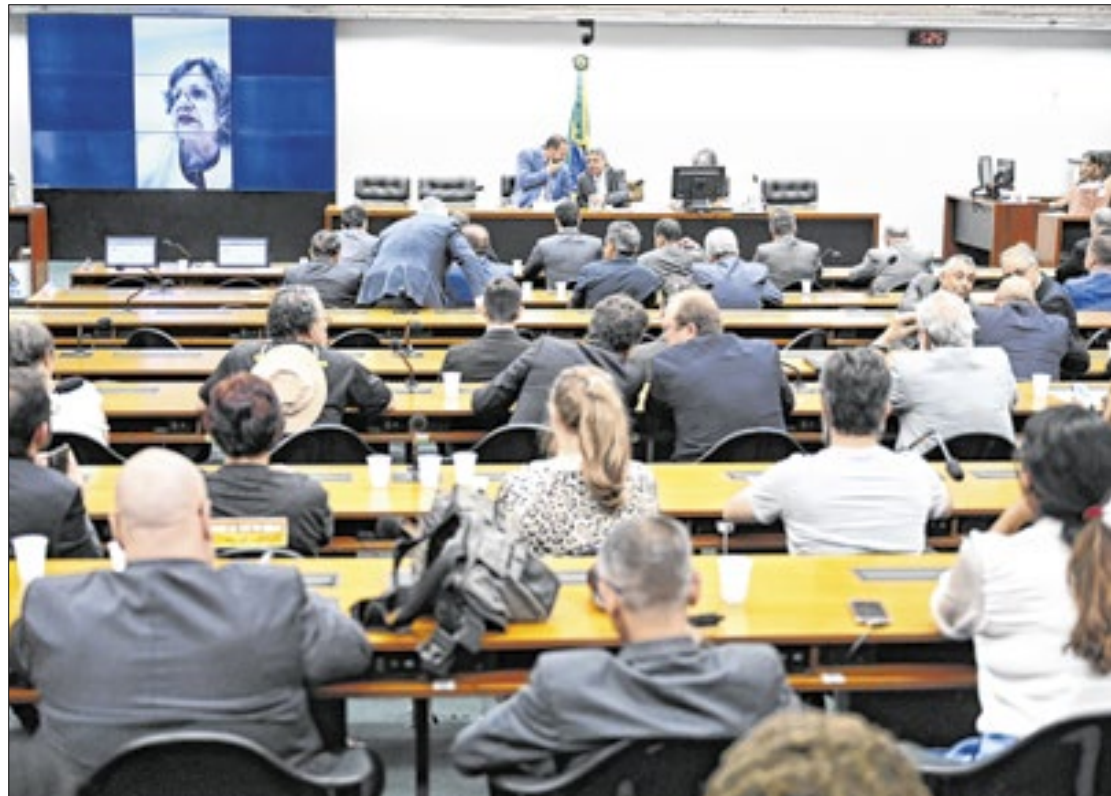
Ainda há dúvidas sobre se orçamento será votado na CMO

Além disso, na segunda-feira (17), o Pso protocolou no Supremo Tribunal Federal (STF) uma nova Ação Direta de Inconstitucionalidade (ADI), ainda por conta do problema com as emendas parlamentares. O partido con-