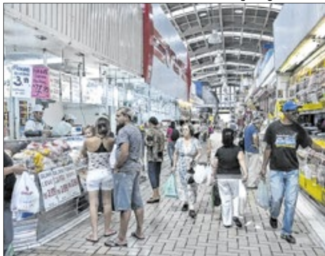
Incerteza compromete intenção de consumo familiar