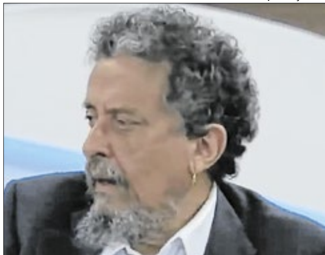
Santana conseguiu conter Lula na crise do Mensalão