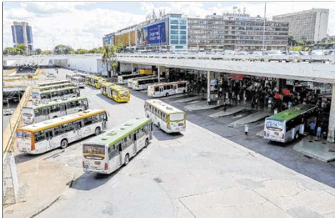
Rodoviária está em processo de privatização

Segundo a Pasta, ambulantes não autorizados ou não licenciados ficam sujeitos a notificações, multas e perda de sua mercadoria.