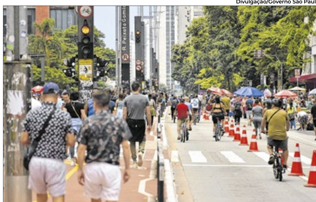
Consumidores são informados sobre ranking de empresas com maiores problemas

Procon-SP divulga cadastro com queixas registradas em 2024