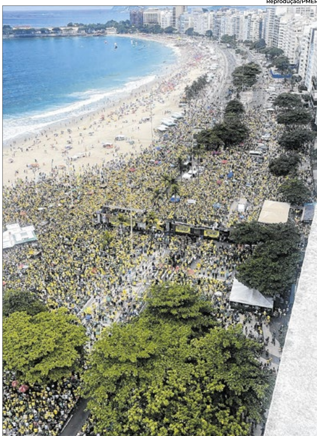
Segundo a PMERJ, cerca de 400 mil pessoas estiveram em Copacabana

“Estou assumindo aqui o compromisso com todos vocês de que nesta semana, quinta-feira [20], na reunião do colégio de líderes, nós vamos dar entrada com a minha assinatura e dos 92 deputados do PL e de vários outros partidos que eles vão ficar surpresos, para que nós possamos pedir a urgência do PL da Anistia para entrar na pauta na semana que vem”, afirmou o parlamentar.