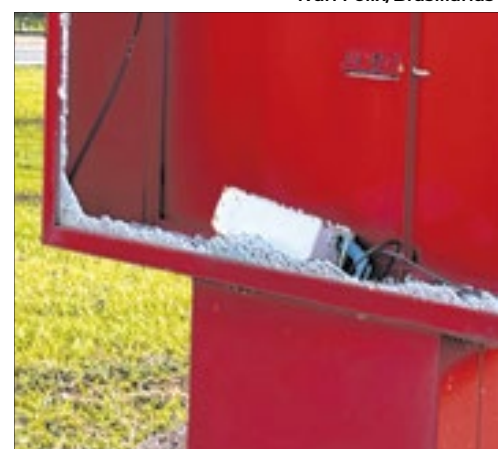
Na avenida L4 Sul, na sexta-feira (dia 14), havia pelo menos dois tótems de LED destruídos a pedradas. Vandalismo?

No caso, esses dois que foram flagrados estava "ocós"... A parte eletrônica dos tótems (os painéis de LED e a parte eletrônica que faz a ligação) não estavam lá. Apenas mui-