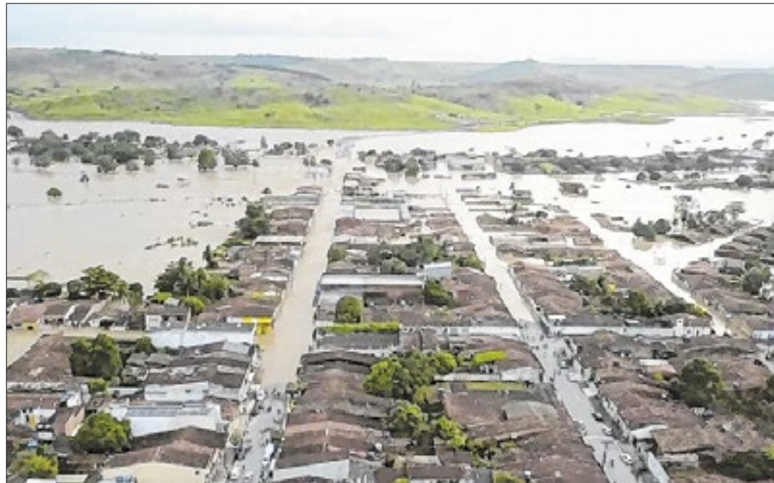
A iniciativa é coordenada pela Defesa Civil Nacional

Encontro reuniu órgãos para ações de mitigação e respostas