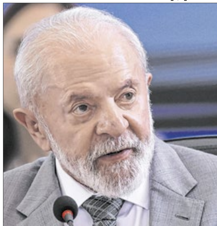
Pesquisan Ipec reforça queda na popularidade de Lula

Os dados também mostraram que a maneira como Lula está governando o Brasil é desaprovada por mais da metade dos brasileiros (55%), representando um crescimento de 9 pontos percentuais em relação aos 46% registrados em dezembro. A aprovação, por sua vez, diminuiu 7 pontos percentuais, indo de 47% em dezembro para