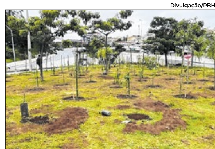
Minifloresta será legado do Carnaval 2025 na capital mineira