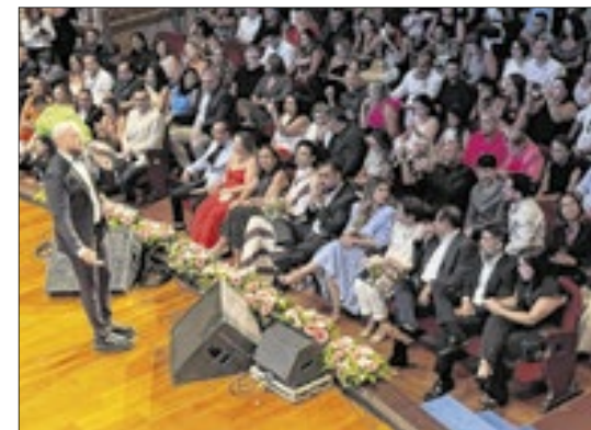
Belo cantou para um público de 1,8 mil pessoas que prestigiaram o evento