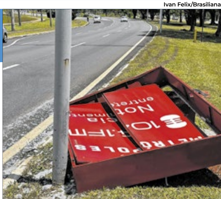
Painel (irregular) de LED do Metrôpoles destruído por uma colisão com veículo na Estrada Parque Dom Bosco

Diz o artigo 27 da Lei Distrital 3.035, de 2002, que (ainda) rege os padrões (que são considerados solenemente) para a instalação de publicidade em vias públicas: "Nas faixas de domínio das rodovias Estrada Parque Dom Bosco - EPDB, Estrada Parque Península Norte - EPPN