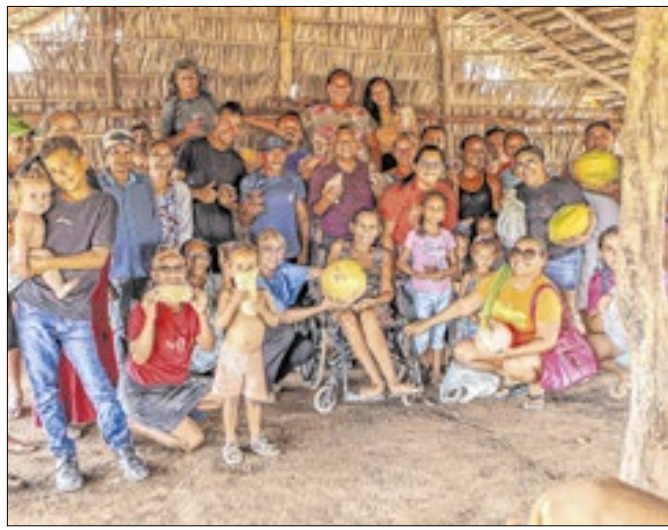
Foram investidos R$ 61 mil para atender 20 famílias