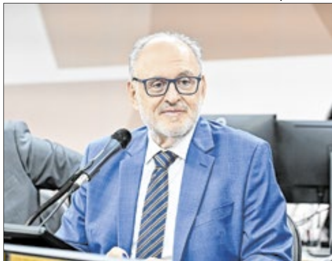
Reconhecimento de contribuições acadêmicas e jurídicas