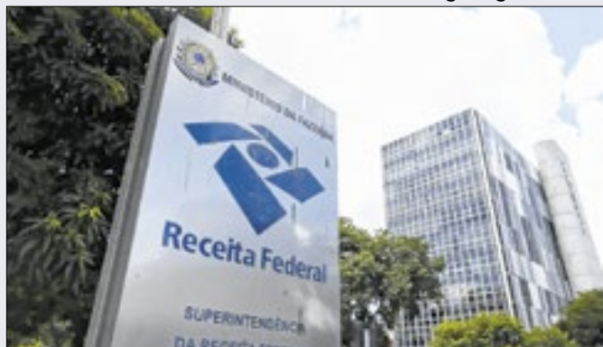
Tabela do IR corrigida alcançaria 30 mi de contribuintes