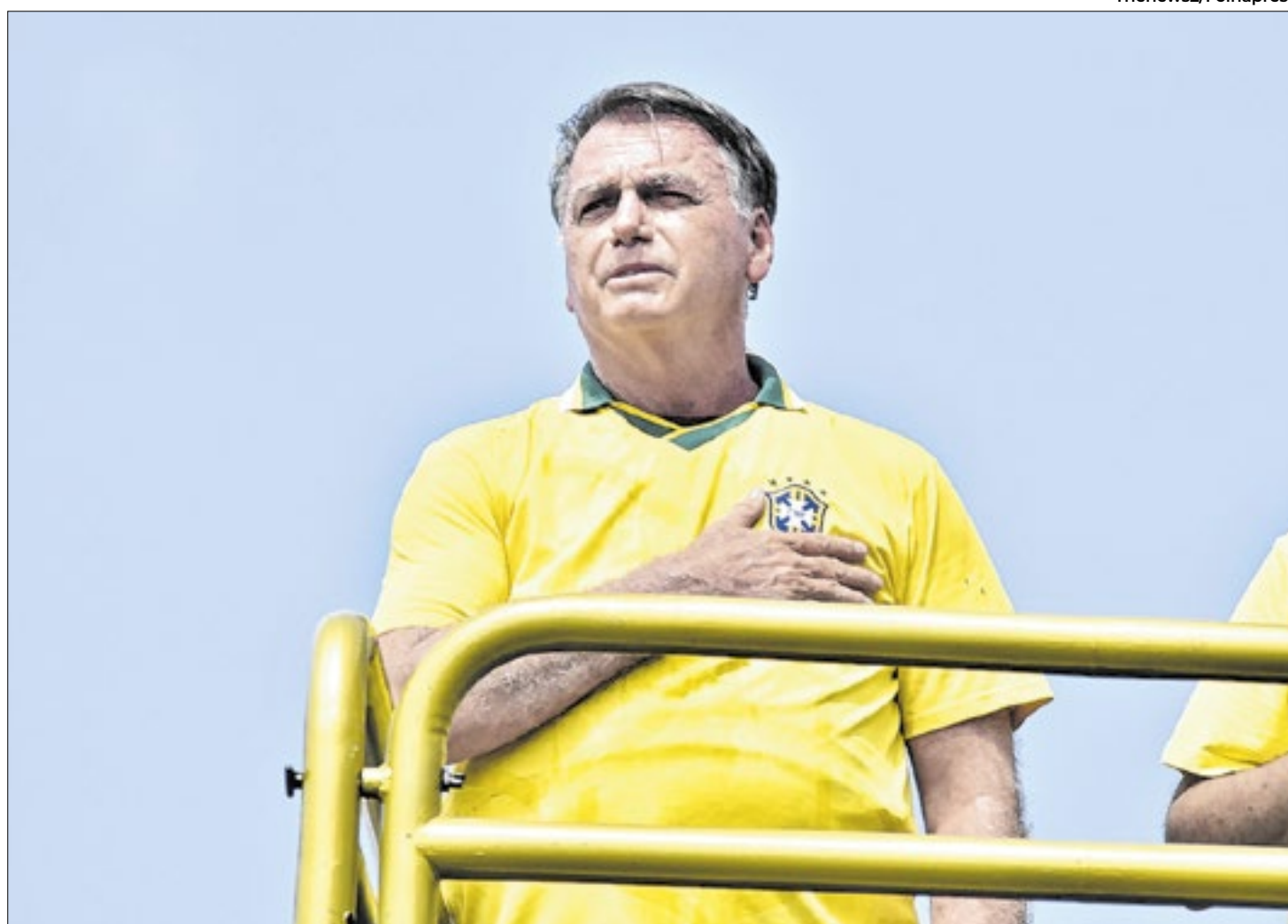
Copacabana, no Rio de Janeiro, foi palco do ato convocado pelo ex-presidente da República Jair Bolsonaro (PL) neste domingo (16)

A expectativa é que a Câmara discuta o tema já nesta semana, visto que, durante seu discurso no ato, o líder do partido na Câmara dos Deputados, deputado Sóstenes Cavalcante (PL-RJ), declarou que entrará com pedido pela urgência do projeto de lei que propõe anistiar os envolvidos de 8 de janeiro.