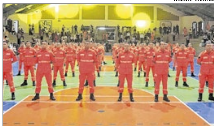
Novos soldados passam a reforçar o efetivo