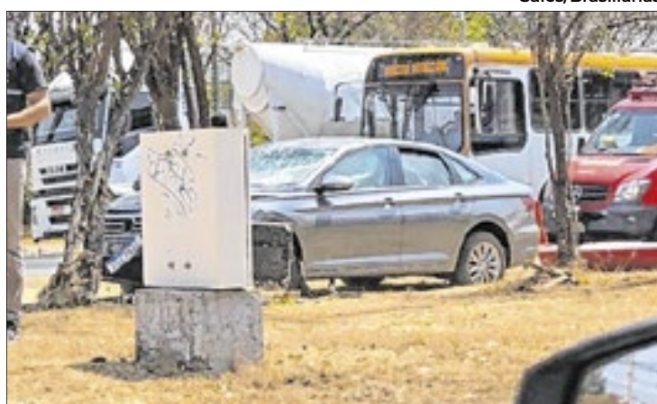
Em setembro passado, um veículo atropelou o painel de led (que ficou atrás do carro) e só parou após acertar uma árvore, na EPBB

O que chamou a atenção naquele acidente de setembro de 2024 é que o fato foi noticiado, no mesmo dia, por algumas emissoras de TV e totalmente ignorado pelo site "Metrôpoles" - que, curiosamente, tem como pauta e rotina justamente noticiar acidentes de trânsito pela cidade. Para o site de notícias, este acidente nunca aconteceu... nem ele, nem qual-