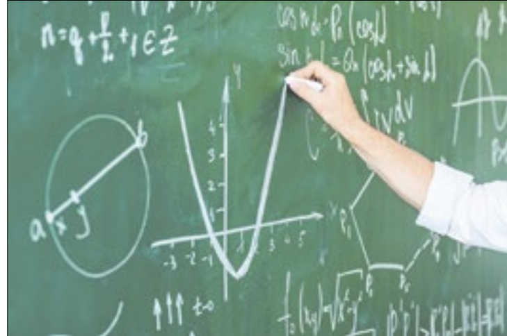
Podem participar docentes do Ensino Médio de todo o país

A OPMBr surgiu de uma conversa de uma turma de veteranos de engenharia do Instituto de Tecnologia Aeronáutica (ITA). A turma 89 discutia maneiras de melhorar os níveis de conhecimento básico em matemática no país, que participa da elite mundial na disciplina (Grupo 5 da Internacional Mathematical Union – IMU) mas tem resultados ruins em exames que se destinam à maior parte da população.