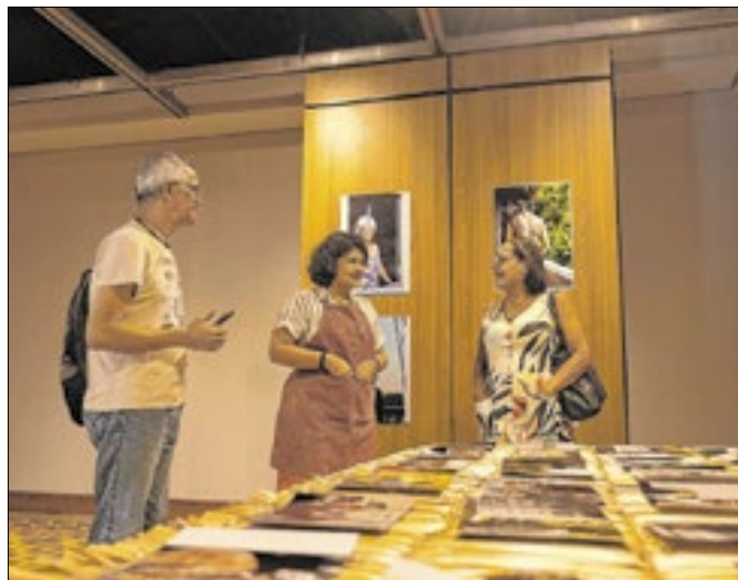
Mostra estabelece conexões entre Nordeste e Amazônia