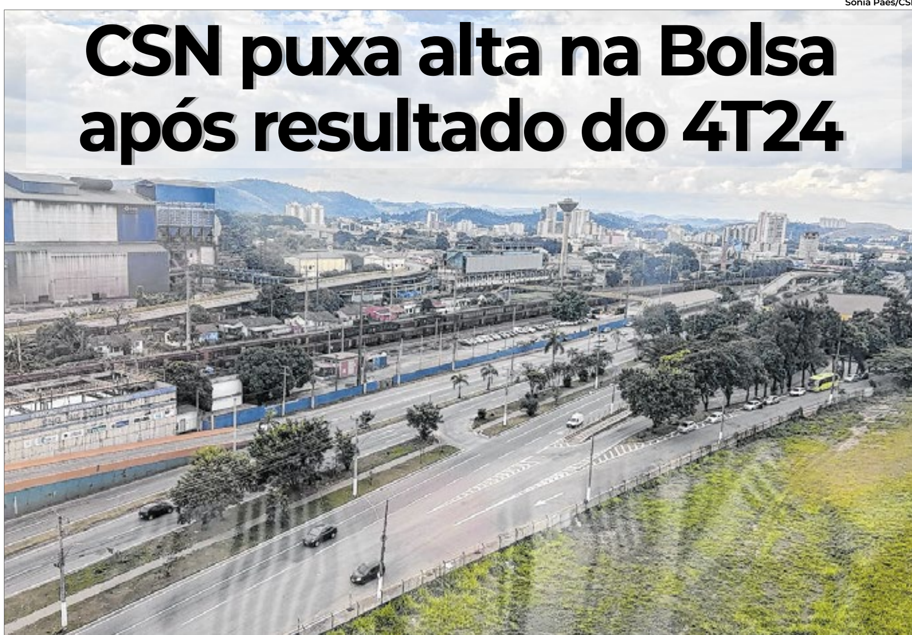
CSN divulga resultado e surpreende mercado financeiro, principalmente com a mineradora de Casa de Pedra, em Minas Gerais

Para o JPMorgan, o resultado positivo do Grupo CSN foi impulsionado pelo forte desempenho das principais unidades de negócios, principalmente Siderurgia, Mineração e Cimento. A CSN atua em toda a cadeia produtiva do aço, desde a extração do minério de ferro até a produção e comercialização de uma diversificada linha de produtos siderúrgicos. Na Bolsa de Valores, a empresa está listada como CSA3 (Siderúrgica) e CMIN3 (CSN Mineração).