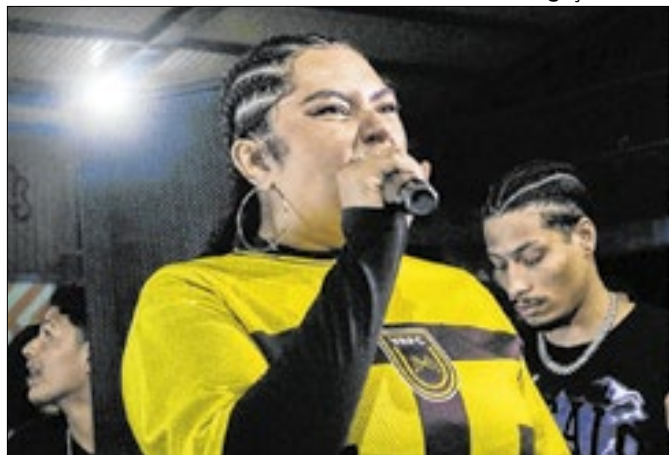
Batalha da Aposta contará com MCs em evento gratuito