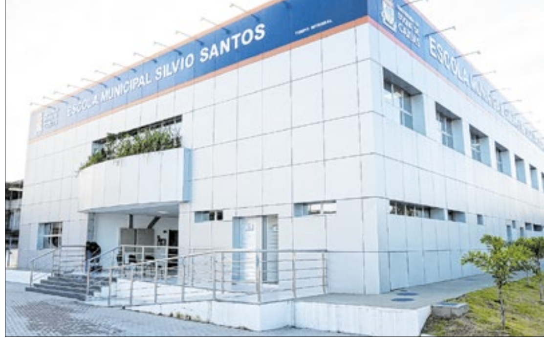
Prefeitura de Duque de Caxias

O município conta com 195 escolas e atende mais de 75 mil alunos, o que reforça a relevância e a responsabilidade inerente à função do professor. Em função da construção de escolas bilíngues no município, houve um aumento significativo na demanda por professores de Língua Inglesa. Segundo o edital de 2015, foram oferecidas 15 vagas para professor de Inglês, enquanto no planejamento do concurso público de 2025 estão previstas 60 vagas para essa disciplina. Essa ampliação reflete o aprofundamento do contato dos estudantes com a língua estrangeira, promovendo o desenvolvimento da fluência linguística e habilidades na comunicação em mais de um