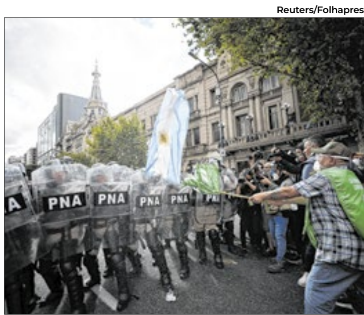
Idosos foram violentamente reprimidos pela polícia argentina

A tensão pós-manifestação se estendeu até para os tribunais. Ao menos 114 pessoas foram presas por agentes federais e pela polícia de Buenos Aires, mas já nas primeiras horas da madrugada