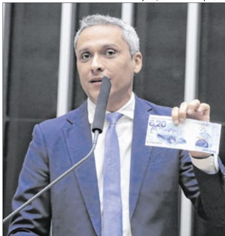
Presidente do Senado entrará com processo contra Gayer

Em outra publicação, que ele apagou horas depois, o parlamentar escreveu: “Me veio a imagem da Gleisi Hof-