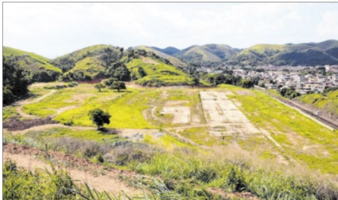
Segundo secretário, a empresa está paralisada há anos e já possui toda estrutura pronta

- A FMC está paralisada há anos e toda a estrutura já está pronta, com galpões para receber novos empreendimentos. Já temos 15 cartas de intenção de empresas para se instalarem dentro do Parque Industrial que já temos. Por isso, sob orientação do prefeito Furlani, buscamos ampliar nossa área disponível para viabilizarmos a vinda de empreendimentos que vão gerar desenvolvimento, emprego e renda para a nossa