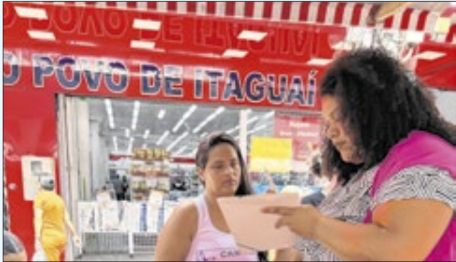
Ação no Calçadão de Itaguaí acontece nesta sexta (14)