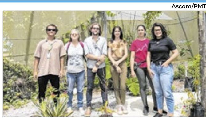
Essa foi a última vistoria do Instituto no local