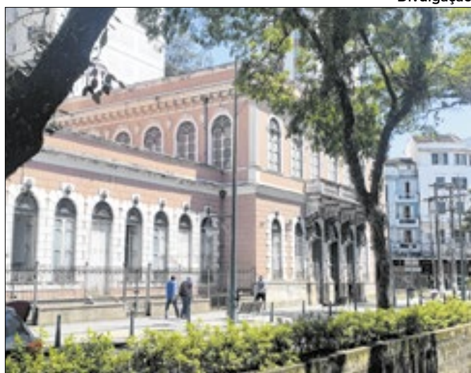
Encontro acontecerá no Cefet/RJ - Petrópolis