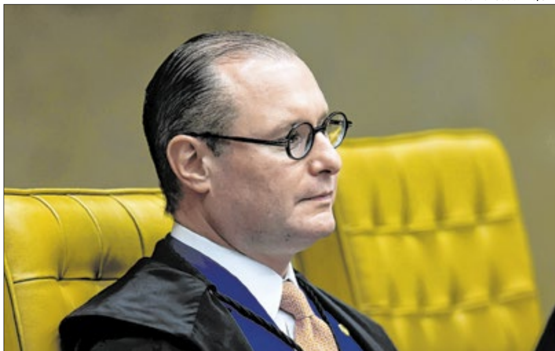
Zanin marcou o julgamento de Bolsonaro, que será na Primeira Turma

Além de Bolsonaro, compõem a primeira leva de acusados o ex-diretor da Agência Brasileira de Inteligência (Abin), o hoje deputado Alexandre Ramagem (PL-RJ); o ex-comandante da Marinha Almir Garnier; o ex-ministro da Justiça Anderson Torres; o ex-ministro do Gabinete de Segurança Institucional (GSI) Augusto Heleno; o ex-ajudante de ordens do ex-presidente da República, hoje principal colaborador da Justiça, tenente-coronel Mauro Cid; o ex-ministro da Defesa Paulo Sérgio Nogueira, e o ex-ministro