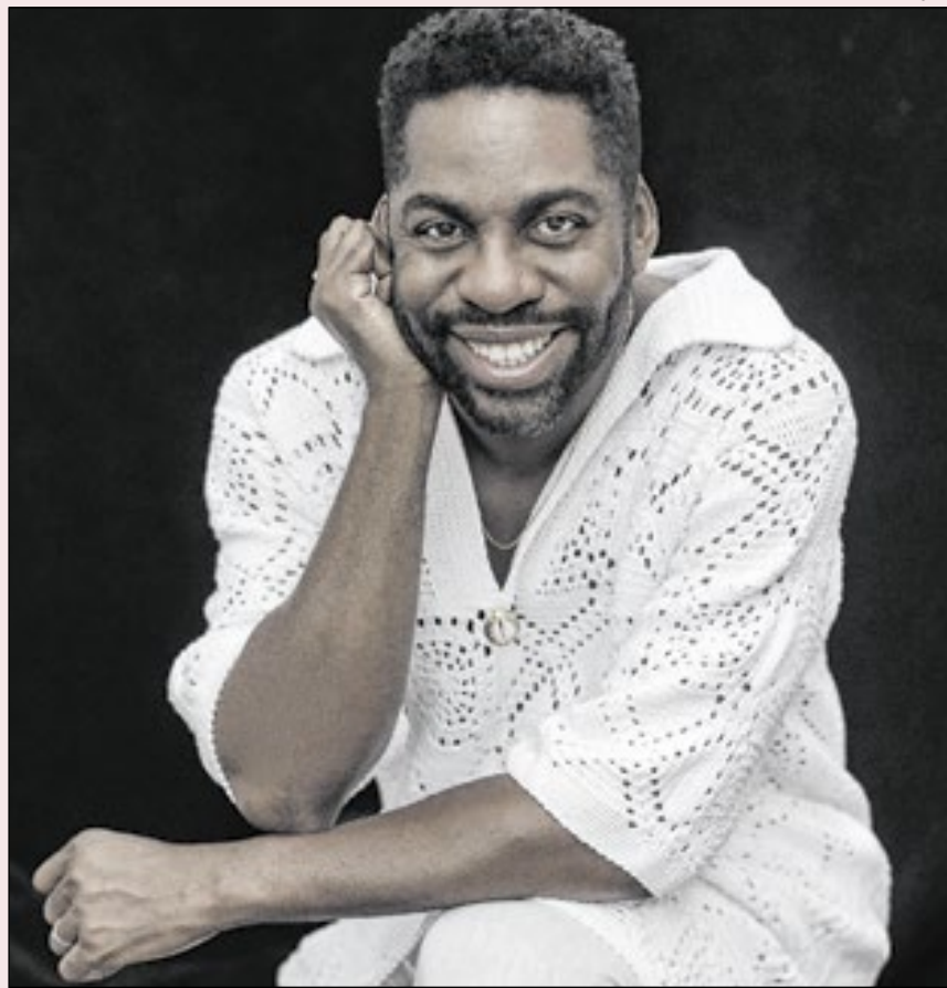
Lázaro Ramos diz que o livro traz mais perguntas do que respostas

O debate racial que Lázaro Ramos propôs na autobiografia 'Na Minha Pele' é amplificado em 'Na Nossa Pele', livro que o ator e diretor escreveu ao perceber que os problemas que enfrentou na vida são de uma esfera mais ampla