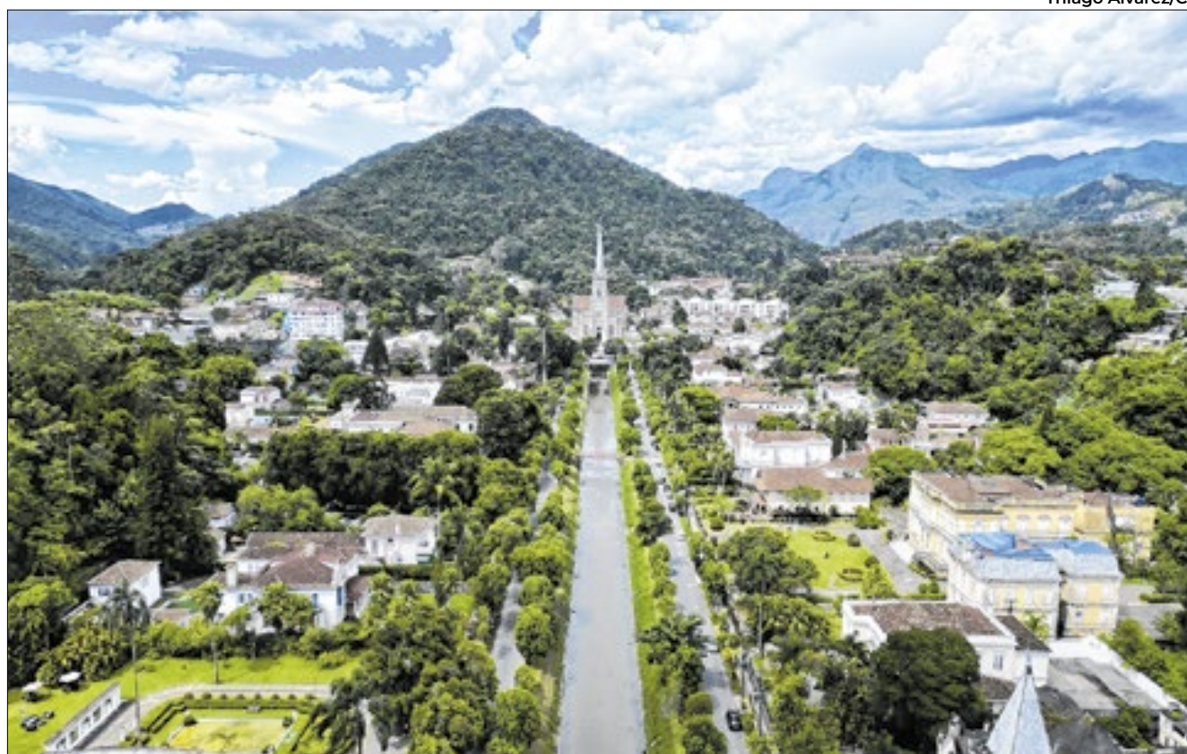
Neste próximo dia 16 de março de 2025, a cidade de Petrópolis comemora 182 anos de existência

esperados do ano, simbolizando a solidariedade da comunidade e proporcionando um instante de leveza em meio às dificuldades do tratamento. Rigorosamente triados e organizados, os produtos doados são distribuídos em um dia especial na sede da instituição.