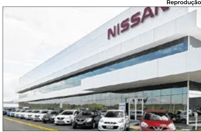
Montadora quer investir R$3,3 mi em jovens até 2030