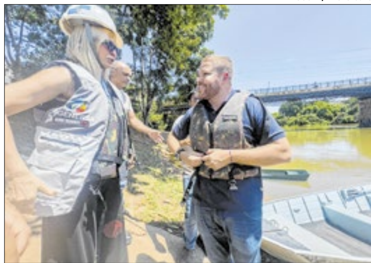
Ação teve como objetivo verificar destino do esgoto

Paraíba do Sul recebeu a visita da Agенера (Agência Reguladora de Energia e Saneamento Básico do Estado do Rio de Janeiro) para uma fiscalização detalhada dos serviços prestados pela concessionária Águas da Condessa. A ação, realizada nesta terça-feira (11), teve como objetivo principal verificação do destino do esgoto coletado na cidade e a análise da regularização das tarifas cobradas pelo serviço prestado no município. A fiscalização da Agенера é um passo importante para garantir que a população tenha acesso a um serviço de qualidade, transparência e justo.