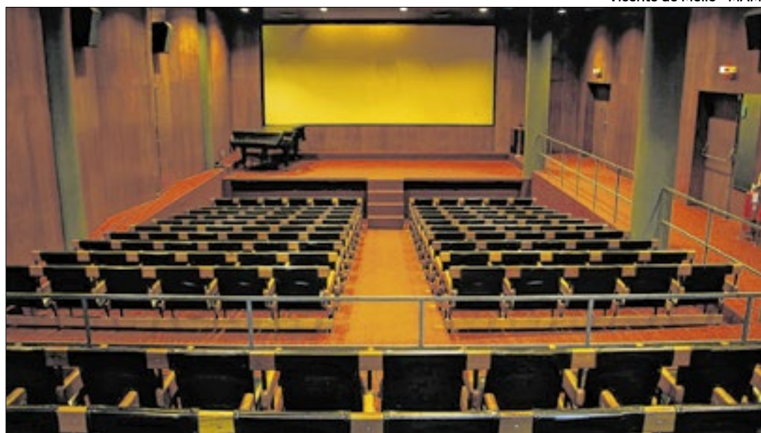
Recursos de R$ 390 mil, do programa Viva o Cinema de Rua!, viabilizaram iniciativa

A nova sala de cinema da Cinemateca do MAM (Museu de Arte Moderna), foi entregue, nessa quinta-feira (13). É o sexto cinema de rua revitalizado na cidade.