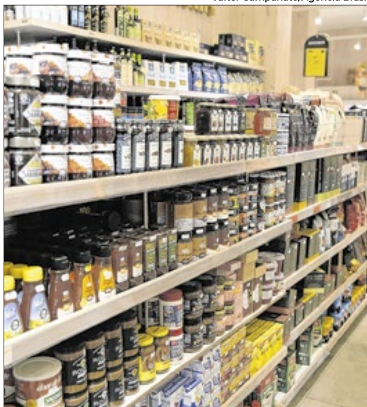
Onze produtos passam a ter alíquota zero de importação

Vale ressaltar que, para a sardinha, a alíquota zero será aplicada dentro de uma quota