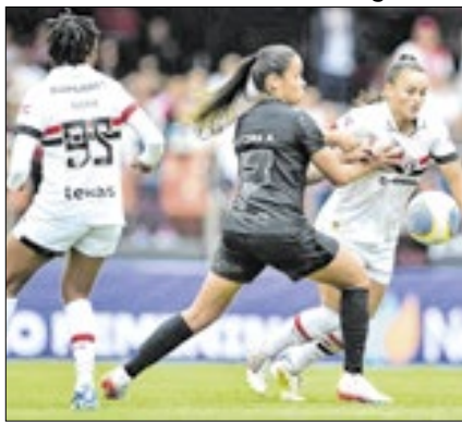
Majestoso vai decidir a Supercopa