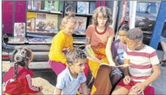
O projeto incentiva a leitura de crianças e jovens