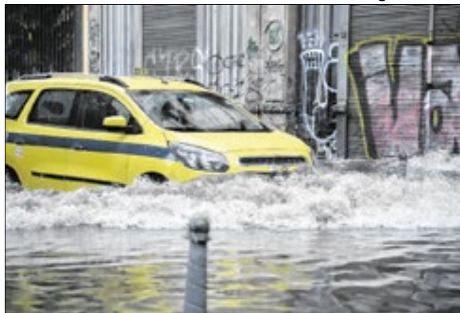
Temporais marcam 'despedida' atroz do tórrido verão