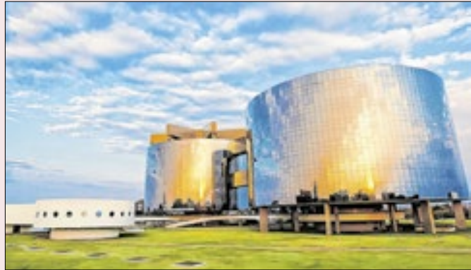
PGR vai avançar em novas investigações