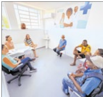
Secretaria Municipal de Saúde

Abandonar o consumo de cigarro é um grande desafio, mas com o apoio certo, essa jornada pode se tornar mais leve. Pensando nisso, a Prefeitura Municipal de Paraíba do Sul, através da Secretaria Municipal de Saúde, juntamente com a equipe Saúde Bucal, oferece um Grupo de Tabagismo, um serviço gratuito que auxilia fumantes que desejam largar o vício.