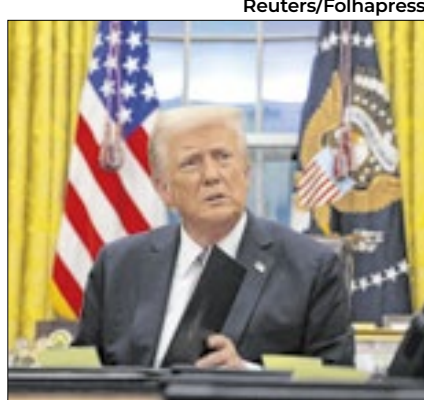
Encontro foi marcado por tensões

Apesar do momento descontraído, o encontro