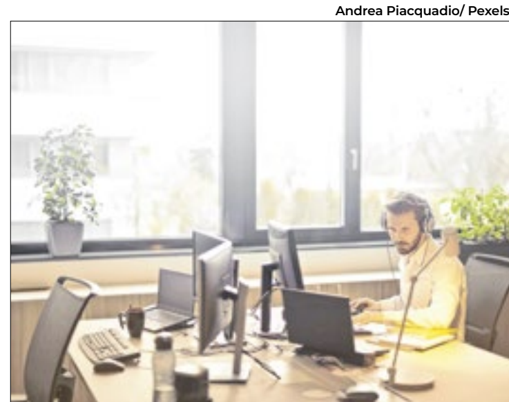
As áreas que avançaram foram as de informação e comunicação

7 - Itaperuna (Região Noroeste): Procon de Itaperuna - Avenida Porto Alegre, 267, Cidade Nova.