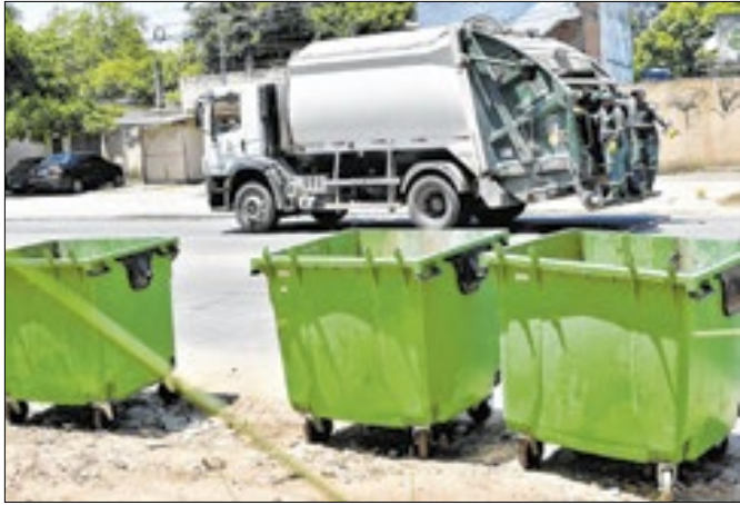
Cada contêiner pode armazenar mil litros cúbicos de lixo