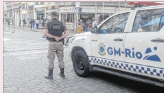
Atuais guardas ganhariam menos que os da FSA