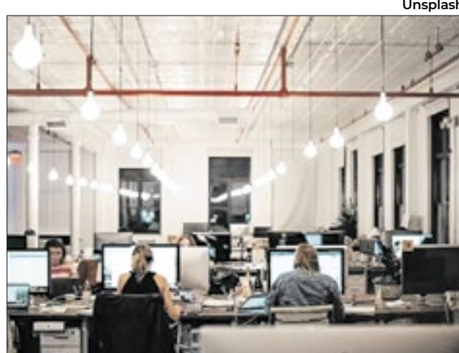
Indutores da alta do PIB em 2024, serviços perdem tração

Após registrar estabilidade (0,0%) em dezembro de 2024, o volume de serviços no país recuou 0,2% em janeiro. O retrocesso do 'motor' da economia nacional pode sinalizar a previsível desaceleração da atividade, por conta do aperto monetário aplicado pelo Banco Central (BC).