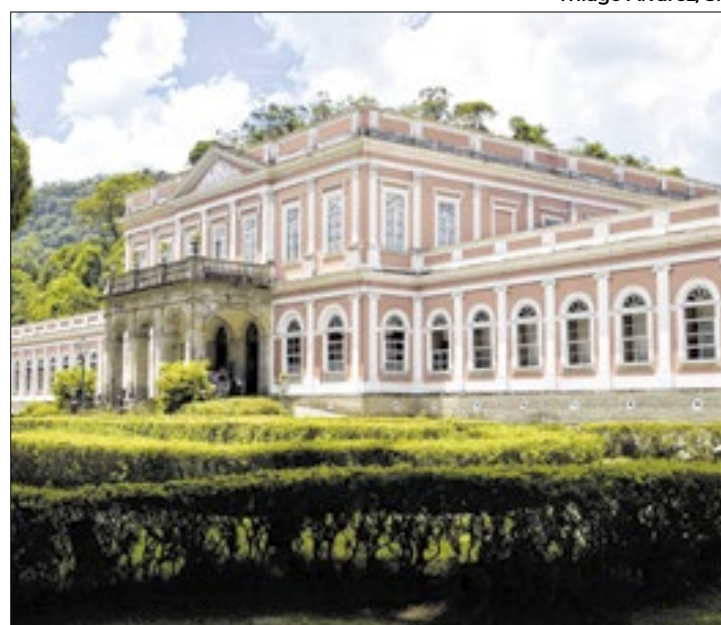
Museu Imperial preserva o legado da monarquia brasileira