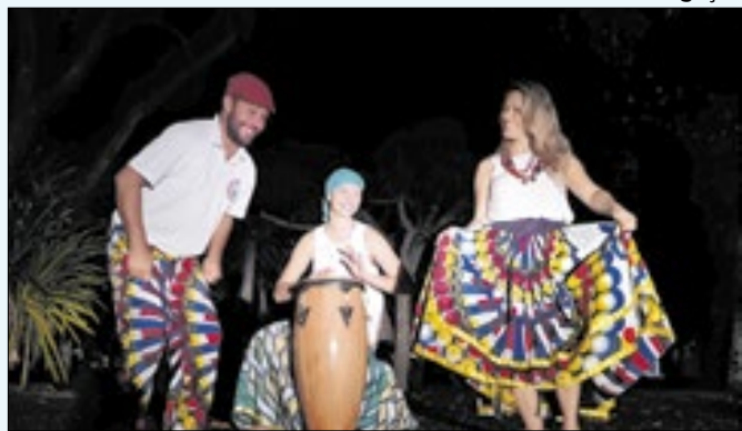
Apresentação será realizada no Sesc Quitandinha