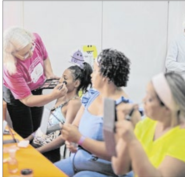
Ação eleva autoestima das pacientes de todos os gêneros

Em comemoração ao mês das mulheres, o Hospital Geral de Nova Iguaçu (HGNI) promoveu, na última quarta-feira (12), mais uma edição do “Dia da Beleza”. Mães e mulheres acompanhantes das crianças internadas na pediatria puderam desfrutar de uma manhã de relaxamento e bem-estar, com serviços gratuitos de maquiagem, limpeza de pele e massoterapia.