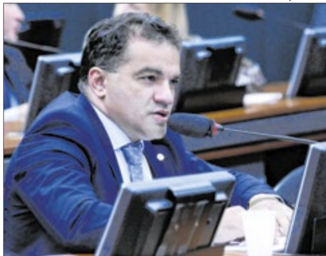
PF encontrou conversas de Maranhãozinho com agiota