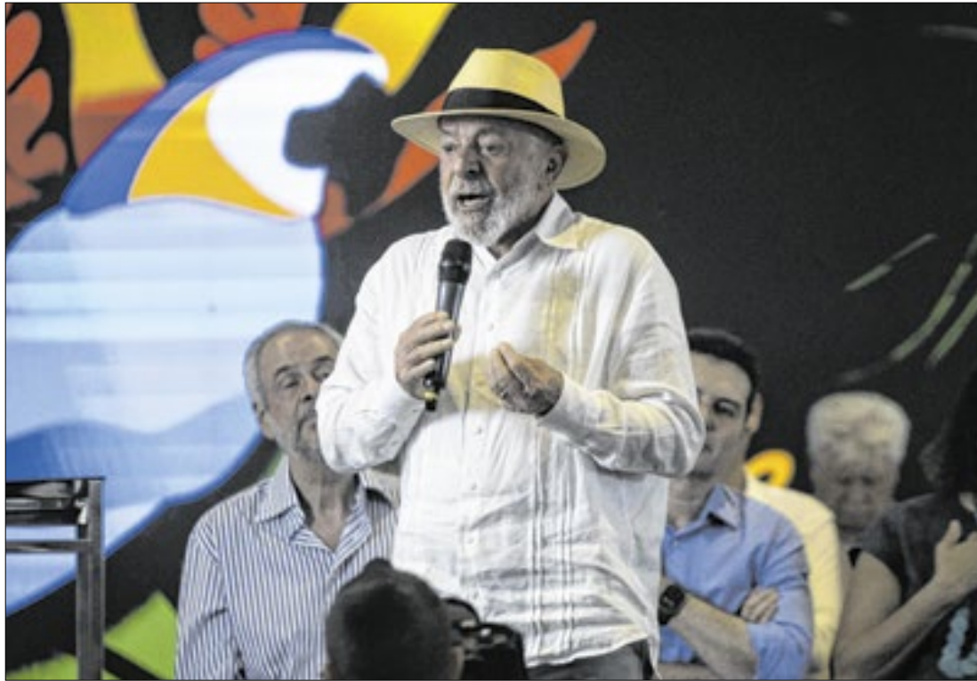
Presidente Lula durante visita a obras da COP30, em Belém, no mês passado

Atualmente, pela falta de vagas combinada com a alta demanda, o mercado imobiliário em Belém tem preços exorbi-