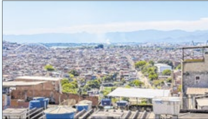
Complexo da Maré tem sido alvo de intensos tiroteios