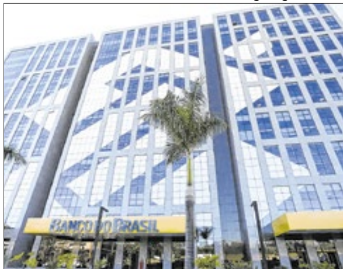
Receitas de fontes limpas e de negócios ESG dão a liderança