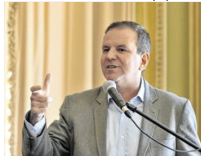
Para procurador do MPT, projeto do prefeito é ilegal