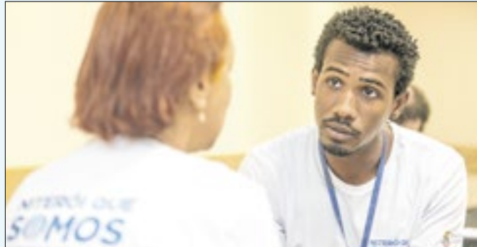
Simulação da pesquisa no treinamento