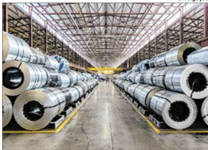
Tarifas sobre aço que chega aos EUA começaram a valer

Além disso, o salto de cinco pontos percentuais na produção americana desejado por Trump adicionaria apenas 5,4 milhões de toneladas à produção anual do país, número bem inferior ao total importado pelos americanos.