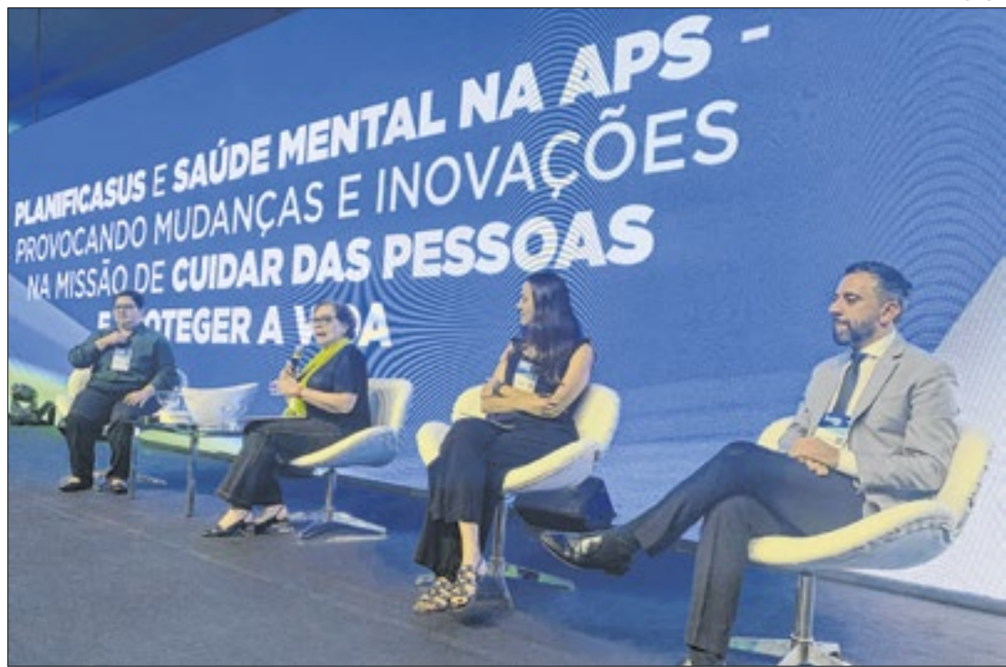
Anúncio foi feito pela Secretaria da Saúde do Paraná, em evento em Foz do Iguaçu

Com a expansão, das 2.740 UBS existentes no Paraná, 1.491 farão parte do PlanificaSUS, além de todos os 157 Caps do Estado. Hoje existem outras 34 Unidades Ambulatoriais Especializadas atuantes no progra-