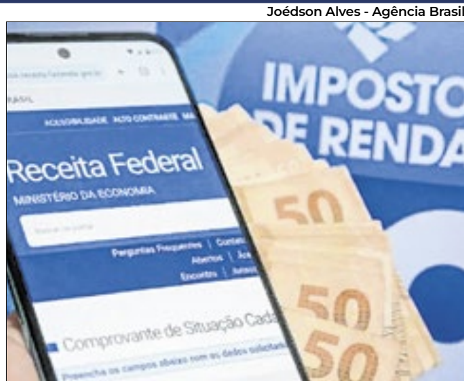
Declaração pré-preenchida terá prioridade em restituição