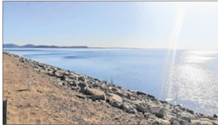
Delta do São Francisco perdeu de 15 a 50 metros de solo