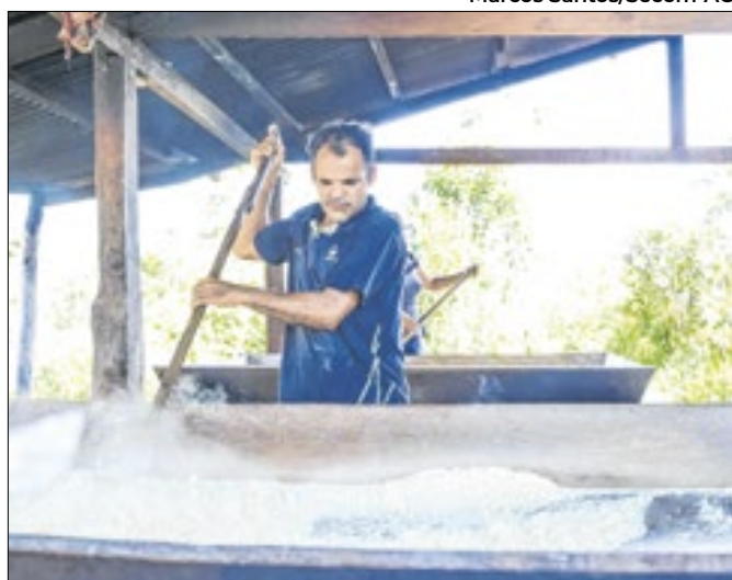
Parceria restaura áreas e aumenta produtividade