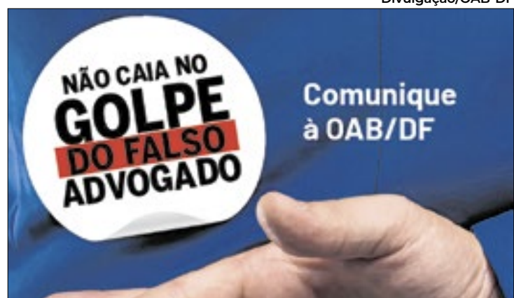
Ação combate fraudes praticadas por falsos advogados