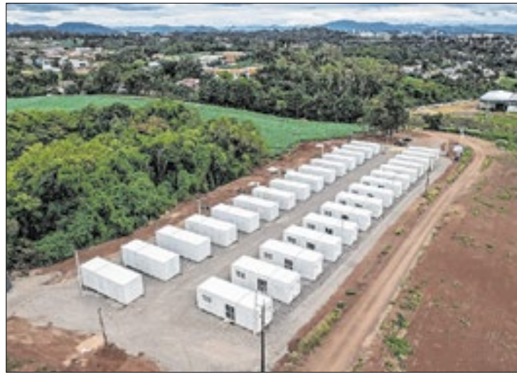
Número de unidades em uso pelas famílias chega a 362

O governo do Estado, por meio da secretaria de Habitação e Regularização Fundiária (Sehab), entregou, nesta quarta-feira (12/3), mais 30 casas temporárias para famílias atingidas pelas enchentes em Cruzeiro do Sul. As moradias estão localizadas no Novo Passo de Estrela, área de 16 hectares desapropriada pelo Estado para reassentar as famílias atingidas no Passo de Estrela, maior bairro da cidade e que foi fortemente atingido pela cheia. Outras 28 unidades haviam sido implantadas em setembro, ao lado do Esporte Clube Salão Quinze de Novembro, no bairro São Gabriel.