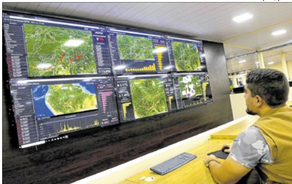
O Instituto utiliza imagens de satélite e detecta alterações na cobertura florestal

Os dados mostram que os municípios com maior número de alertas de desmatamento foram Novo Aripuanã, com 52 ocorrências e 410 hectares desmatados; Apuí, com 49 alertas e 842 hectares derrubados; e