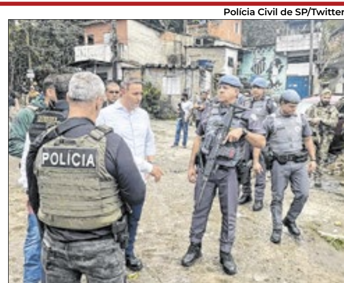
Agentes na Operação Escudo, no Guarujá