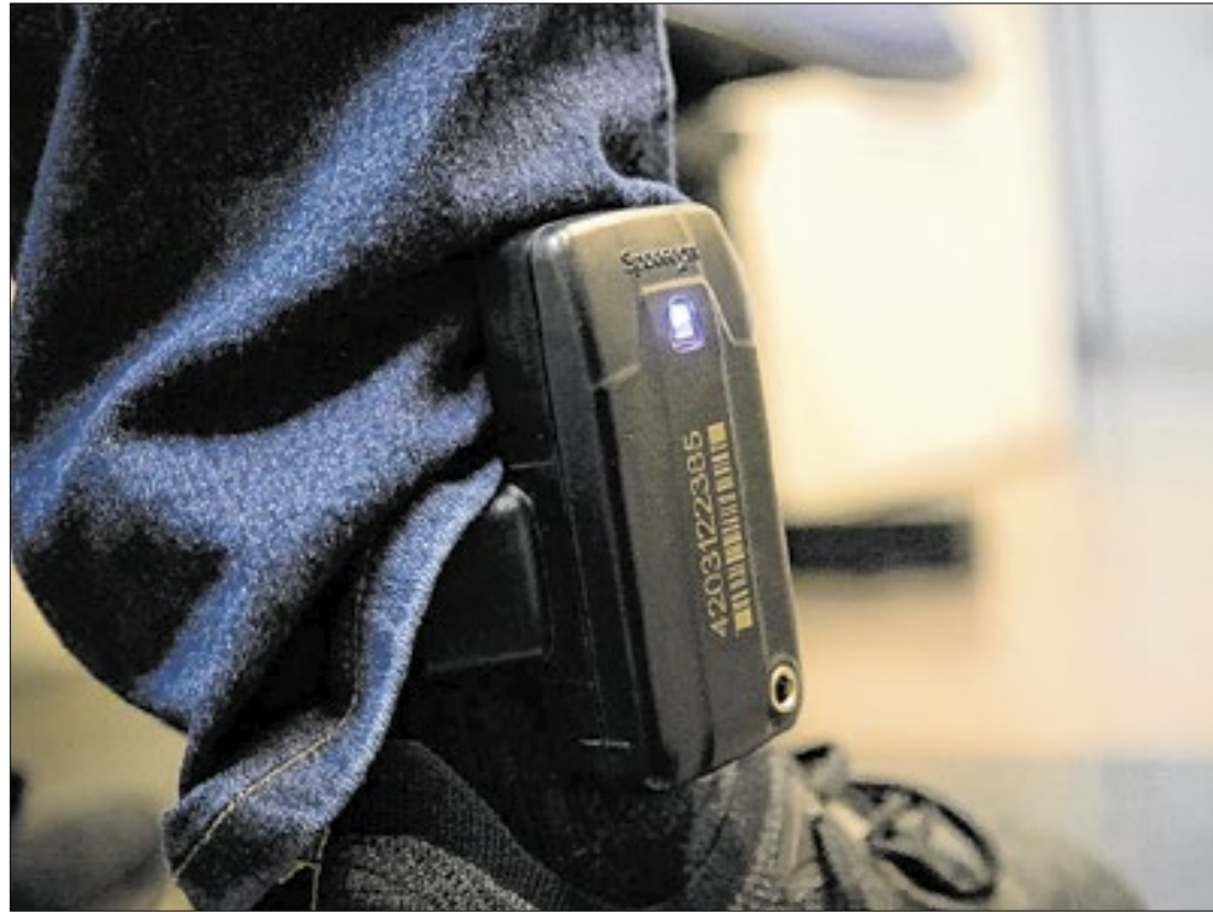
Iniciativa pioneira dá atendimento imediato em casos de violação de medidas protetivas

As forças de segurança de São Paulo monitoram atualmente todos os passos de 117 homens suspeitos de violência contra a mulher na capital. A ação integra o programa de monitoramento de infratores com tornozeleiras eletrônicas, que fiscaliza detidos que foram soltos em audiências de custódia na cidade de São Paulo. Desde 2023, o foco prioritário são os suspeitos envolvidos em denúncias de violência doméstica.