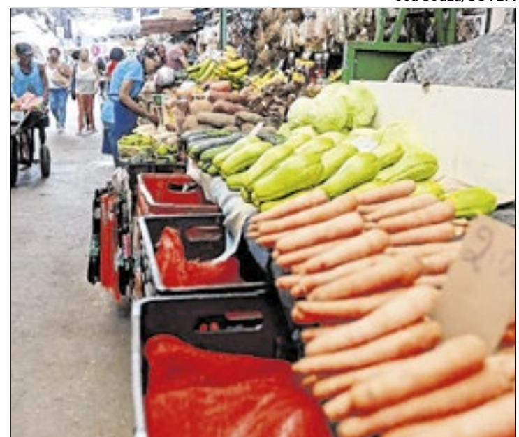
O Estado é um dos pioneiros na adoção desta política