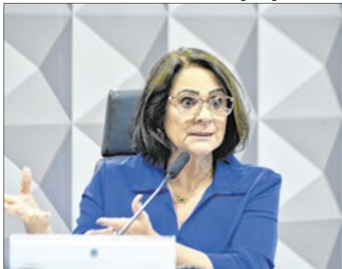
Damares: direita avança sobre os direitos humanos