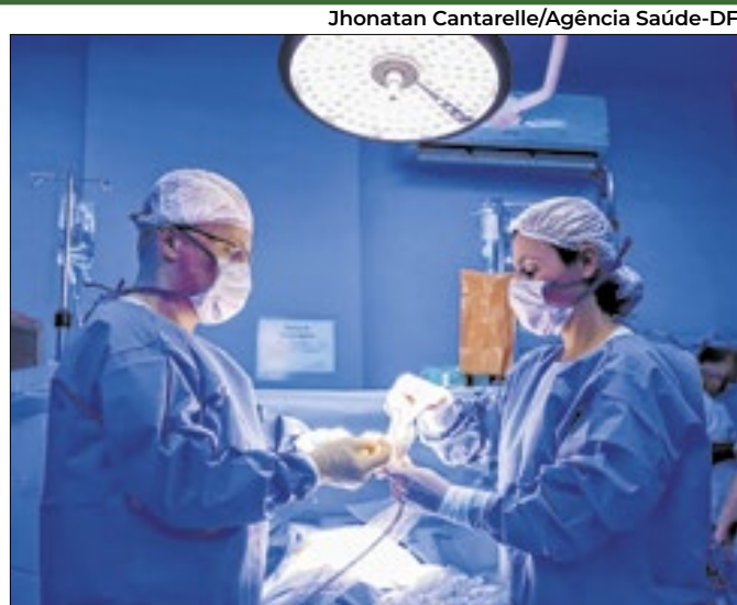
Documento aborda distribuição de equipes nas unidades

Ela é acusada de ter matado os pais. Julgamento foi suspenso