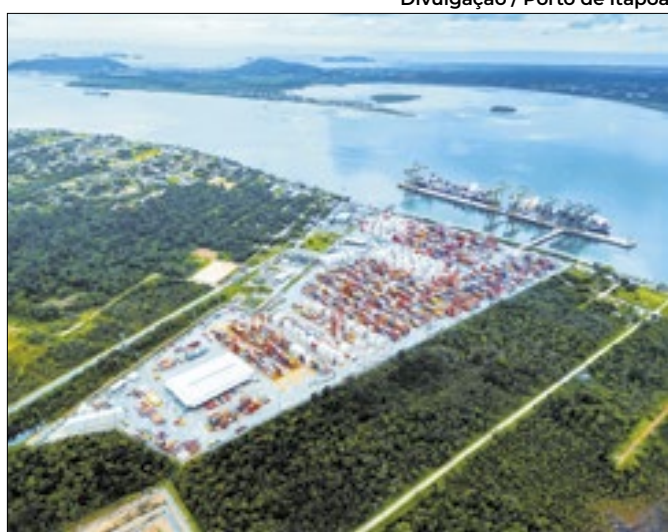
Estado e portos da Baía da Babitonga fazem acordo