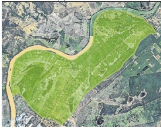
O terreno está situado às margens do rio São Francisco