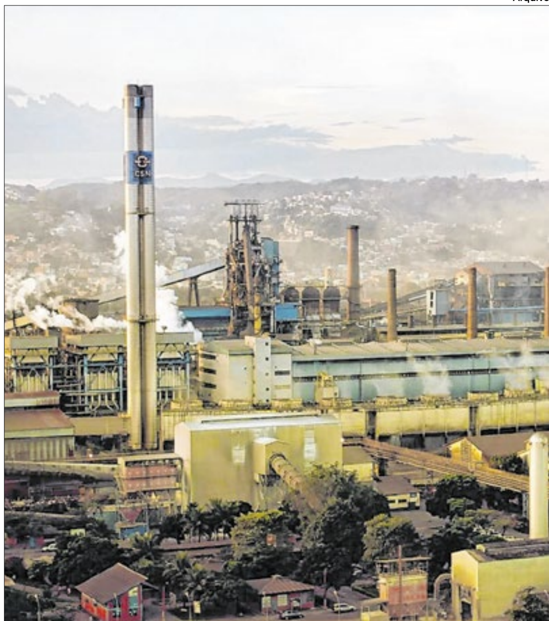
CSN exporta com maior valor agregado, mas 70% da produção fica no mercado doméstico

onde ele é processado e enviado para os EUA ou comercializado no mercado local.