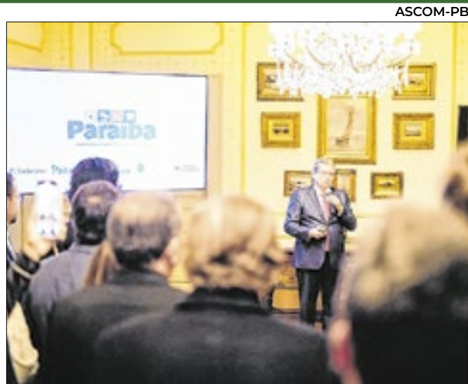
Ação aconteceu no âmbito da "Missão Paraíba"

No estado, o óleo de soja teve alíquota reduzida em 12%