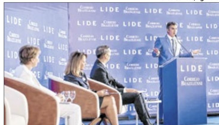
Barbalho cita COP 30 em evento sobre economia e energia