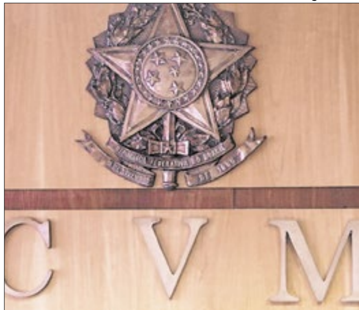
'Xerife' do mercado de capitais aplica recorde de multas

No quarto trimestre de 2024, o colegiado julgou 35 processos (29 Rito Ordinário