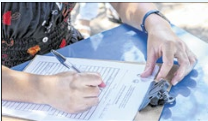
Projetos buscam facilitar o acesso da população aos serviços