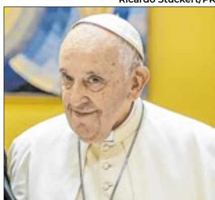
Apostadores querem lucrar com Papa

O Papa Francisco se recupera no hospital, mas espera-se que o próximo papa seja anunciado ainda este ano, seja filipino e adote o nome de Francisco 2º. Essas são as principais apostas nos mercados de apostas, que há semanas abriram especulações sobre a sucessão papal e já movimentaram quase R$ 6 milhões pelo mundo, segundo o serviço GamblingNews, especializado no tema. Um retrato da decadência moral da sociedade.