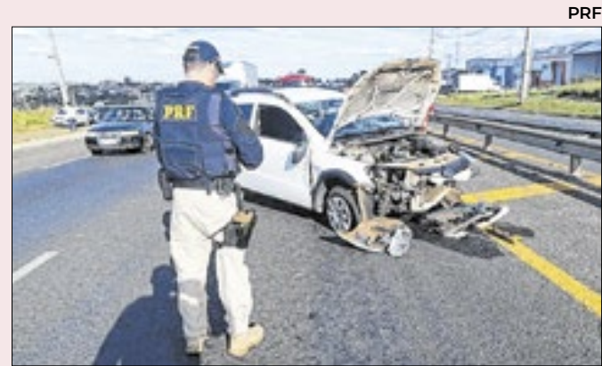
Mortos em acidentes continuam a aumentar

“Quando esse princípio precisa ser invocado em discursos e lembrado em avisos é porque estamos diante de flagrante desequilíbrio ou desrespeito. É certo que as investidas tarifárias do presidente Donald Trump contra diversos países não pasará impune”.