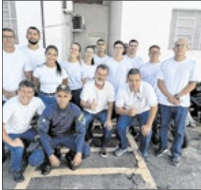
Reforço na segurança

A Prefeitura de Três Rios, por meio da Secretaria de Ordem Pública e Políticas de Segurança, anunciou na segunda-feira (10) a convocação de 13 aprovados no concurso público para a Guarda Civil Municipal. Inicialmente, o edital previa apenas cinco vagas, mas diante do crescimento da cidade e da necessidade de reforçar a segurança, o número de convocados foi ampliado. Os novos agentes passarão por um curso preparatório de quatro semanas antes.