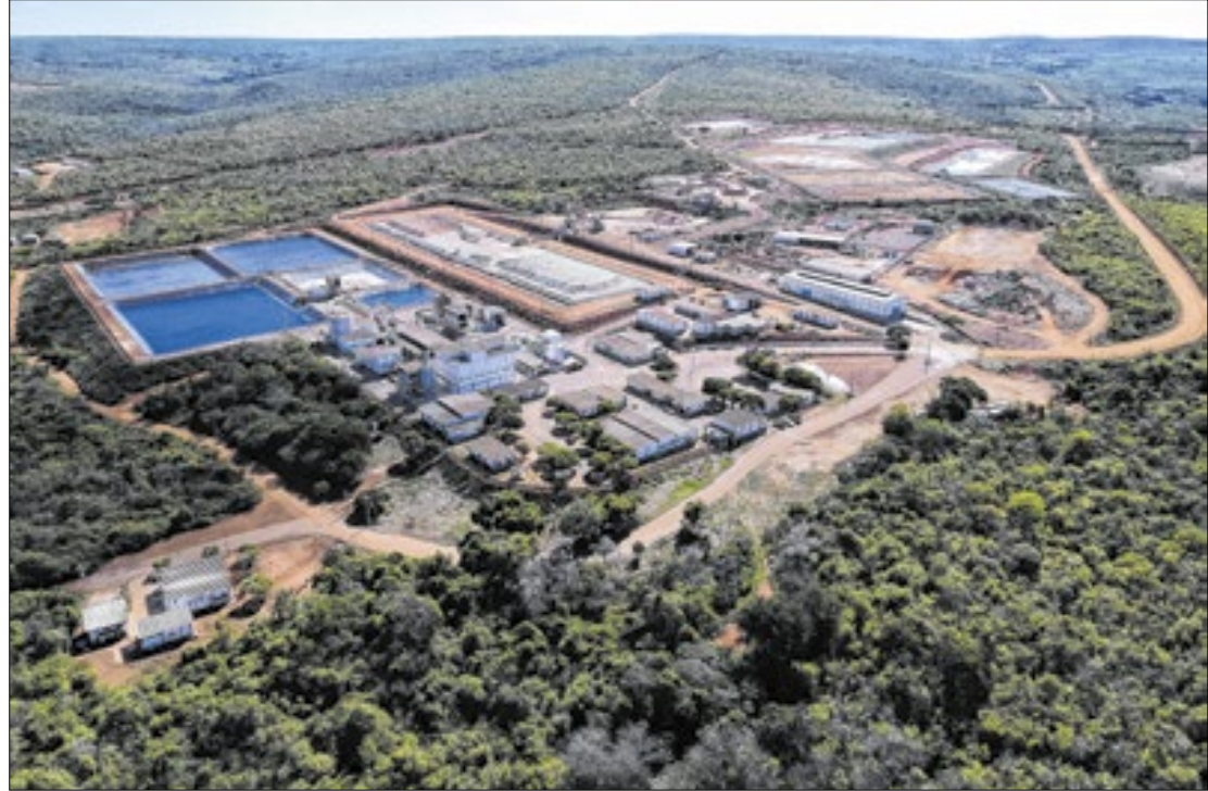
INB fecha contrato com empresa Russa para conversão e enriquecimento de urânio

A conversão é a única etapa do ciclo do combustível nuclear que a INB não realiza e consiste na transformação do yellowcake em hexafluoreto de urânio (UF6), um composto que tem como propriedade passar para