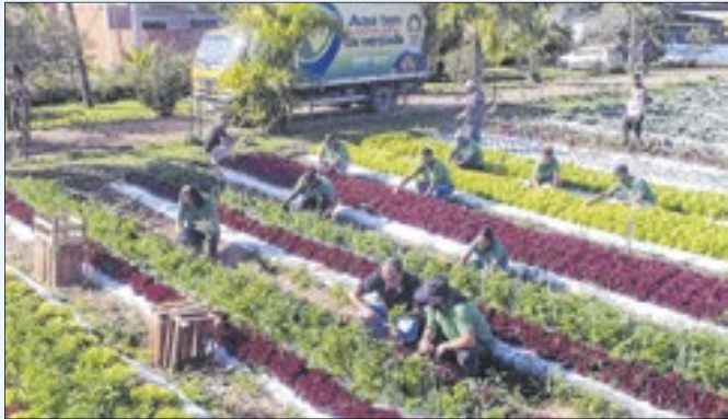
Ação terá prestação de serviço de auxílio a agricultores