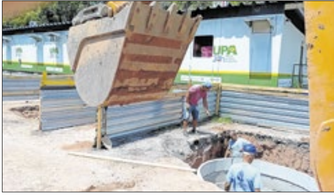
Construção de rede de esgoto e drenagem na UPA