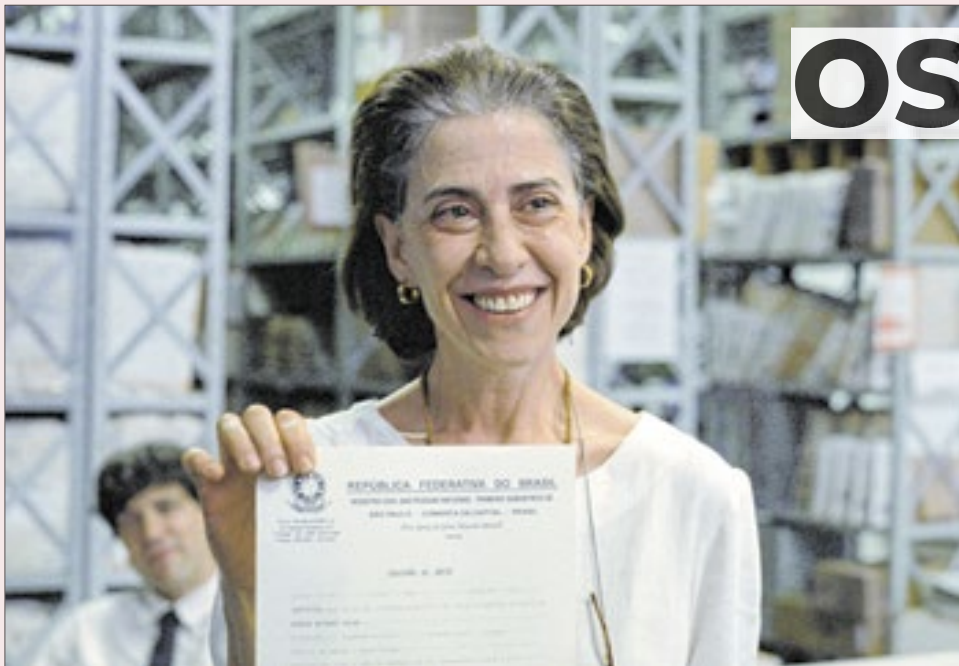
Fernanda Torres conquistou corações e mentes no Brasil e exterior