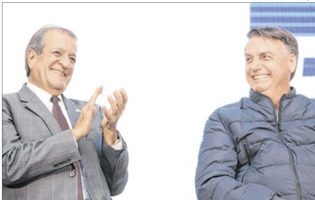
Valdemar poderá volta a se reunir com Bolsonaro

“É cediço que as medidas cautelares visam assegurar o resultado útil do processo vindouro, de modo que o arquivamento do inquérito policial por absoluta falta de justa causa para a instauração da persecução penal é suficiente para esvaziar a pertinência e a necessidade das cautelares eventualmente decretadas”, justificou Bessa na solicitação. “É dizer, com todo o respeito, que o processo criminal constitucional brasileiro não confere espaço para a subsistência de medidas cautelares quando ausente um procedimento investigativo ou mesmo uma ação penal correlata”, prosseguiu.