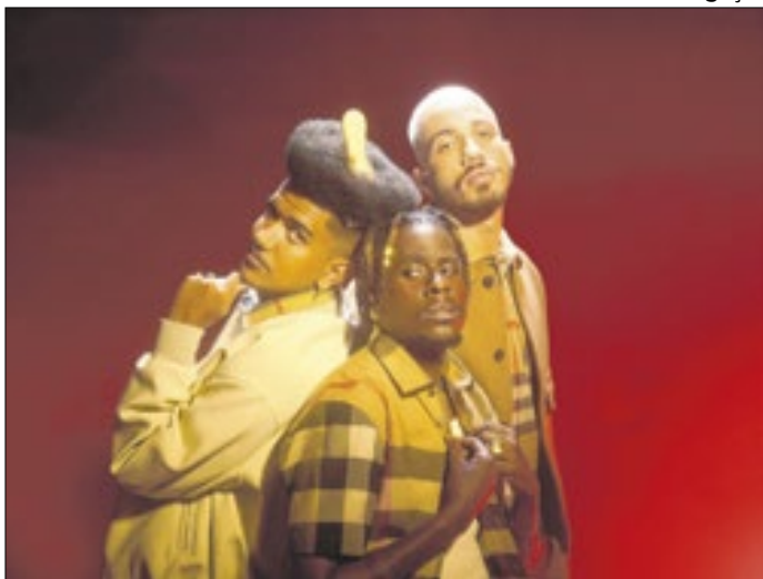
Os Garotín de São Gonçalo ganharam Grammy