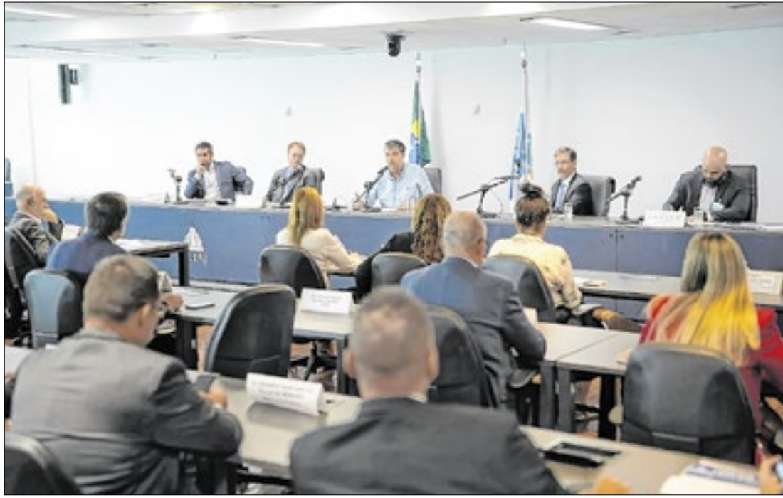
Secretário de Estado de Fazenda, Juliano Pasqual, em audiência pública na Alerj