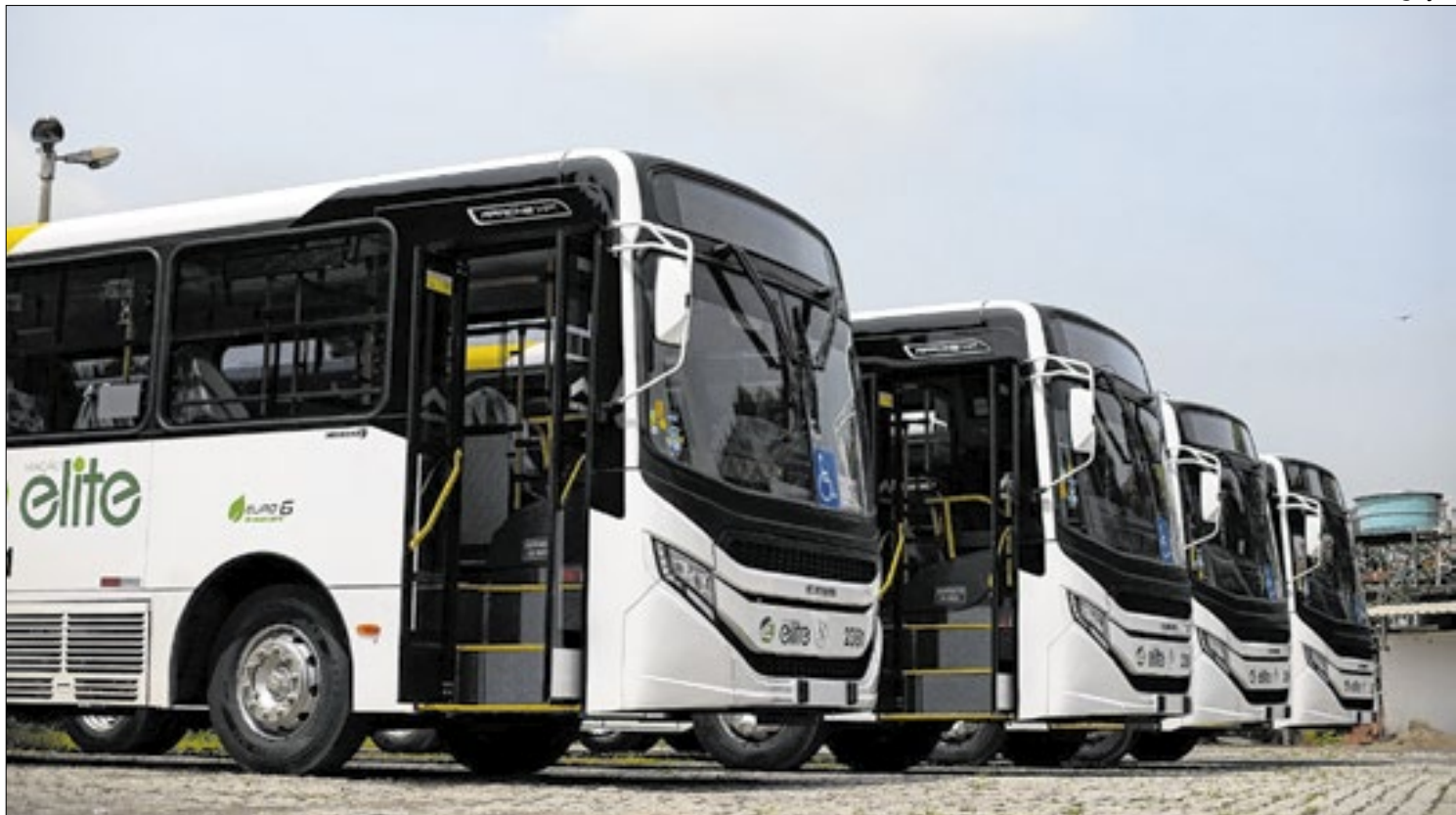
Documento informa que a intervenção pode ser reavaliada em caso de regularização

os alunos da rede municipal de ensino. Estamos formando uma geração mais responsável, que compreenderá o impacto de suas ações no meio ambiente. Com esse projeto, damos um passo importante para o futuro sustentável de Resende", disse.