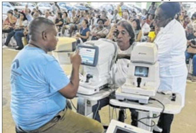
Nesta semana há cirurgias, consultas pré e pós operatórias