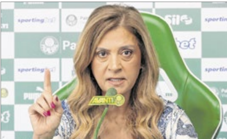
A presidente do Palmeiras cobrou muitas milionárias