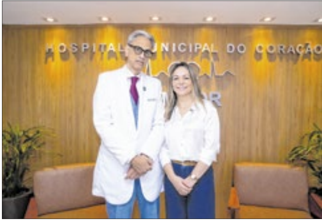
Hospital prometeu revolucionar a saúde na Baixada