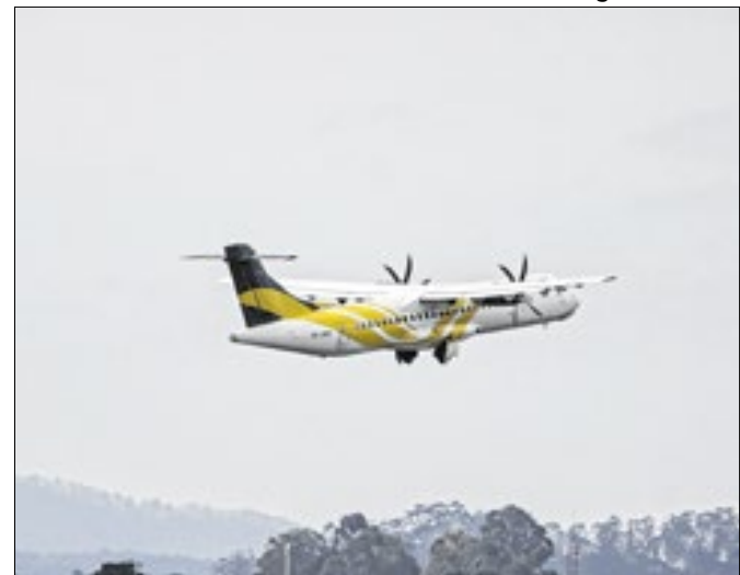
Voepass foi obrigada a suspender voos