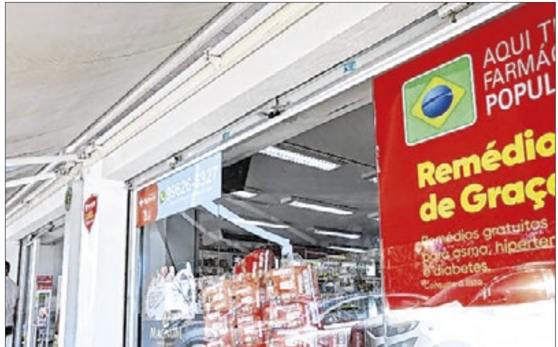
O programa disponibiliza medicamentos e insumos de forma gratuita em farmácias

Para se credenciar, é necessário preencher o formulário de cadastro e separar os certos documentos com firma reco-