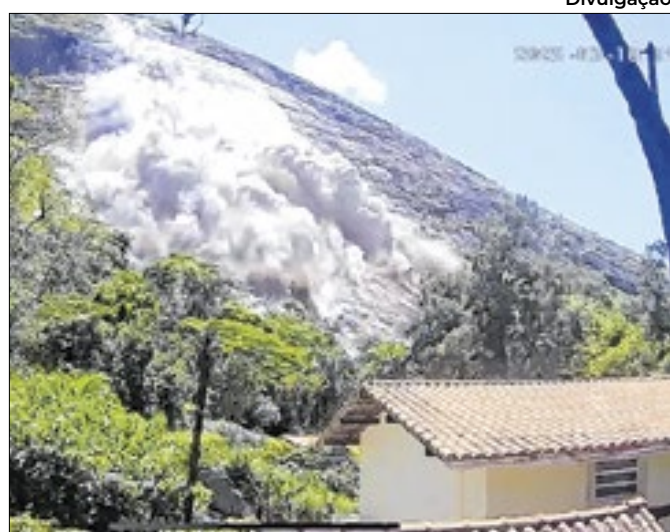
foram três deslocamento nesta segunda-feira