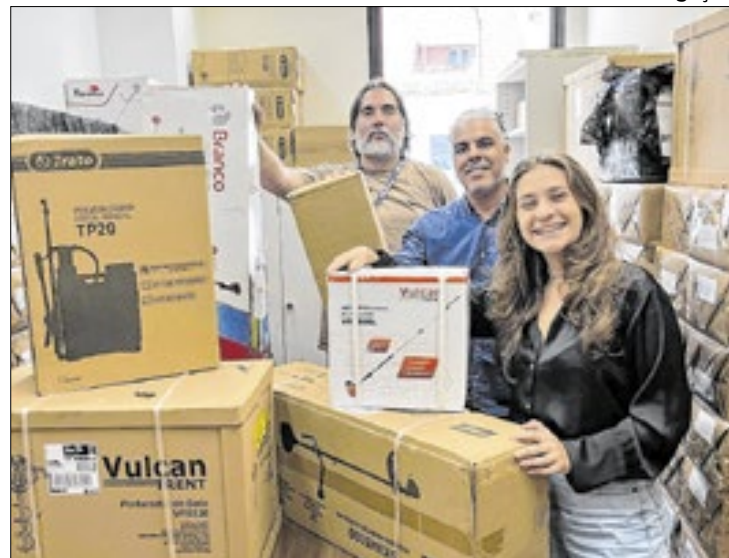
Máquinas foram conquistadas por emendas parlamentares

No Instituto Estadual do Ambiente (Inea), órgão vinculado à Secretaria Estadual do Ambiente e Sustentabilidade, a parlamentar teve acesso aos equipamentos que serão utilizados para restauração florestal em Três Rios. As máquinas foram conquistadas após pedido da vereadora ao deputado estadual Carlos Minc, que indicou emenda parlamentar com o objetivo de garantir investimentos em preservação das unidades