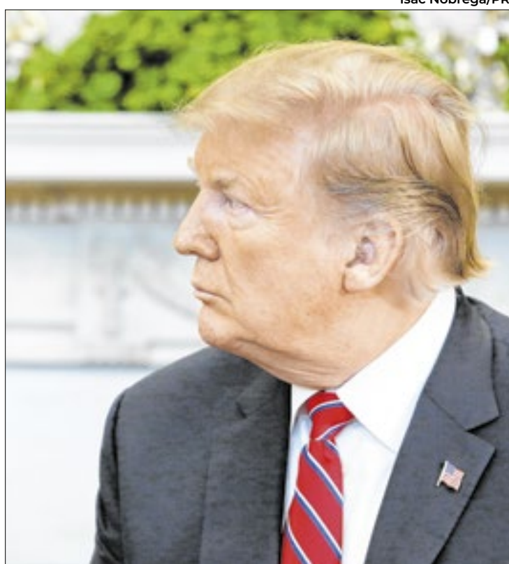
Trump cumpre promessa de sobretaxar aço brasileiro

No discurso, Lula também disse querer igualdade entre as nações e reforçou a necessidade de um respeito mútuo entre os países. “Quero sair da Presidência entregando mais do que eu prometi nas eleições. O Brasil passou a ser um país respeitado. O Brasil não quer ser maior do que ninguém, mas o Brasil não aceita ser menor. Queremos ser iguais. Porque, sendo iguais,