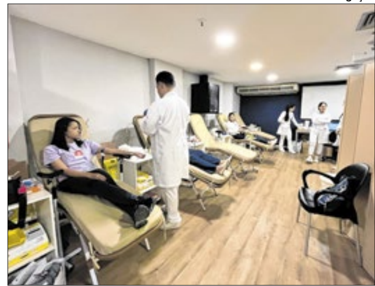
Ação é parceria do Shopping Multicenter Itaipu e Grupo GSH