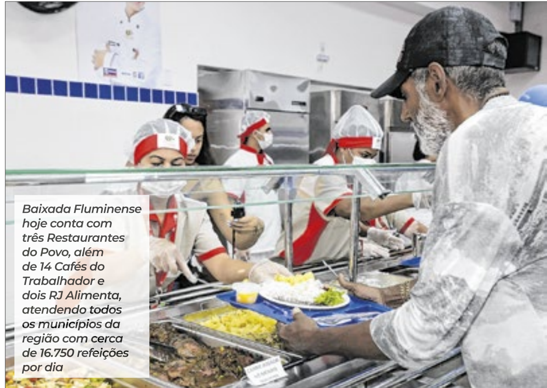
Baixada Fluminense hoje conta com três Restaurantes do Povo, além de 14 Cafés do Trabalhador e dois RJ Alimenta, atendendo todos os municípios da região com cerca de 16.750 refeições por dia

- Na prática, a inauguração em Queimados nos ajuda a fortalecer de forma muito efetiva a rede de alimentação com segurança na Baixada, onde já estamos atendendo os municípios com maior densidade demográfica, que são Duque de Caxias e Nova Iguaçu, além de Belford Roxo, que também está entre as cidades mais populosas do