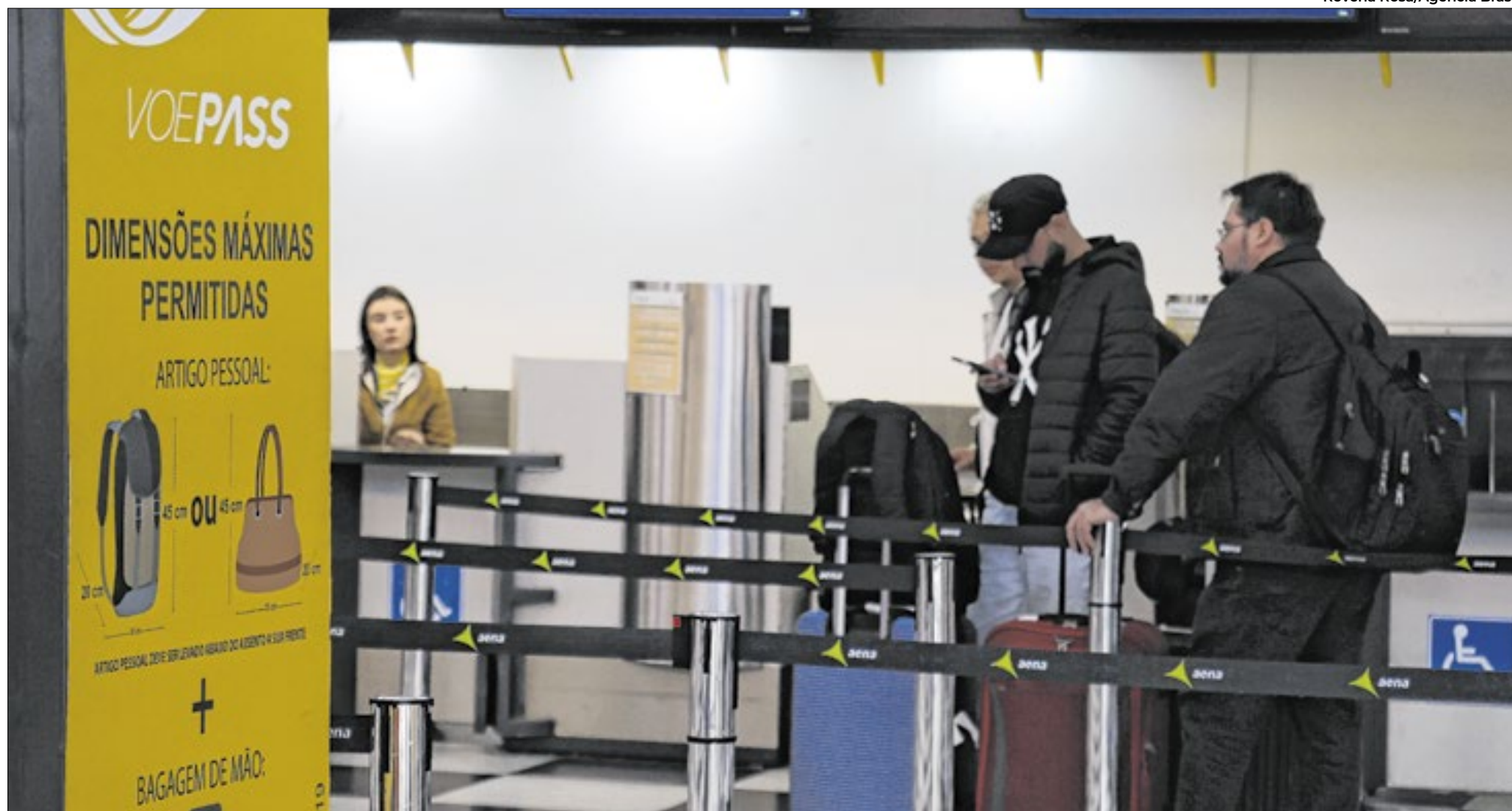
Passageiros afetados devem procurar a empresa ou agências de viagens