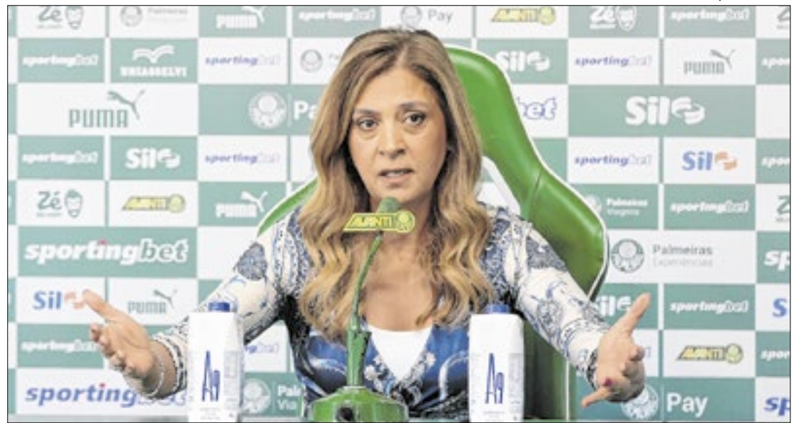
Presidente do Palmeiras, Leila Pereira lidera pedido por punições pesadas contra o racismo

O clube teve o apoio da Libbra e da LFU na ação de combate ao racismo em torneios da América do Sul. Com a adesão