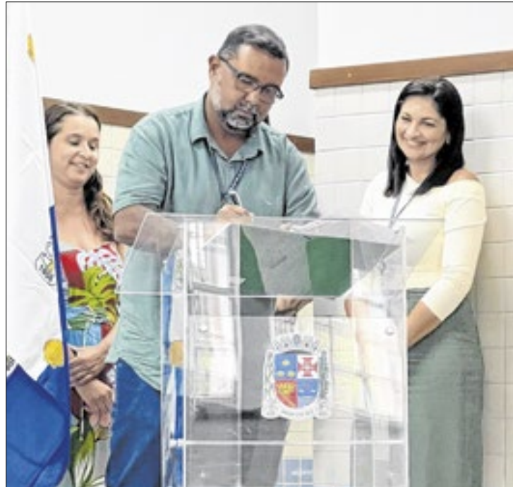
Diagnóstico foca em 166 turmas de creche e pré-escola

O Laboratório de Estudos e Pesquisas em Educação e Economia Social (LEPES), da Universidade de São Paulo (USP), firmou uma parceria com a prefeitura de Angra dos Reis, por meio da Secretaria de Educação, Juventude e Inovação, para elevar a qualidade do ensino desde os primeiros anos. O projeto foi selado nesta segunda-feira (10).