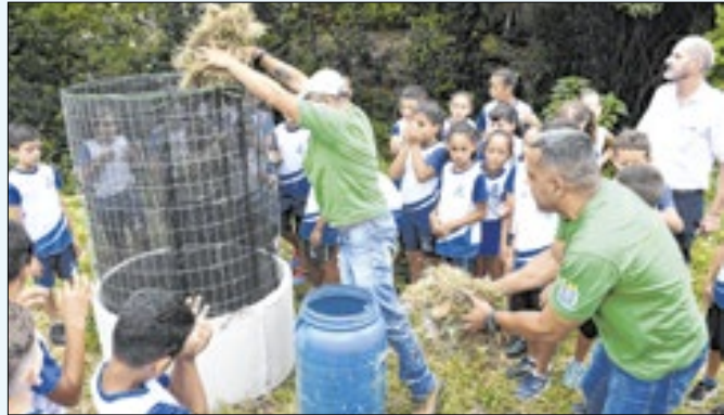
Escola Augusto de Carvalho é a primeira beneficiada