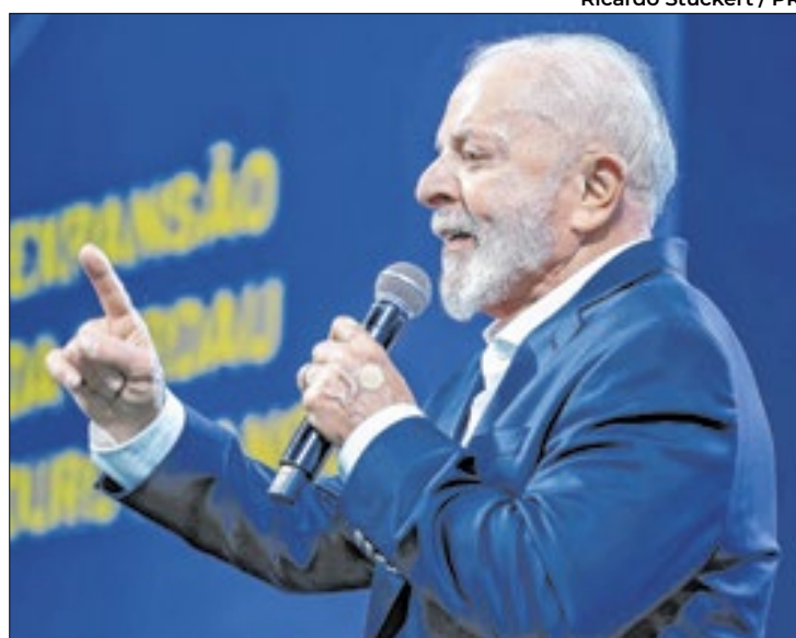
Ricardo Stuckert / RP