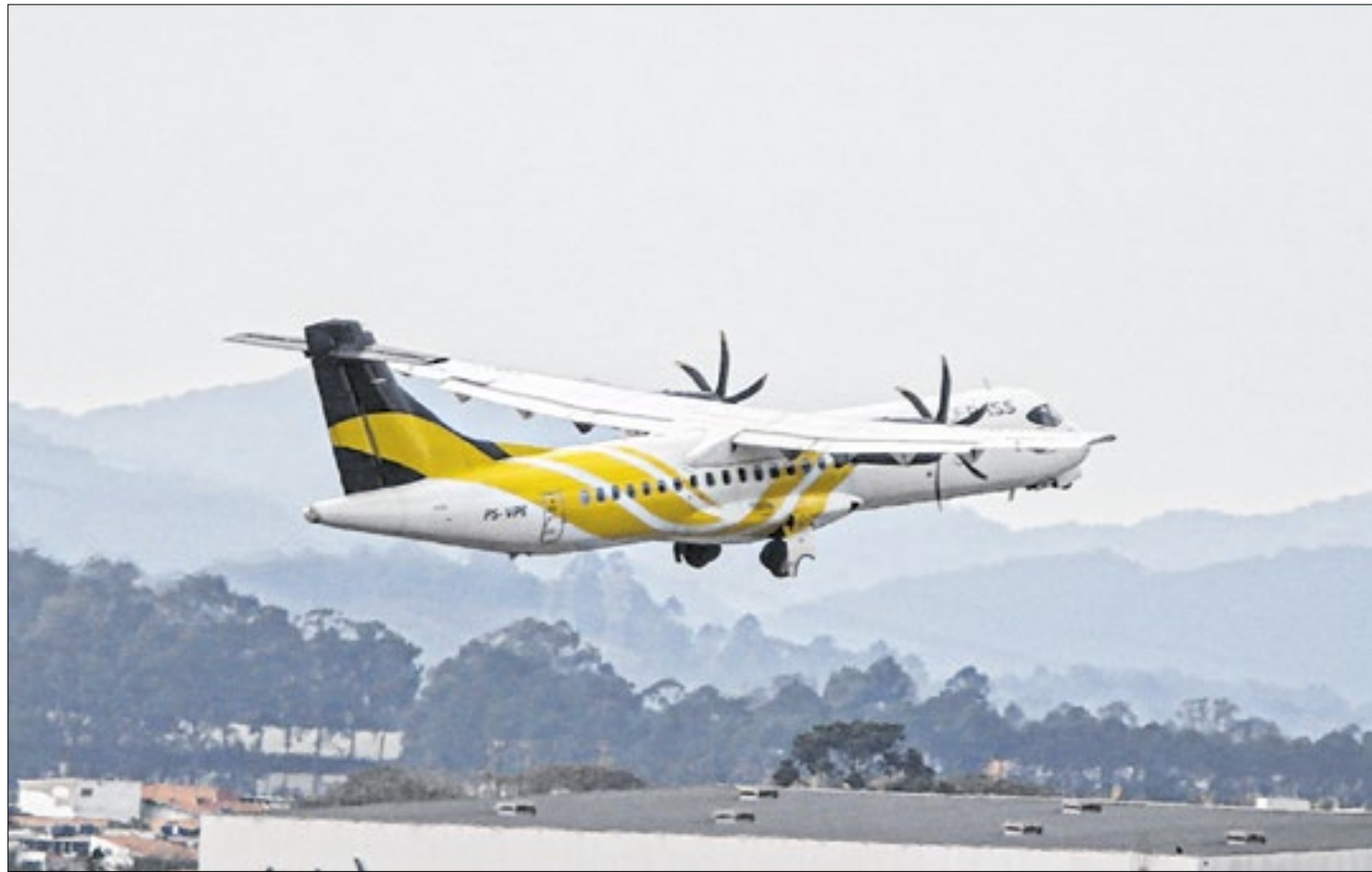
A Voepass possui seis aeronaves e a operação incluía 15 localidades

Após o acidente aéreo ocorrido no dia 9 de agosto do ano passado, em Vinhedo (SP), foi implantada uma operação assistida de fiscalização da Anac nas instalações da companhia. Funcionários