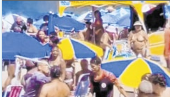
Discussão sobre cadeira põe em risco famílias e crianças