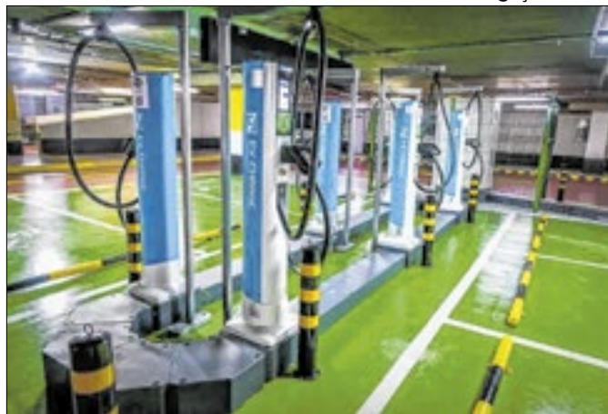
Iniciativa representa avanço na mobilidade sustentável