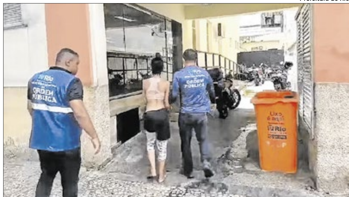
Após proferir injúria racial contra funcionária da Seop, acusada é presa em flagrante

Na Avenida Atlântica, durante uma abordagem, um homem tentou dificultar a ação dos agentes e se apresentou com um nome falso.