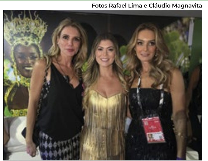
A anfitriã do camarote no setor 9 e primeira-dama do Estado do Rio de Janeiro, Analine Castro, ao centro com Renata Padilha (e) e Kitty Monte Alto (d)

O governador Cláudio Castro e a primeira-dama, Analine, foram os grandes anfitriões do camarote do Governo do Rio, no setor 9. Autoridades, políticos e empresários prestigiaram o convite do governador para o Desfile das Campeãs, no Sambódromo da Marquês de Sapucaí.