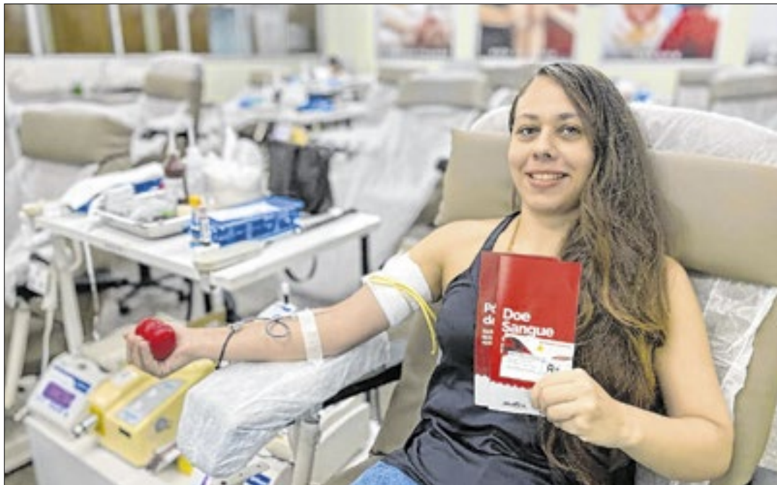
Atualmente, o público feminino representa 44% dos doadores de sangue no Ceará

Dados apontam alta na oferta de sangue no estado