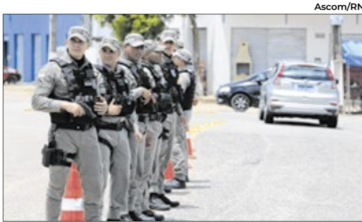
Governo do Estado investiu R$ 7 milhões em diárias

O encontro discutiu o uso do fogo pelos moradores, com o objetivo de integrar os saberes comunitários e buscar boas práticas de manejo para prevenir e combater incêndios florestais, que afetam as espécies e seus habitats.