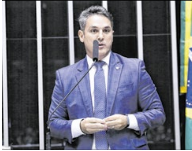
Representação de Zucco questiona contrato