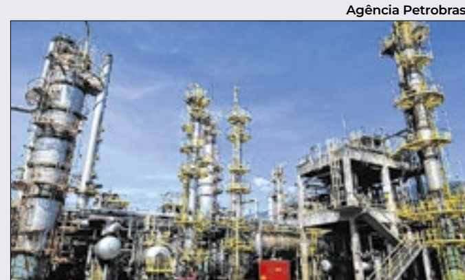
Abandono da paridade internacional cobra seu preço

"Com as novas medidas, será mais difícil para os golpistas manterem chaves Pix com nomes diferentes daqueles armazenados nas bases da Receita Federal. Para garantir o cumprimento das novas regras, a conduta dos participantes será monitorada pelo BC".