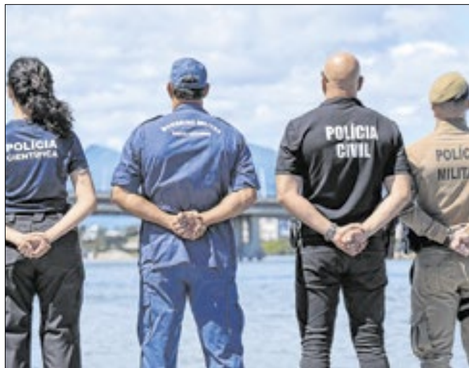
Índices de criminalidade caíram no Carnaval