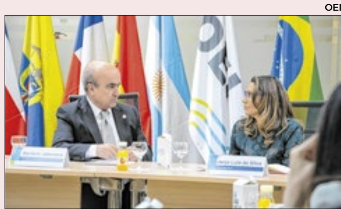
Janja em visita à OEI em abril de 2023

A OEI é uma organização multilateral que se propõe a promover desenvolvimento, especialmente em educação, nos diversos países da qual faz parte. O Brasil tem obrigações financeiras com ela. Mas, segundo a oposição, tais doações foram além das obrigações básicas.