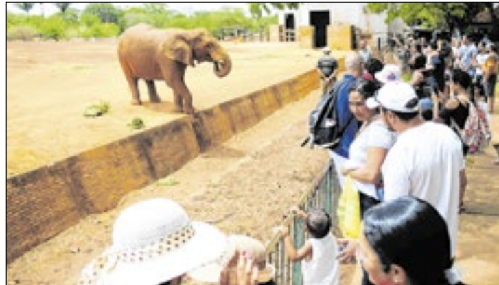
Além da gratuidade no sábado (8), elas concorrerão a sorteio