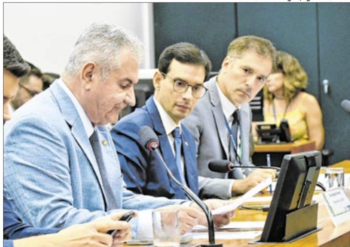
Coronel prevê votação do orçamento somente em 18 de março

Na avaliação do senador, como a semana do dia 11 será a primeira semana de trabalhos pós-carnaval, o ideal é que a CMO vote e aprove um texto “totalmente arredondado” para ser votado no plenário do Senado Federal. Para que isso ocorra, o relator fechou um acordo com o presidente da Casa, senador Davi Alcolumbre (União Brasil-AP), em que o tema será aprovado em 17 de março na CMO para ser deba-