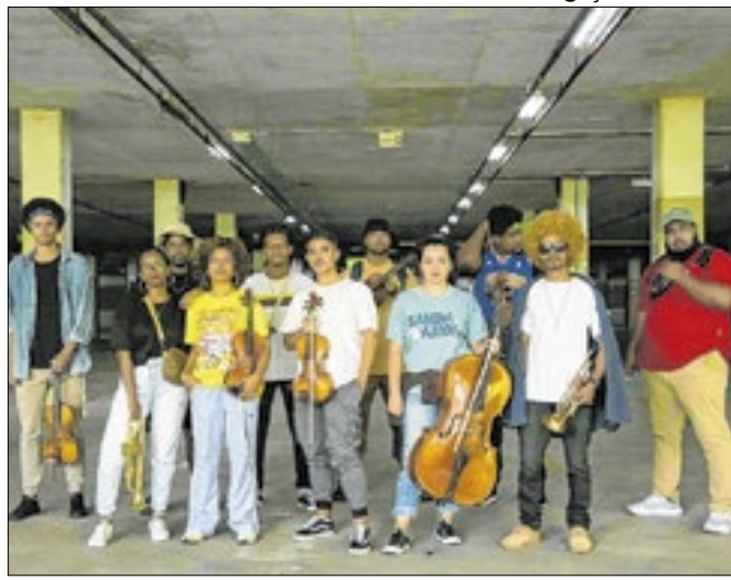
Evento na Ufes une música sinfônica e ritmos urbanos