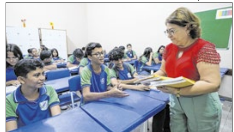
Professores estaduais receberão progressões salariais