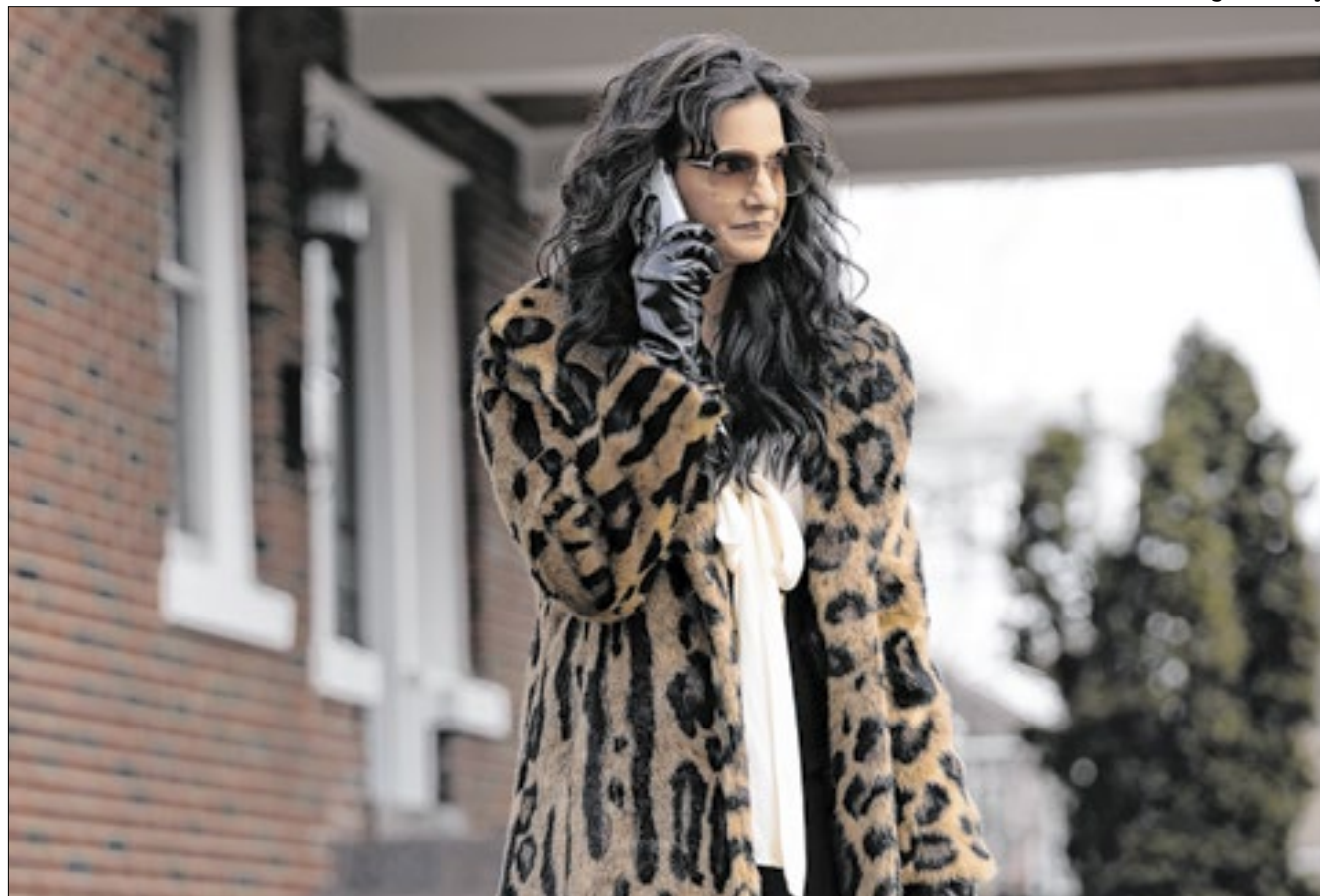
A atriz americana Poorna Jagannathan estudou na Universidade de Brasília e disse sentir saudade do país