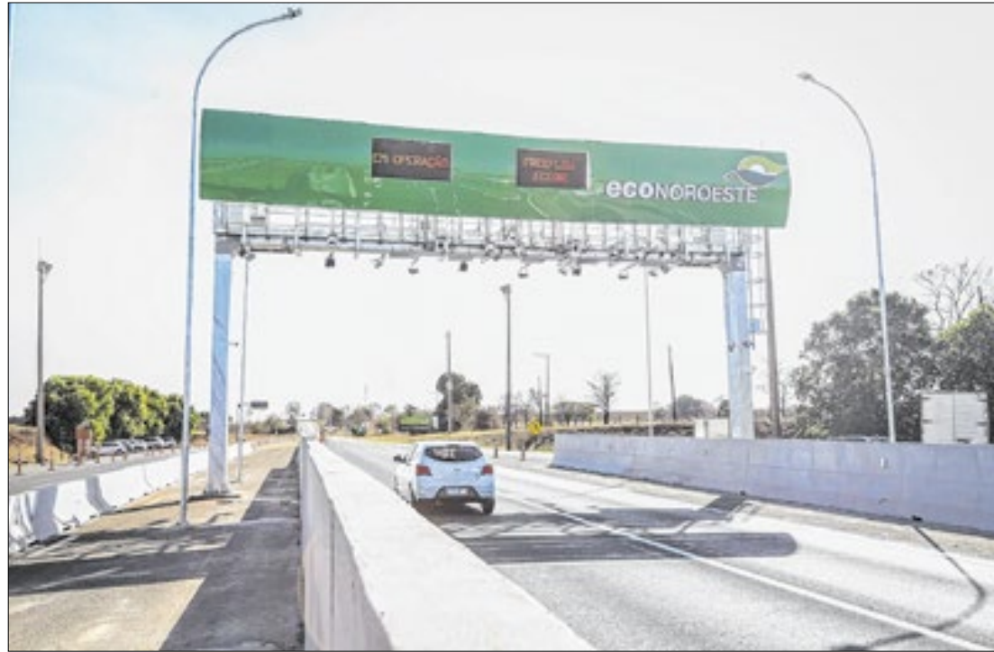
Pórtico free flow do Km 179 da Rodovia Laurentino Mascari (SP-333), em Itápolis

O Governo de São Paulo projeta a instalação de 58 pórticos equipados com o sistema de pedágio eletrônico free flow em rodovias estaduais nos atuais contratos concedidos à iniciativa privada até 2030. Atualmente, três pórticos estão em operação, segundo a Agência de Transporte do Estado de São Paulo (Artesp), responsável pela regulação dos contratos de concessão.