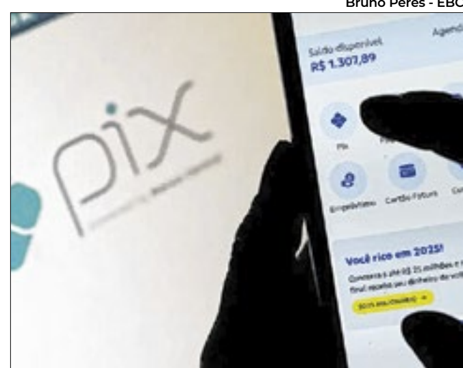
Medidas adotadas pelo BC visam evitar golpes com Pix