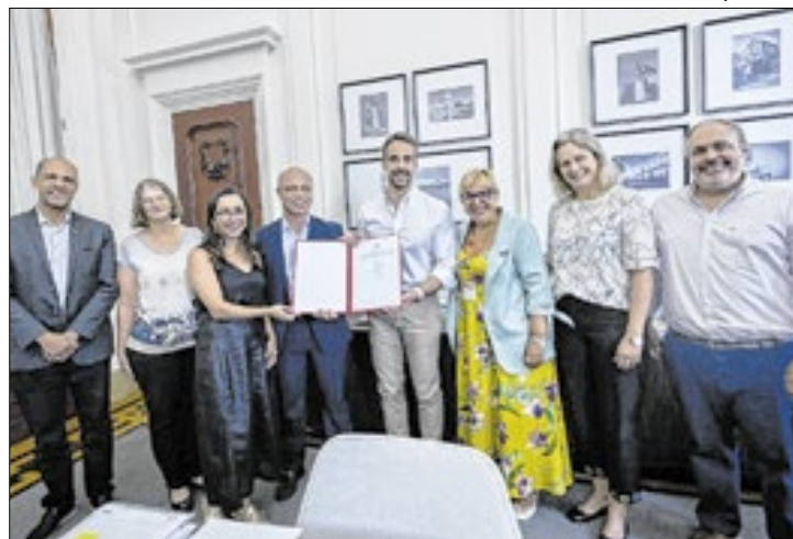
A proposta do CAS é ofertar 1.200 atendimentos