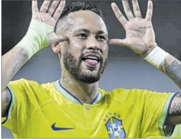
Retorno de Neymar Jr. será contra Colômbia e Argentina

505 dias após sofrer uma grave lesão que o deixou fora de ação por mais de um ano, Neymar está oficialmente de volta à Seleção Brasileira.