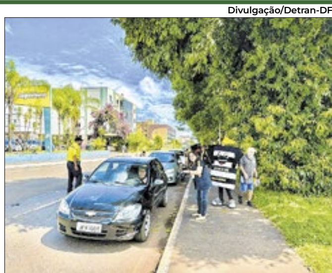
Ação para redução de acidentes e a valorização da vida

Moraes afastou culpa do governador pelos atos de 8 de janeiro