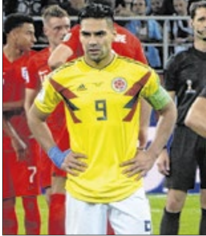
Lusa tentou trazer Falcao García

Oleg Bkhambri/Voltmetro/Wikimedia Commons