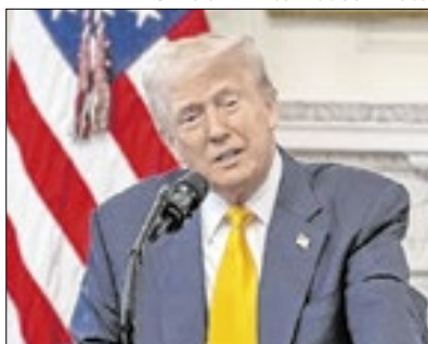
Trump tenta cumprir a promessa

de Educação não responderam imediatamente a pedidos de comentário.