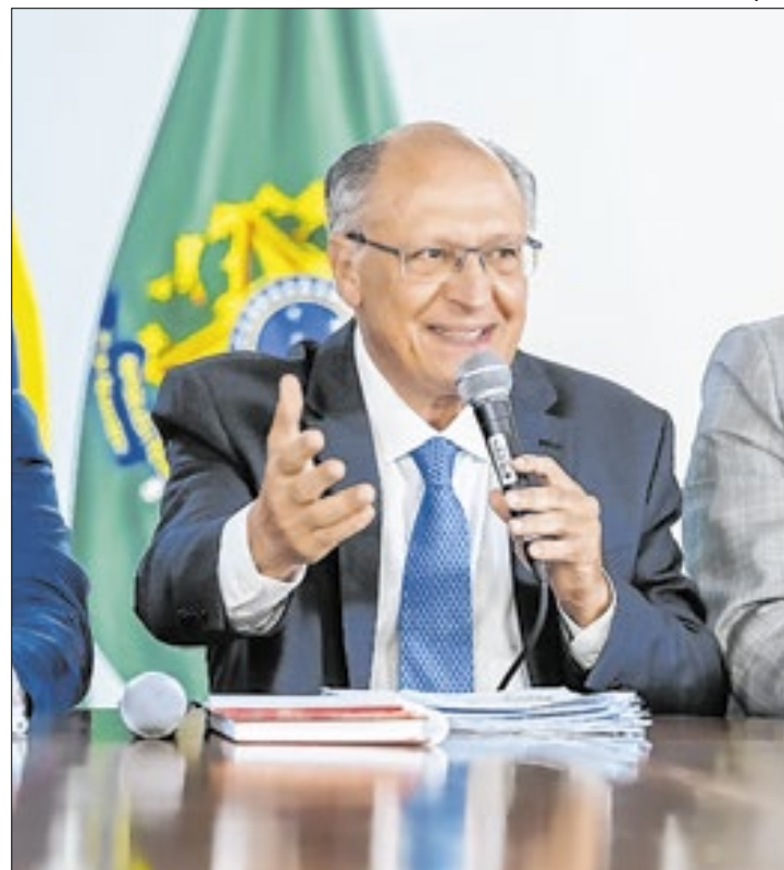
Alckmin anunciou as medidas para tentar baixar preços

As propostas do governo envolvem o estímulo para produ-