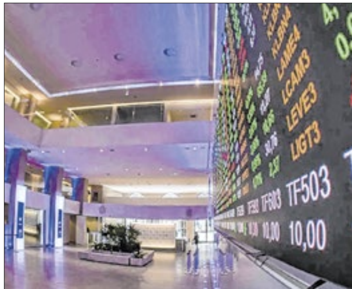
Altas de Vale e Gerdau garantem bolsa brasileira no positivo

Vindo de quatro sessões de correção, os preços do petróleo obtiveram leve alta nesta quinta-feira em Nova York e Londres, após a China prome-