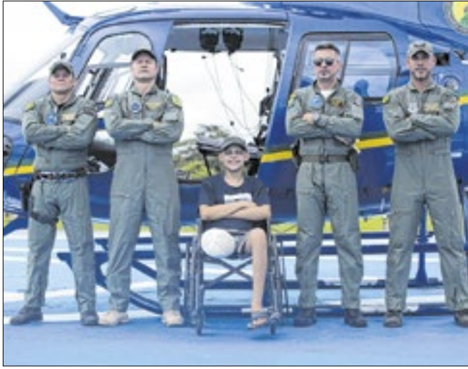
Militares disseram que a missão vai além da segurança