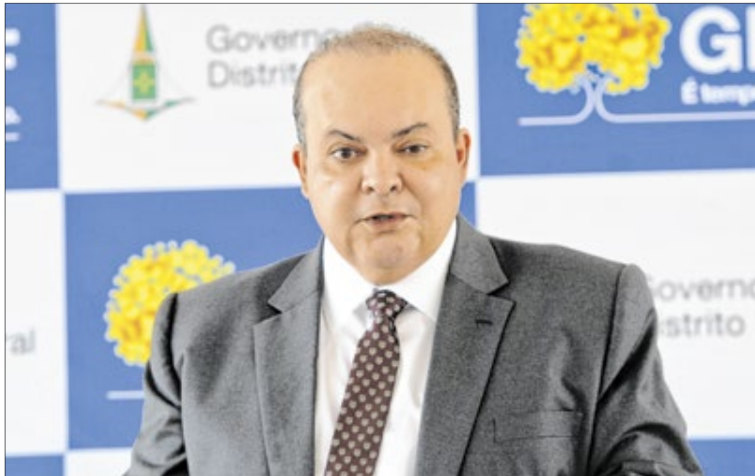
Ibaneis comemorou a decisão de Alexandre de Moraes