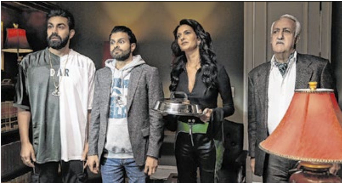
A série traz situações hilárias sobre uma família que se vê em meio ao tráfico internacional

o público sentisse o peso das situações e ainda assim pudesse gargalhar justamente por se tratar de um tema pesado", completou Asif.