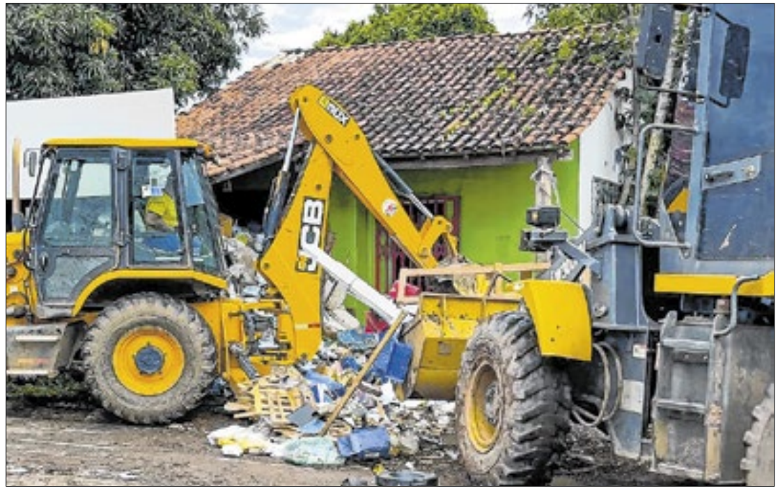
Segundo vizinhos, o local guardava lixo e atraía pragas há, pelo menos, quatro anos

A prefeitura de Porto Velho (RO) realizou a remoção de 260 toneladas de lixo de uma residência na rua Dom Pedro II, região central da cidade.