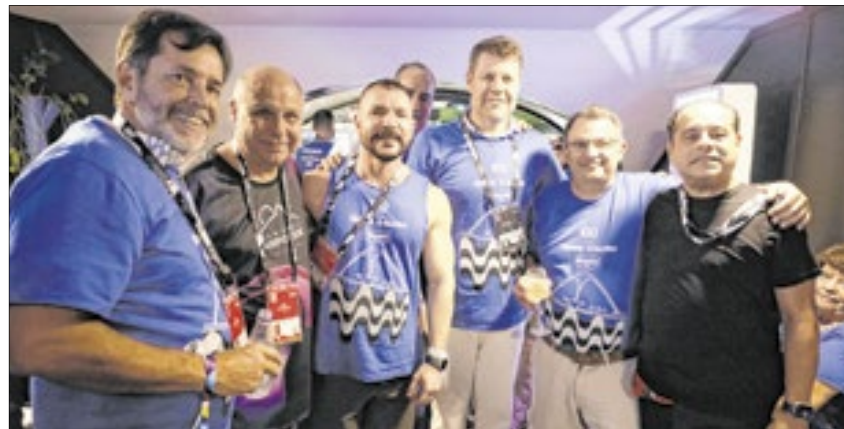
Na sequência: Sérgio Ricardo, da TurisRio; Marcos Simões, chefe de Gabinete da Casa Civil; Aguinaldo Ballon, presidente da Cedae; Gustavo Tutuca, o secretário de Turismo; Renan Saad, procurador-geral do estado; Adilson Faria, secretário de Planejamento