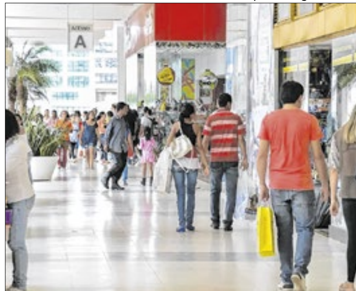
Financiamento por famílias volta a subir no mês de fevereiro

Em paralelo ao movimento de queda da inadimplência na cidade de São Paulo, o número de famílias que contrataram financiamentos voltou a subir. Em fevereiro, 67,7% dos lares encontravam-se nessa situação – em janeiro havia 67,2%, segundo a Pesquisa do Endividamento e Inadimplência do Consumidor (PEIC) da Federação do Comércio de Bens, Serviços e Turismo do Estado de São Paulo (FecomercioSP). Entretanto, na comparação anual, houve queda de 0,4 ponto percentual nesse número – que chegou a 71,7% na metade de 2024.