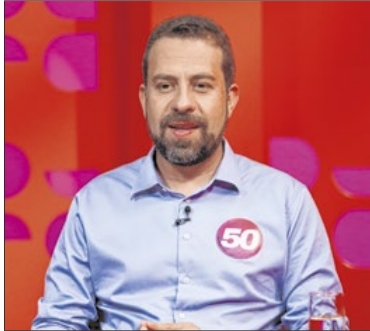
Boulos pode ser a opção para a Secretaria-Geral

A nomeação de Gleisi Hoffmann (PT) para a articulação política acendeu o debate sobre o novo titular da Secretaria-Geral da Presidência, vaga para a qual a petista já esteve cotada. O presidente Luiz Inácio Lula da Silva (PT) avalia o nome do deputado federal Guilherme Boulos (Psol-SP) para o cargo, caso deseje substituir Márcio Macêdo, também do PT.