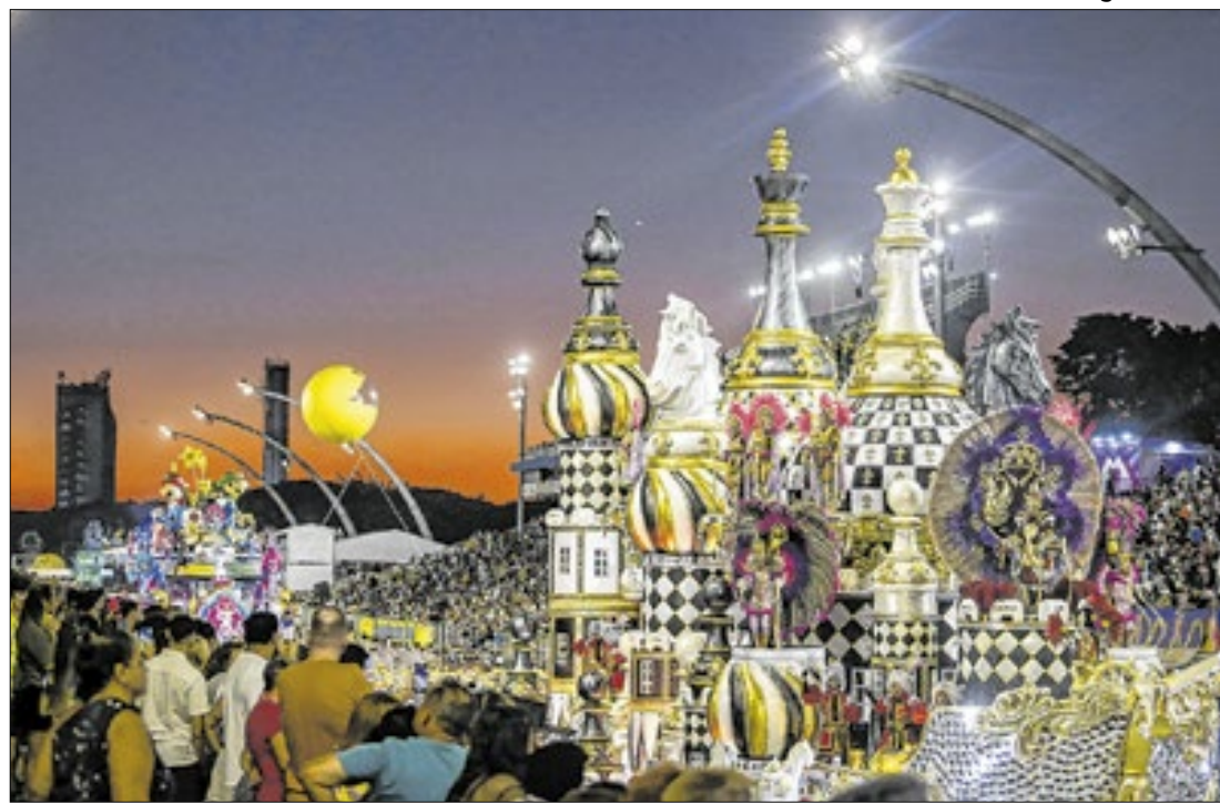
Rosas de Ouro trouxe a história dos jogos para a avenida do Anhembi

A Sociedade Rosas de Ouro foi a grande vencedora do desfile das escolas de samba do carnaval de São Paulo de 2025. A agremiação obteve 269,8 pontos, seguida da Acadêmicos do Tatuapé (269,8 pontos) e da Gaviões da Fiel (269,7 pontos).