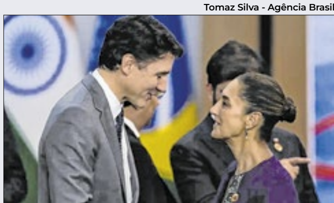
Tomaz Silva - Agência Brasil

A confirmação das tarifas a Canadá, México e China ocorre no mesmo dia em que dados sobre o setor industrial dos EUA mostraram ‘fragilidade industrial e impactos negativos do tarifaço. O megainvestidor Warren Buffet classificou a medida como ‘ato de guerra’.