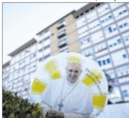
Em Roma, fiéis oram pelo Papa