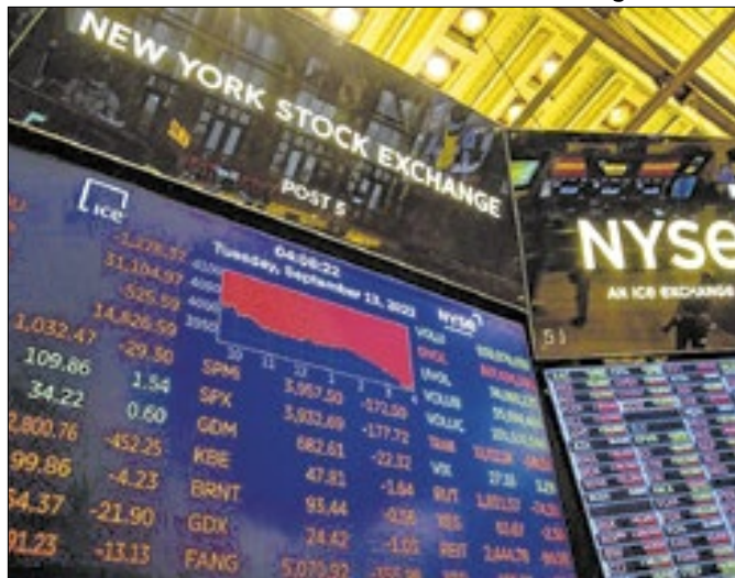
‘Tiro pela culatra’: tarifaço de Trump afeta a própria casa