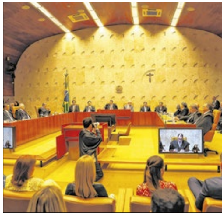
STF alinha-se ao governo em 90% dos casos

Desde o início deste mandato, o governo do presidente Lula (PT) registrou decisões em linha com as suas posições e obteve uma sucessão de vitórias no Supremo Tribunal Federal (STF) por meio da Advocacia-Geral da União (CGU).