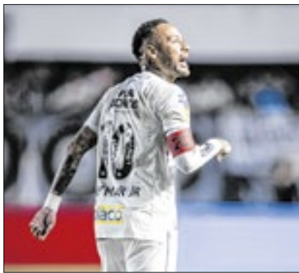
Santos quer Neymar até a Copa

adaptação. As próximas metas são levar o Santos à final do Paulistão e a convocação à Seleção.