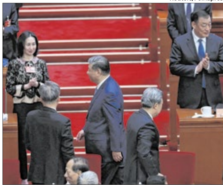
China responde ações dos EUA com taxação de produtos

A medida chinesa entra em vigor no próximo dia 10. Será imposta uma tarifa adicional de 15% sobre frango, trigo, milho e algodão e de 10% sobre sorgo, soja, carne suína, bovina, pro-