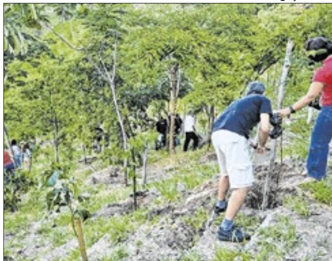
Belo Horizonte mantém arborização urbana