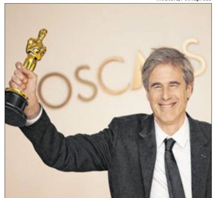
Diretor comemora vitória com estatueta do Oscar