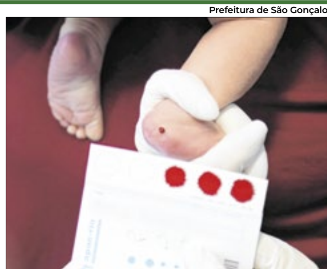
Prefeitura de São Gonçalo

Exame deve ser feito antes do quinto dia vida do bebê