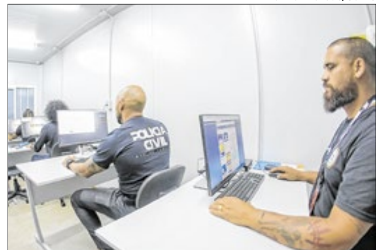
Uso de tecnologia fortalece atendimento da Polícia Civil

o App é interligado ao Sistema Integrado da Polícia Civil, o Sipol, o que permite aos policiais civis acessarem informações cruciais sobre pessoas e veículos diretamente de seus dispositivos móveis.