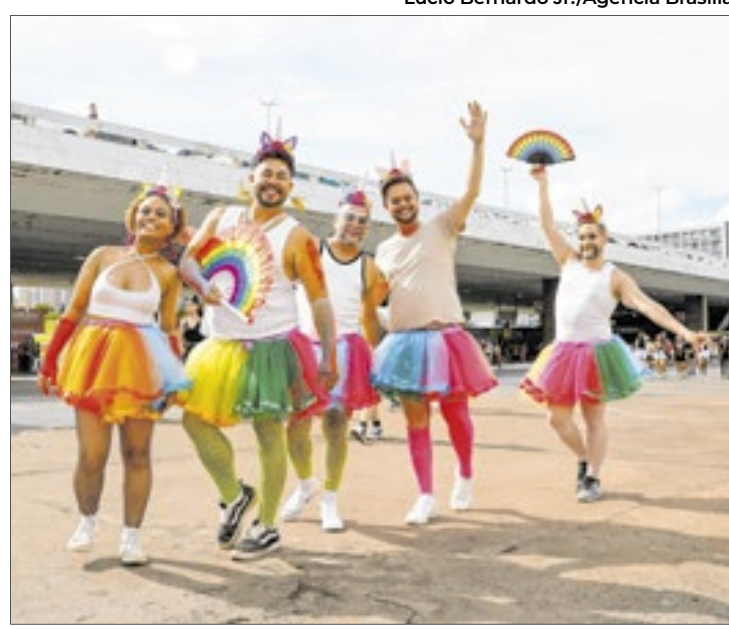
"O programa 'Vai de Graça' é um sucesso", avalia o secretário de Mobilidade do DF, Zeno Gonçalves

"O programa é um sucesso!", comemorou o secretário de Transporte e Mobilidade do DF, Zeno Gonçalves, em conversa com "Brasilianas". "Temos relatos de usuários também surpresos, positivamente, com o programa", completou.