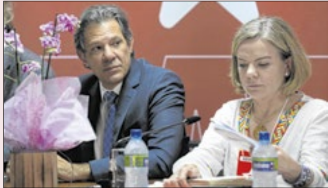
Haddad e Gleisi agora: apoio ou "austericídio"?