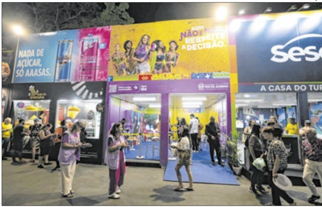
Distribuição de panfletos no Sambódromo para o público

93,80%, seguido por Araraial do Cabo (93,70%), Cabo Frio (92,20%), Angra dos Reis (90,50%), Teresópolis (89,60%), Nova Friburgo (85,40%), Vassouras (84,30%), Valença/Conservatória (84,10%), Petrópolis (83,60%), Armação dos Búzios (82,70%), Rio das Ostras (80,20%), Paraty (79,60%), Itatiaia/ Penedo (77,50%) e Macaé (75,50%).