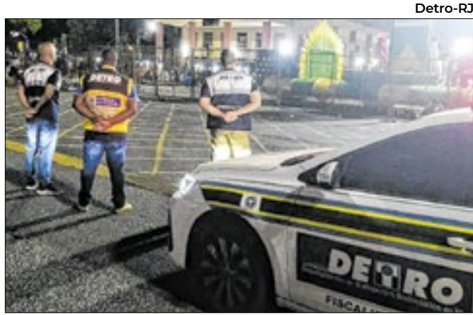
Equipes estão nos arredores da Sapucaí