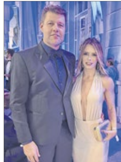
O casal Andreza Borges e Gustavo Tutuca, secretário de estado de Turismo do RJ