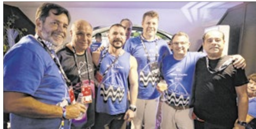
Na sequência: Sérgio Ricardo, da TurisRio; Marcos Simões, chefe de Gabinete da Casa Civil; Aguinaldo Ballon, presidente da Cedae; Gustavo Tutuca, o secretário de Turismo; Renan Saad, procurador-geral do estado; Adilson Faria, secretário de Planejamento