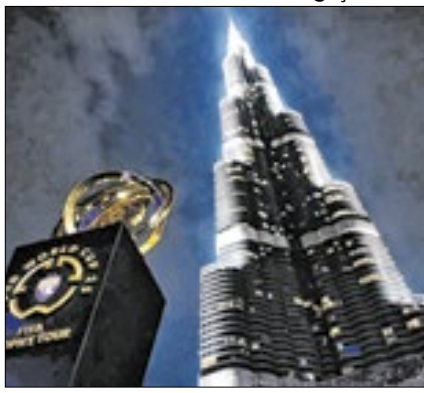
Taça foi exposta no Burj Khalifa

A Copa do Mundo de Clubes da FIFA, que vem sendo popularmente chamado de 'Supermundial FIFA' está investindo pesado na divulgação. O tão sonhado troféu do torneio está viajando pelo mundo, visitando os países de todos os clubes que estarão no torneio, que acontecerá em junho, no EUA. Na quarta (26), ele chegou aos Emirados Árabes Unidos, onde a torcida do Al Ain fez fila para vê-lo de perto.