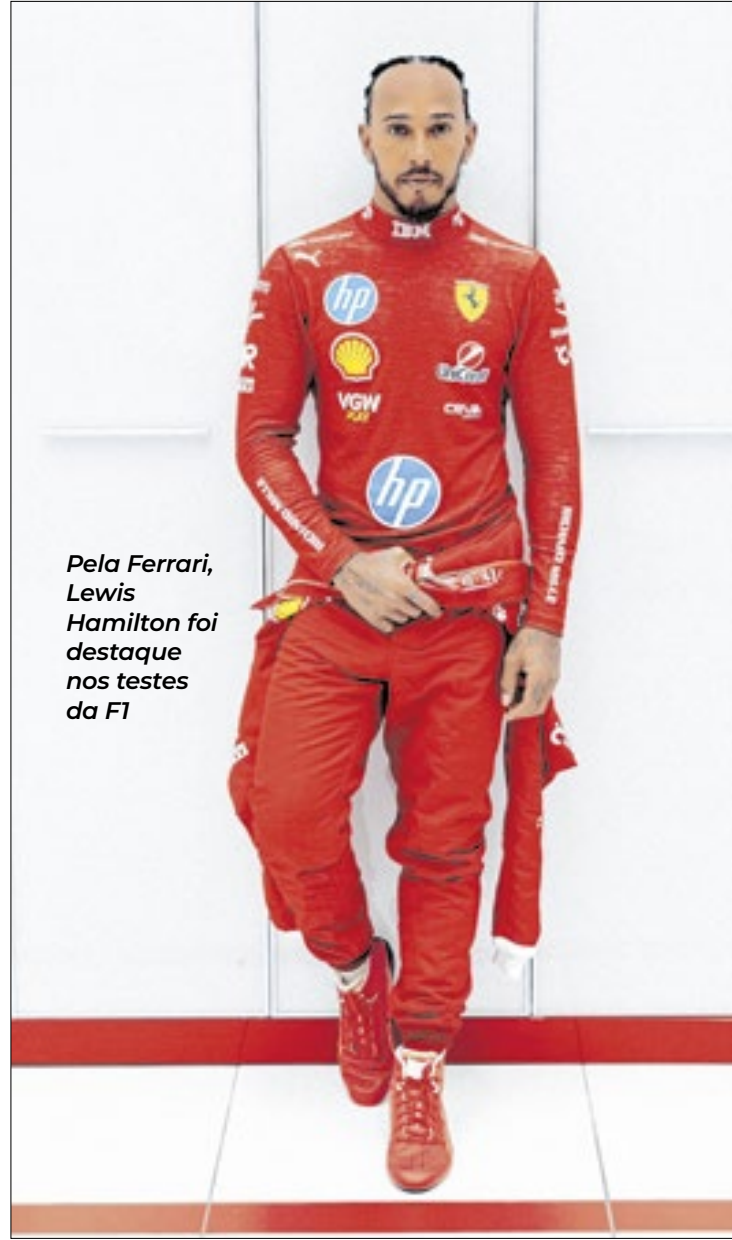
Pela Ferrari, Lewis Hamilton foi destaque nos testes da F1

A Red Bull, por sua vez, teve uma perda de pressão de água no motor e Liam Lawson perdeu mais de uma hora do teste da manhã e deu apenas 28 voltas. Para efeito de comparação, Russell deu