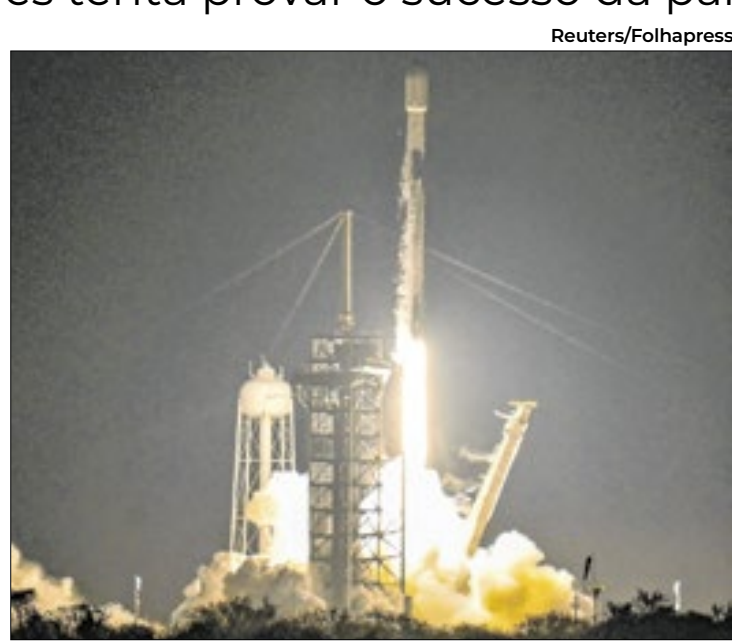
O módulo Athena deve tentar pouso na próxima quinta (6)

Até agora, foram três os lançamentos - o primeiro da Astrobotic, de Pittsburgh, fracassou ainda no trajeto para a Lua, por um vazamento de combustível, após um lançamento em 8 de janeiro do ano passado. O segundo, da Intuitive Machines, viu o módulo de pouso Odys-