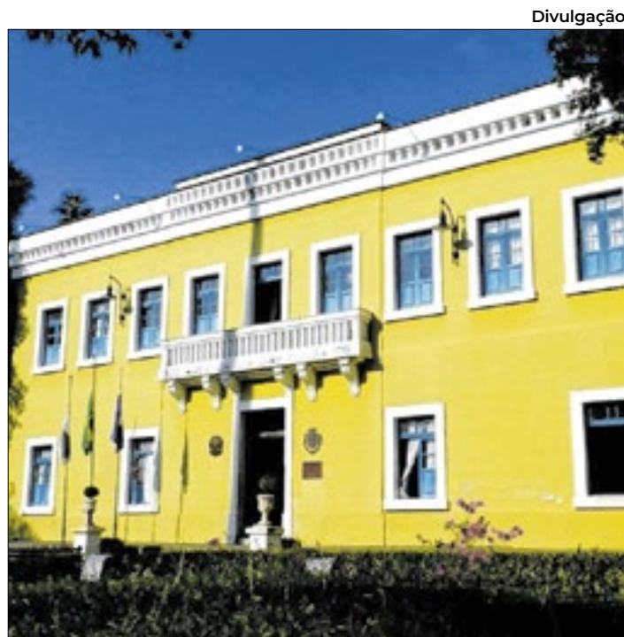
Reunião na prefeitura discute transporte público

"A Secretaria de Ordem Pública tem apresentado resultados expressivos", disse.