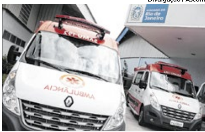
Base do Samu ficará em Visconde de Mauá