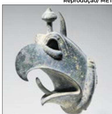
Artefato foi devolvido à Grécia

O Museu Metropolitano de Nova York, o Met, devolveu ao Museu Arqueológico de Olímpia, na Grécia, uma cabeça de bronze de grifo do século 7 a.C. O artefato desapareceu da instituição grega nos anos 1930 e foi vendido, algumas décadas depois, no mercado de arte dos EUA.