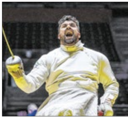
Brasil conquistou seis medalhas

O Brasil encerrou a etapa de São Paulo da Copa do Mundo de paraesgrima com a conquista de seis medalhas (2 pratas e 4 bronzes). A competição foi realizada no Centro de Treinamento Paralímpico.