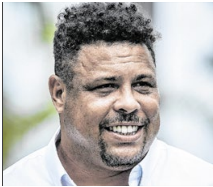
Ronaldo Fenômeno sonha em assumir a presidência da CBF