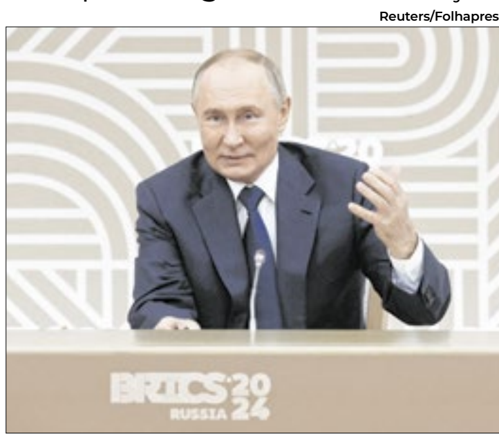
Enquanto há negociações, mega-ataques seguem em curso

niana, foram derrubados 133 de 213 drones e 6 de 7 mísseis de cruzeiro lançados a partir do fim da madrugada. Houve danos em diversas regiões do país, e ao menos uma pessoa morreu. A vizinha Polônia mobilizou caças, mas não houve violação de seu espaço aéreo.