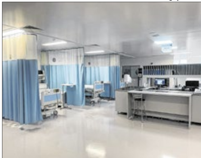
Hospital Regional do Oeste em Chapecó