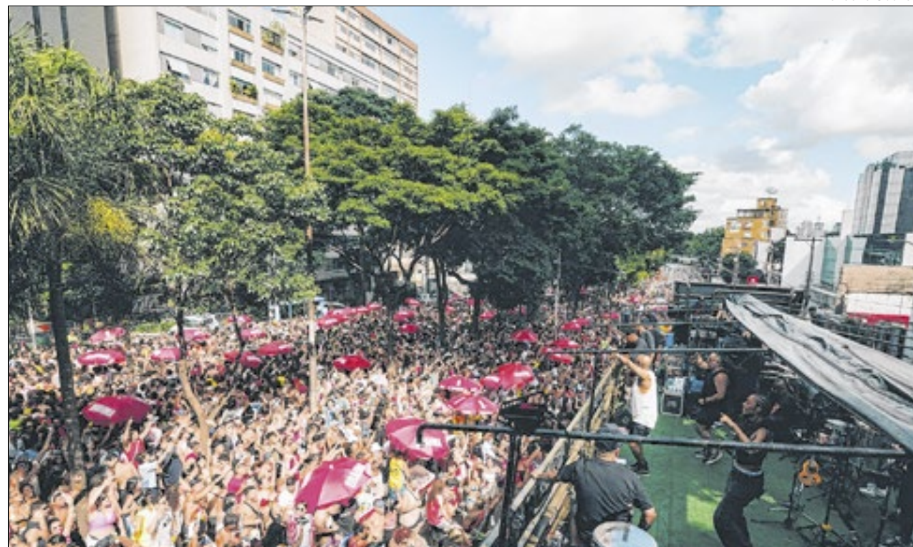
Tradicional bloco da capital paulista foi às ruas no último sábado

A concentração teve início às 11h e o desfile começou ao meio-dia, arrastando foliões até às 16h em um espetáculo de nostalgia. No palco, grandes atrações garantiram a animação do público: o grupo Tchakabum levantou a galera com sucessos como "Onda Onda (Olha a Onda)", enquanto Salgadinho, ex-vocalista do Katinguelê, emocionou com hits do pagode romântico. O Baile da DZ7 trouxe remixes exclusivos que misturaram o melhor do funk e do pagode, consolidando a tradição de anos com o bloco. E claro, a banda oficial do Bloco Casa Comigo também marcou presença, completando a festa com um repertório recheado de clássicos da época e também das músicas originais lançadas pelo bloco nos últimos 13 anos.