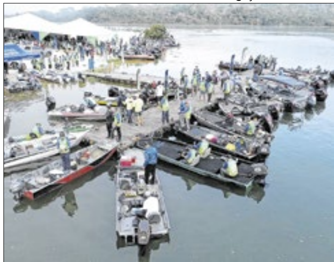
Novos municípios estão no calendário de competições