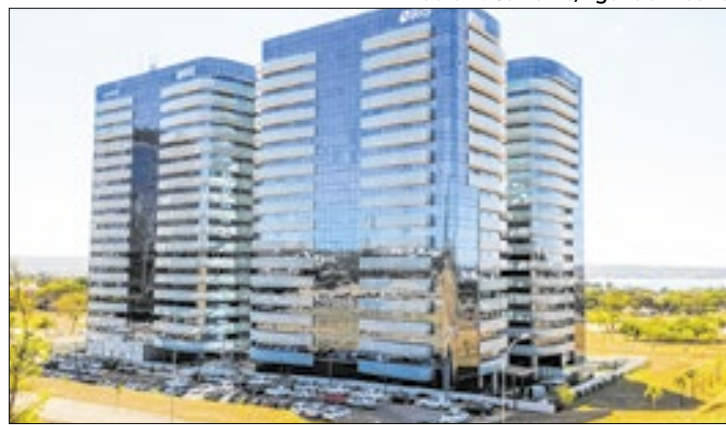
Banco foi reconhecido pela International Banker