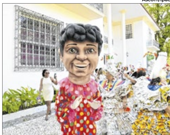
O baile vai ser promovido pelo Museu de Arte da Bahia