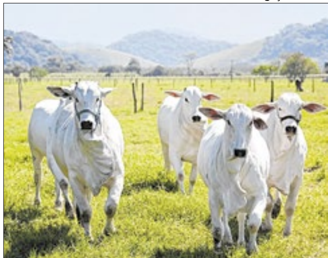
Contribuição ao fundo será opcional na emissão da GTA