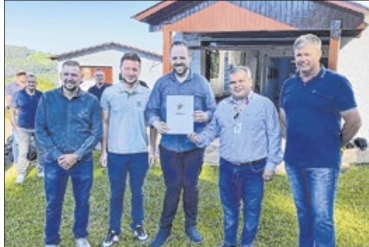
Governo autoriza investimento de R$ 1,5 milhão