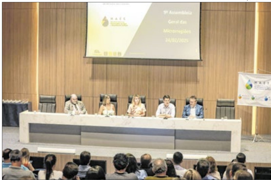
O evento serviu para repassar informações sobre o desenvolvimento do segmento

As microrregiões foram criadas por lei em 2021 e em 2023 prefeitos e representantes de prefeituras aprovaram a