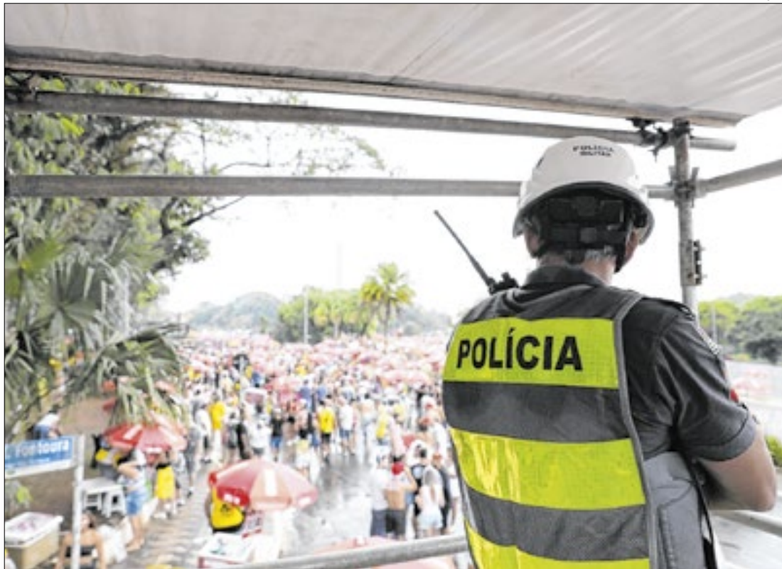
Sete pessoas foram presas durante o último fim de semana em São Paulo

A Polícia Civil de São Paulo prendeu sete pessoas no último fim de semana utilizando policiais com fantasias infiltrados em blocos de rua da capital. Entre sábado (22) e domingo (23), ao menos 30 celulares foram recuperados pelos agentes.