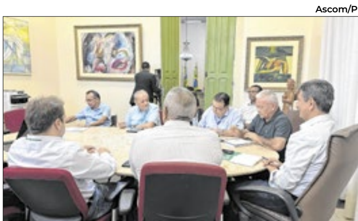
Capacitações para o setor estão em pauta

A criação do cinema de rua é uma antiga reivindicação do setor cultural do estado, que lutava por um espaço que proporcionasse visibilidade às produções locais e ampliasse o acesso a filmes que não entram no circuito comercial.