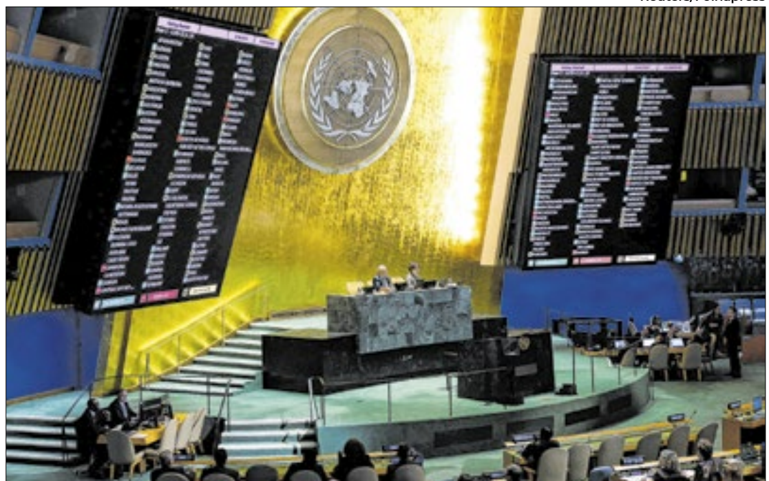
Brasil se absteve na votação realizada pela Assembleia-Geral da ONU, em Nova York