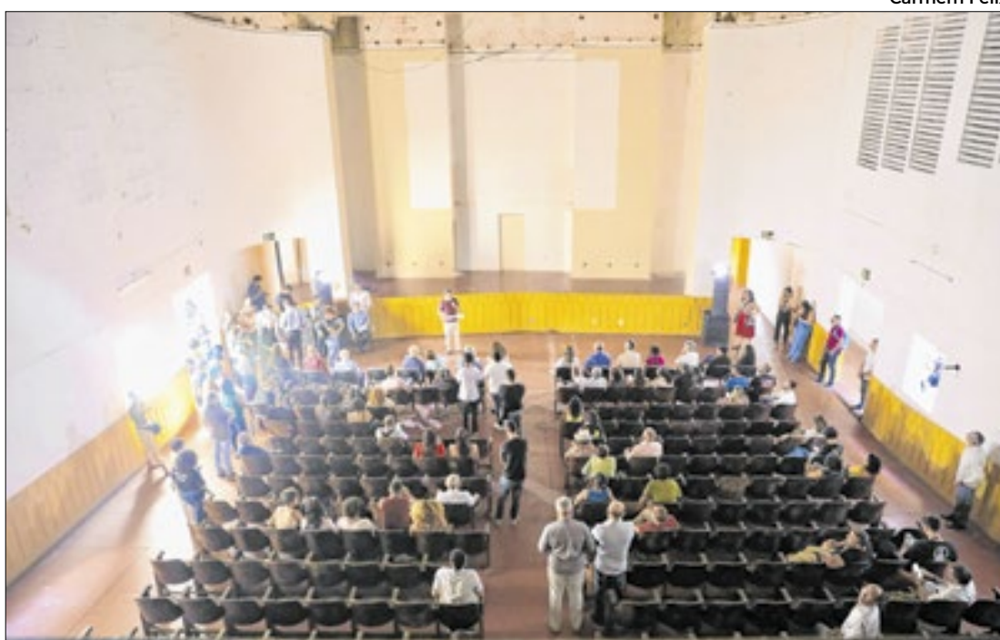
Na solenidade, foi assinado o processo de tombamento do prédio

Estado assina desapropriação e tombamento do Cine Panorama