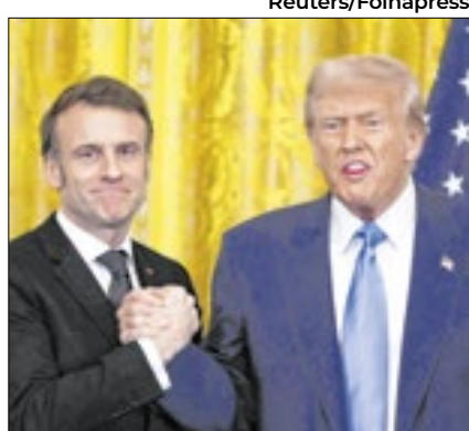
Emmanuel Macron com Trump

O presidente francês, Emmanuel Macron, esteve na Casa Branca nesta segunda-feira (24), onde apresentou ao presidente dos EUA, Donald Trump, "propostas" de paz na Ucrânia e