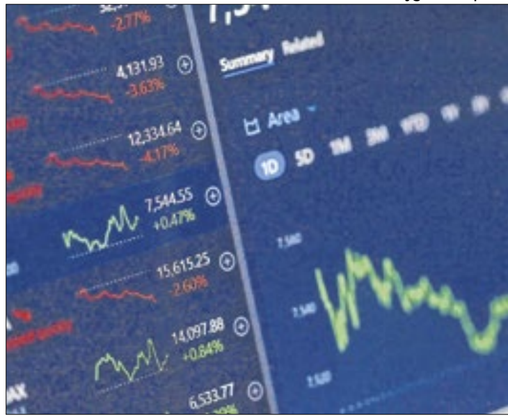
Tensão por pronunciamento presidencial derrubou mercado

A semana começou com o Ibovespa em baixa acima de 1% e atenção voltada à fala sobre macroeconomia do presidente Luiz Inácio Lula da Silva em novo evento de “retomada” da indústria naval brasileira.