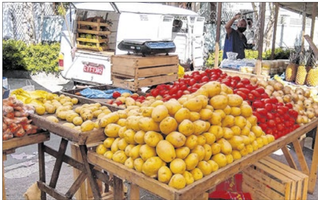
Avanço da previsão do IPCA para 2026, o ‘horizonte relevante’, preocupa o mercado

Enquanto a perspectiva de avanço inflacionário se mantém firme, a ‘paralisia’ parece ter dominado a expectativa da ‘banca’, no que toca à economia, uma