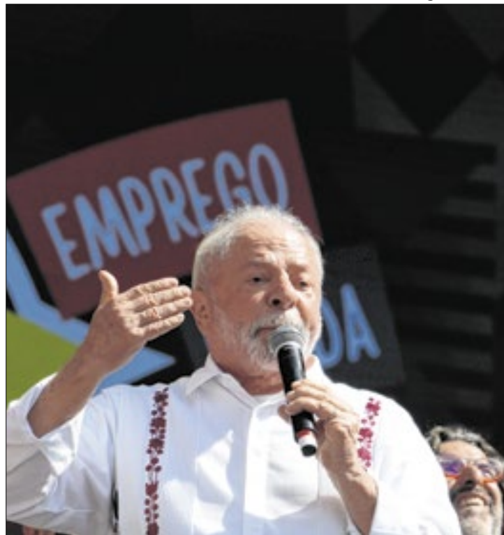
Lula chama sindicalistas por melhor popularidade

Com a medida, o trabalhador poderá retirar apenas o montante correspondente à multa rescisória (que é indenização que o empregador paga ao empregado quando o contrato de trabalho é encerrado), no valor de 40% do FGTS em caso de demissões sem justa causa e não terá acesso ao total acumulado na conta do fundo.