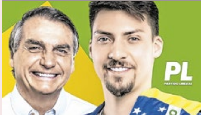
Quantos carros tem Jair Renan? Tarefa dos arapongas