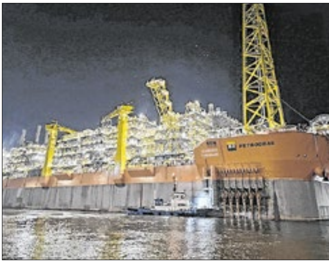
Campo de Búzios deve atingir 1 milhão de barris/dia