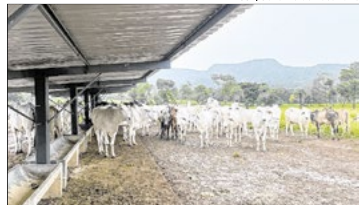
Ação conjunta localiza animais em propriedades rurais