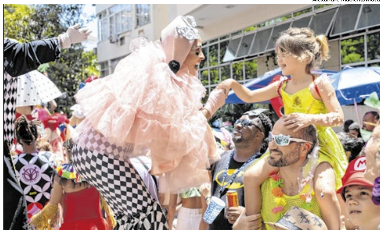
O Gigantes da Lira foi um dos blocos que animaram o fim de semana dos cariocas

dente, com ensaios, vaquinhas e muito amor pela festa", ressaltou a cantora.