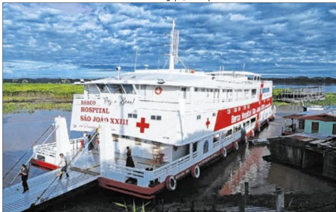
O barco levou serviços médicos à comunidade que é acessível somente por vias fluviais